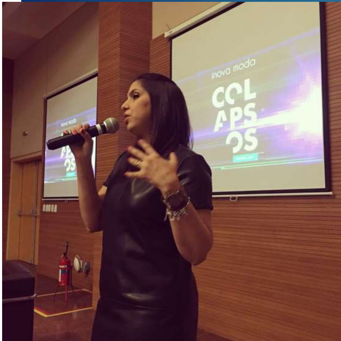
Realização de Palestras – Projeto Inova Moda (SENAI/SEBRAE) Salvador-BA