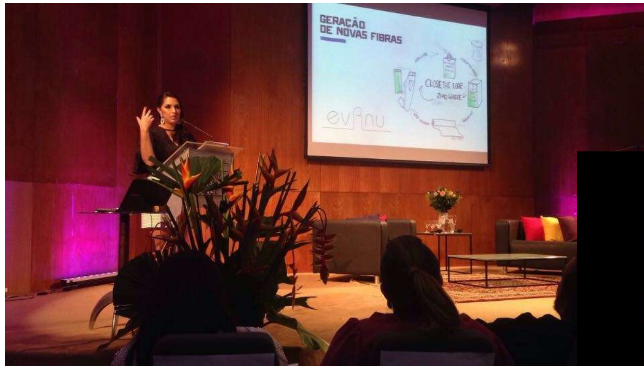
Palestrante- Projeto Inova Moda (SENAI/SEBRAE) Fortaleza-CE