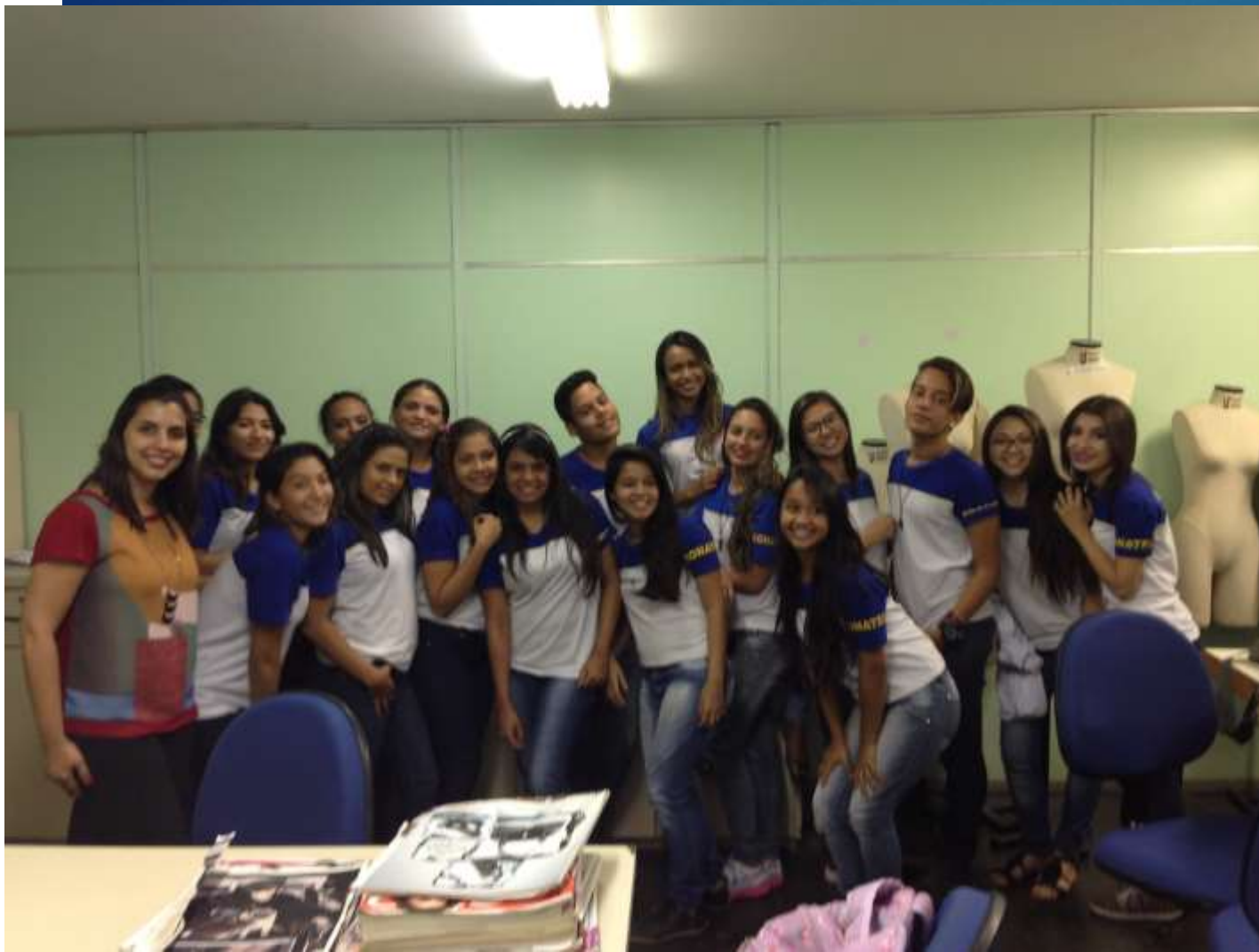
Realização de Oficinas de Criação Projeto Inova Moda (SENAI/SEBRAE) – Fortaleza-CE