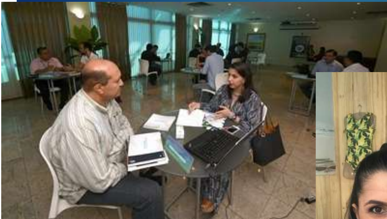
Consultoria – Rodada de Negócios – CIN/FIEC