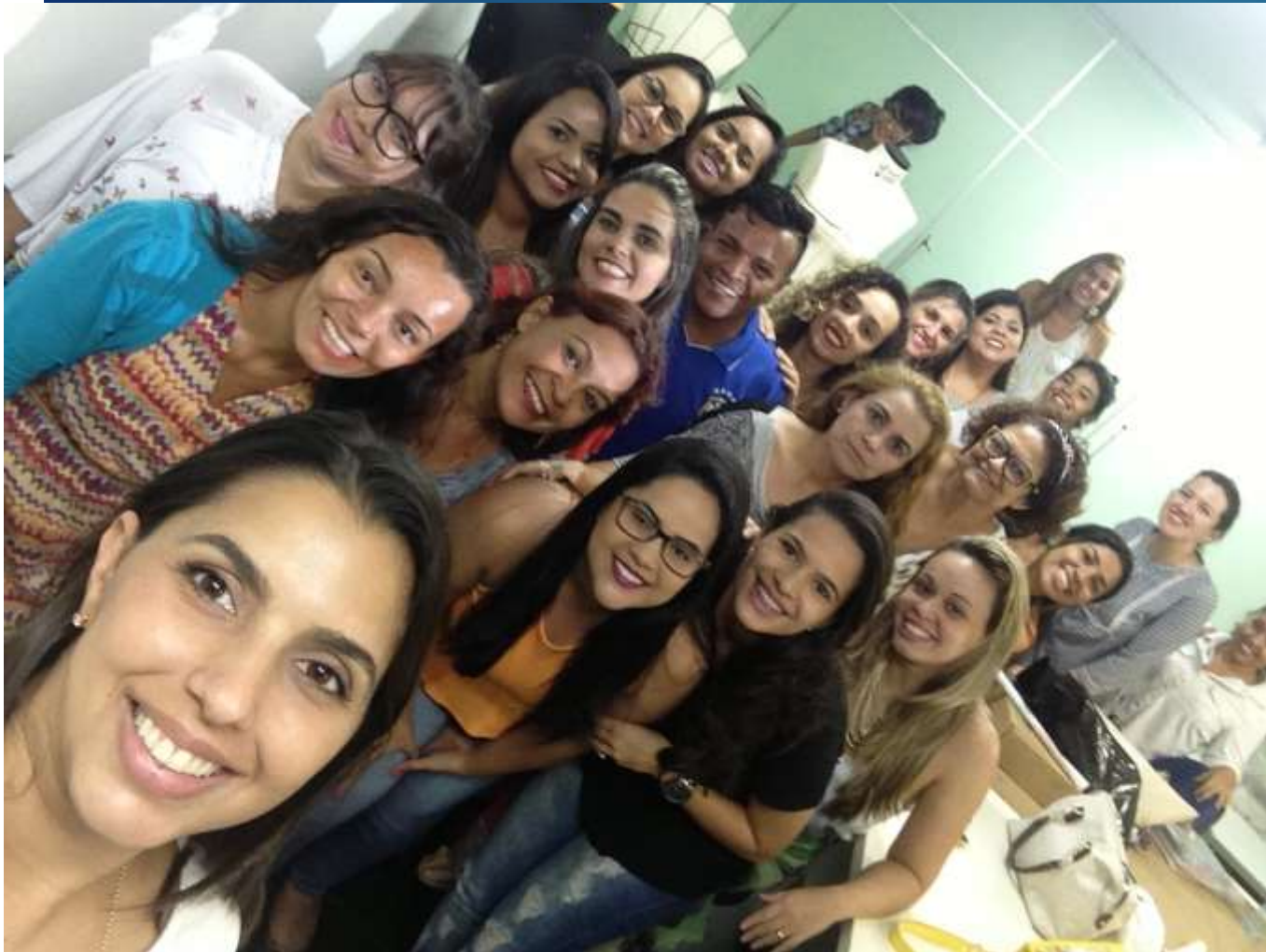
Realização de Oficinas de Criação Projeto Inova Moda (SENAI/SEBRAE) – Fortaleza-CE