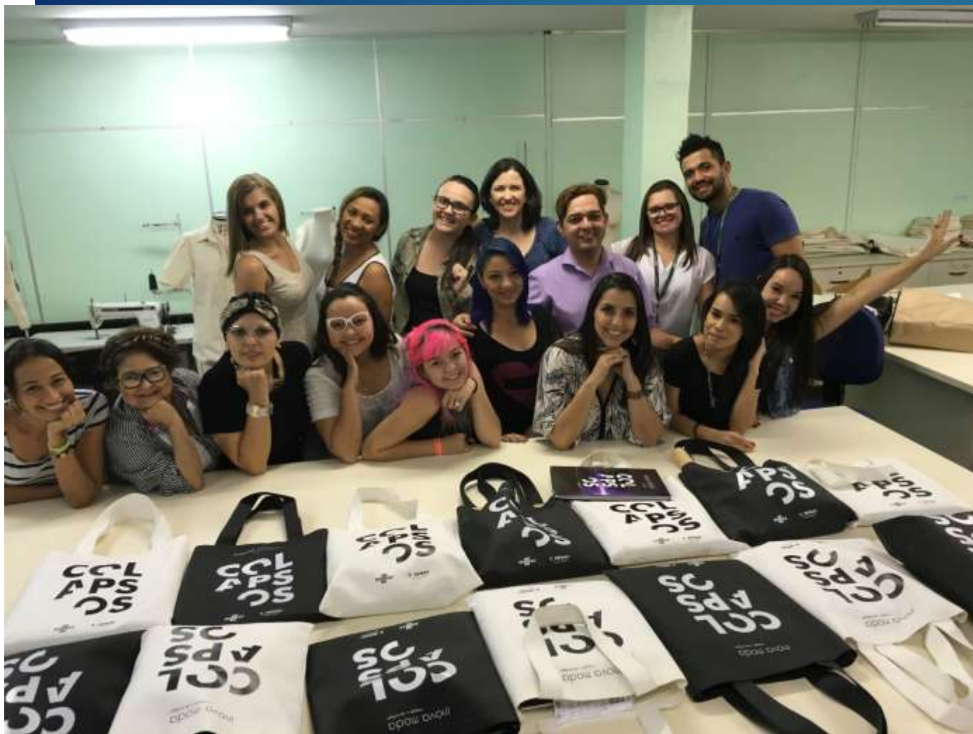
Realização de Oficinas de Criação Projeto Inova Moda (SENAI/SEBRAE) – Fortaleza-CE