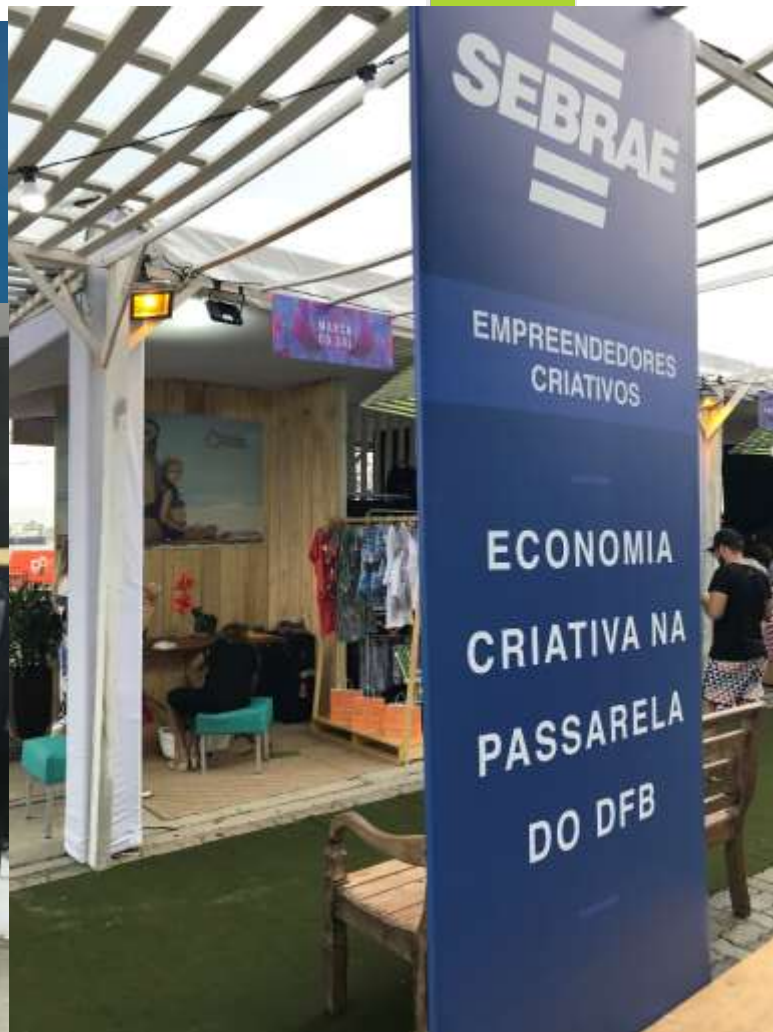
Consultoria – Projeto da Moda SEBRAE – Dragão Fashion Brasil 2018