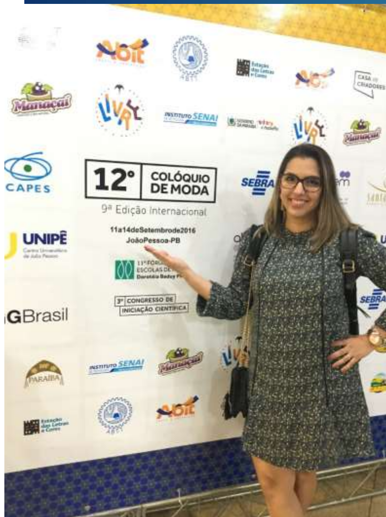
Apresentação de Artigo no Colóquio de Moda