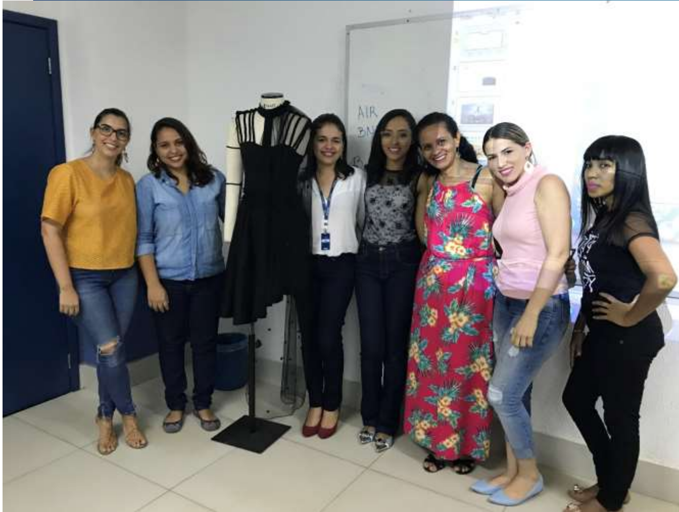
Banca de apresentação dos Projetos Interdisciplinares Design de Moda – Faculdade Ateneu