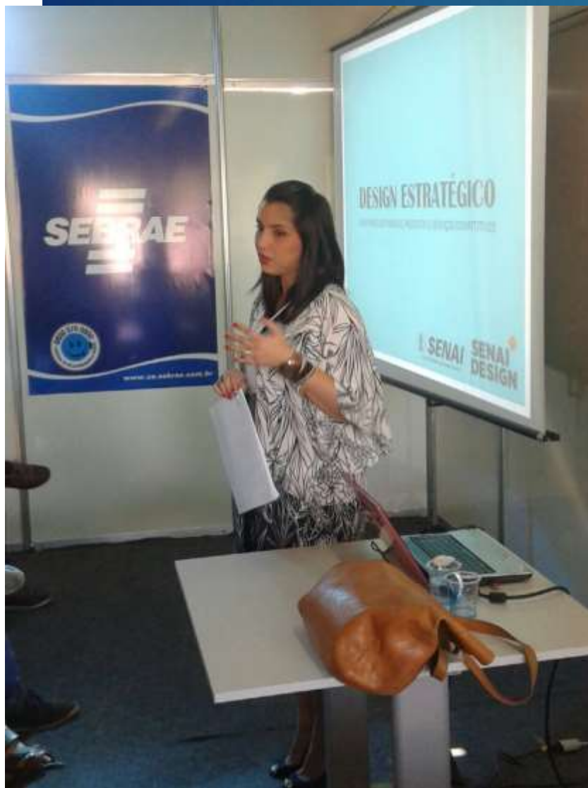
Palestra Design Estratégico - Feira do Empreendedor 2015 Juazeiro do Norte-CE