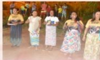
Dramista de São Vicente - Selo Cultural de Comunidade de Santa Urzula

Este movimento cultural mostra-se importante, por dar as mulheres de nossa comunidade e região, voz ativa na quebra de preconceitos sofridos pela mulher perante a sociedade, e recontando dramas de seu cotidiano, a partir do fomento cultural, mulheres do campo, negras, indígenas, portadoras de necessidades especiais da comunidade, transmitem por meio de versos cantados por elas mensagens de quebra tabus e preconceitos que a sociedade impõe sobre a figura da mulher, e unindo aos versos mensagens de amor, respeito e louvores em homenagem ao Deus menino, convidando ao público expectadora participar deste momento de confraternização, O projeto conta o Apoio cultural do Governo do Estado do Ceará, Secretaria da Cultura através do XIV Edital Ceará Ciclo Natalino 2019, e apoio da Associação Comunitária Sônia Maria - ACSM, CriArtes-Produções & Eventos e Secretaria de Cultura de Meruoca..