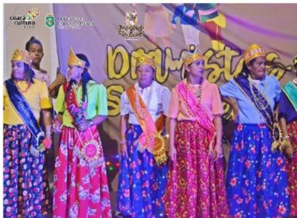
Apresentação no distrito de Palestina

O projeto contou ainda com a realização de uma oficina de produção artesanal que foi realizada na Biblioteca comunitária Criança Feliz, localizada na comunidade; a oficina promoveu a formação artística e a troca de saberes, culminando com roda de conversa orquestrada pelas integrantes do grupo de dramistas e que abordou como temática a preservação das tradições que envolvem a arte dos dramas. A oficina contou com a participação de uma interprete de libras, afim de atender o público portador de surdez participante e atuando nos quesitos de acessibilidade cultural.