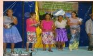
Dramista de São Vicente - II Festival de Arte e Ecologia