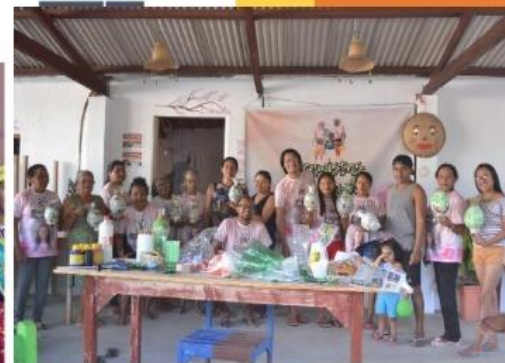
Oficina de produção artística