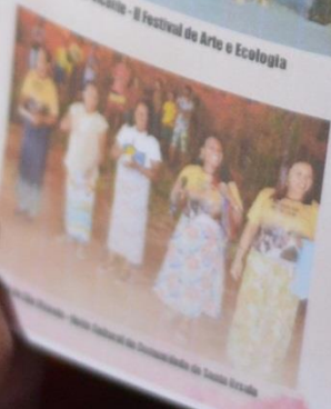
Mostra Cultural do Comendado da Serra da Meruoca

Este movimento cultural mostra-se importante, por dar as mulheres de nossa comunidade e região, voz ativa na quebra de preconceitos sofridos pela mulher perante a sociedade, e recontando dramas de seu cotidiano, a partir do fomento cultural, mulheres do campo, negras, indígenas, portadoras de necessidades especiais da comunidade, transmitem por meio de versos cantados por elas mensagens de quebra tabus e impõe sobre a figura da mulher, e unindo aos versos mensagens de amor, respeito e louvores em homenagem ao Deus pai, convidando ao público expor a participação deste momento de confraternização, O projeto de Apoio cultural do Governo do Estado do Ceará, Secretaria de Cultura através do XIV Edital Ceará Natalino 2019, com o apoio da Associação Comunitária Sônia Maria - ACSM, CriArtes Produções & Eventos e Secretaria de Cultura de Meruoca.