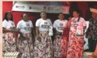
Dramista de São Vicente - 1ª Mostra Dramática Comunitária de Meruoca