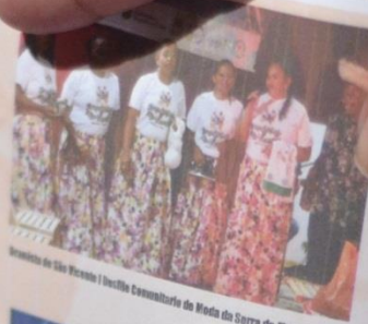
Mostra de São Vicente | Iniciação Comunitária de Moda da Serra da Meruoca