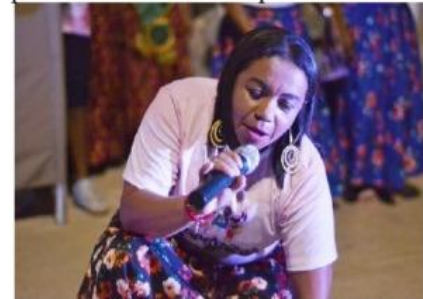
Apresentação na comunidade Sítio Recife