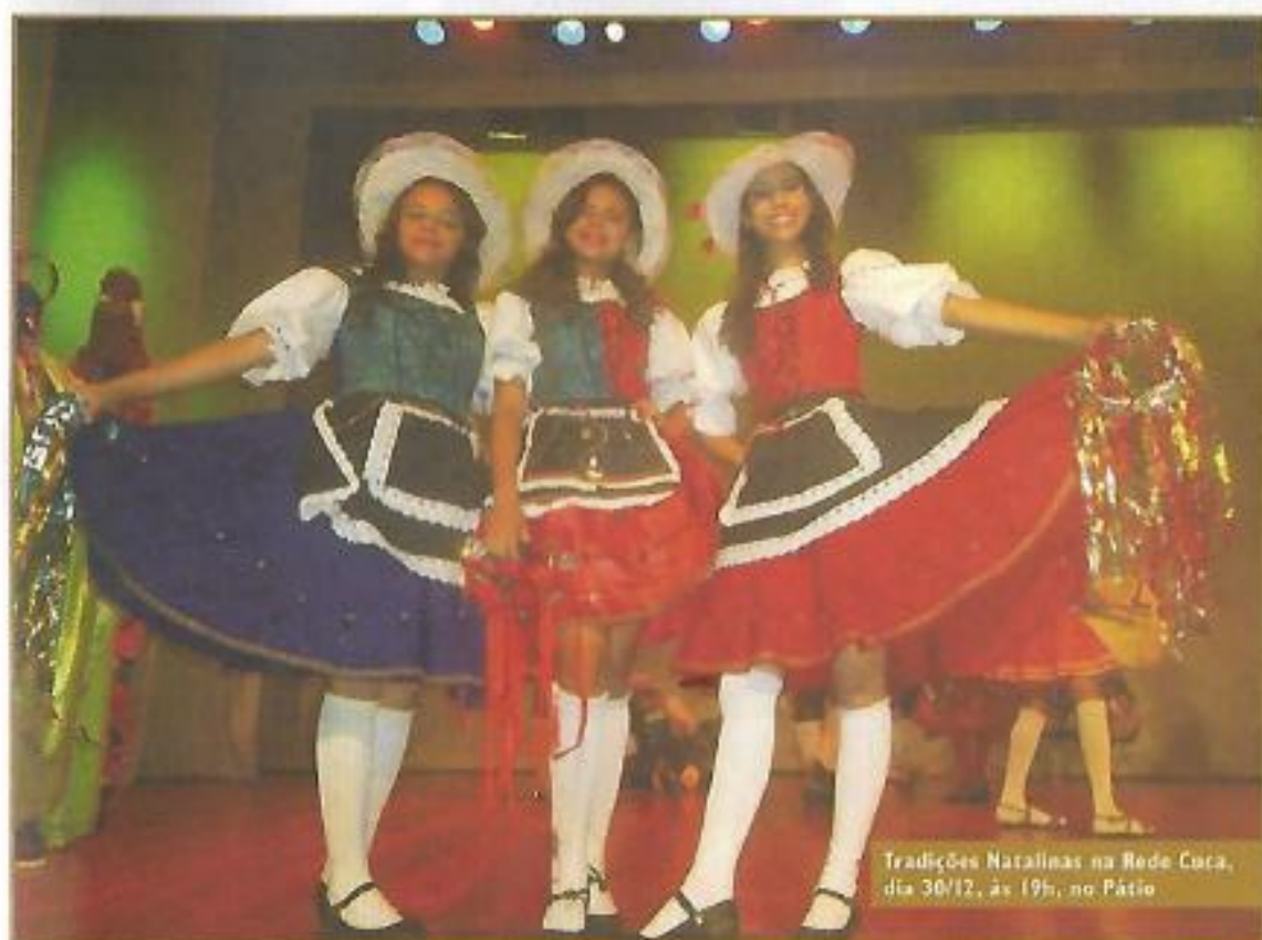
Tradições Natalinas na Rede Cuca, dia 30/12, às 19h, no Pátio