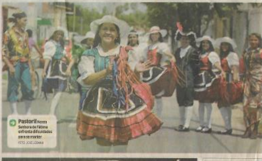
Pastoril Nessas Senhoras de Fátima enfrenta dificuldades para se manter

A questão, determina, é o efeito da globalização na nossa sociedade. "A invasão de outras culturas contribuiu para a perda de nossas referências culturais mais tradicionais", afirma. Para sobreviver, exemplifica ele, o folclore teve que mudar. Ele já não tem mais o mesmo ritmo de antigamente com sanfona, triângulo e zabumba. "A quadrilha, assim é outra manifestação que se transformou para se manter viva, com vestimenta estilizada, rica e muita coreografia. Quem não for pelo mesmo caminho, vai se extinguir", afirma ele.