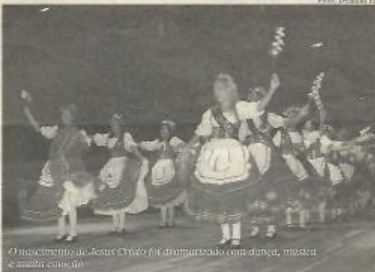
O nascimento de Jesus Cristo foi comemorado com dança, música e muita emoção.

O "Pastoril Nossa Senhora de Fátima" é tri-campeão da "Mostra Natalina de Folgoedos Populares" da região metropolitana de Fortaleza. Este ano, o movimento foi agraciado com uma verba de R$ 15.642,10 mil, pela Secretaria de Cultura do Estado (Secult), através do 3º Edital de Incentivo às Artes do Estado do Ceará. O recurso foi investido em figurinos, adereços e oficinas.