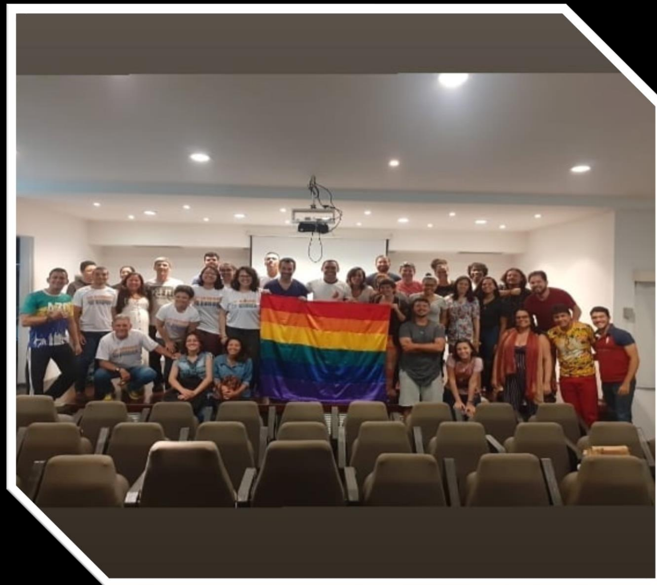
Coletivo AZC Diversidade - 2019

Círculo da Paz (inspirados no Círculo de Cultura de Paulo Freire - realizados ao final da roda de capoeira com discussão de assuntos pertinentes a construção e viabilização de uma Cultura de Paz).