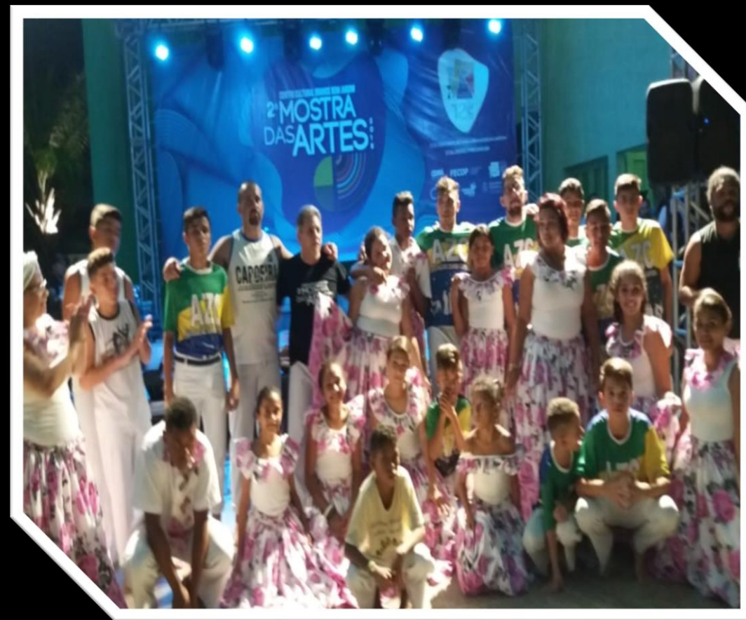
Apresentação de capoeira e samba de roda na 2ª Mostra das Artes CCBJ - 2019

EDUCAÇÃO E PESQUISA: formação continuada em educação para a paz e produção de pesquisas sobre a capoeira e as danças afroreferenciadas (jongo, coco, samba, tambor de crioula).