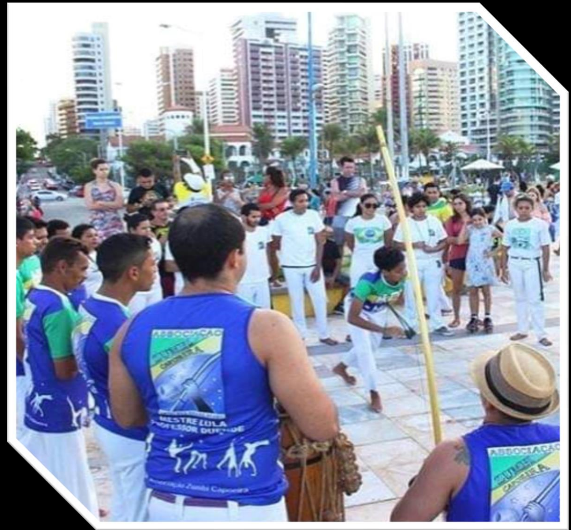
Apresentação de Capoeira: Calçadão da Praia de Iracema - 2019

A instituição funciona como núcleo de formação humana continuada centrada na arte e cultura como elemento de transformação e desenvolvimento humano.