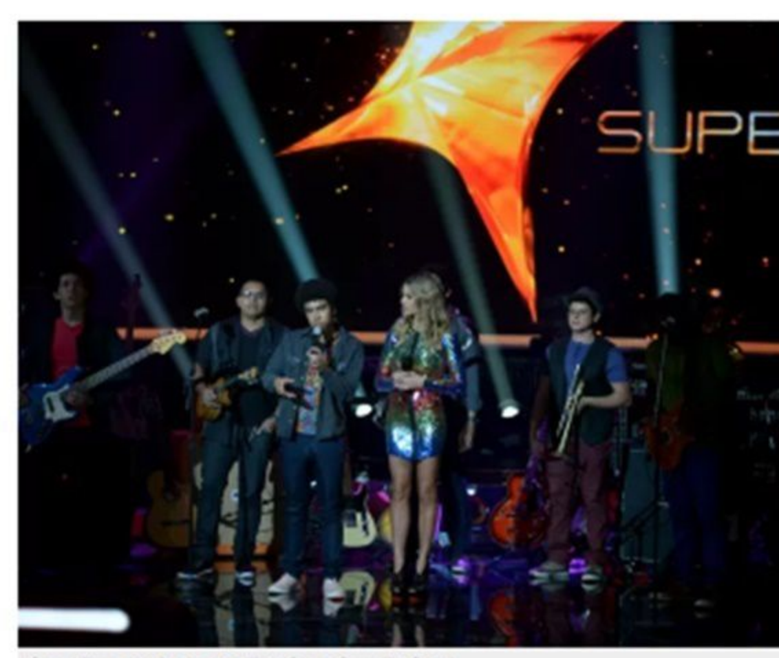
Groovy Town não vê telão subir

Mesclando as músicas "Take It Easy My Brother Charles" e "Bebete Váborã", de Jorge Ben Jor, a banda Groovy Town abre a terceira noite de Audições do SuperStar. Ivete Sangalo dá "Sim" para a apresentação e contribui com 7%, enquanto Dinho Ouro Preto vota "Não". Na pontuação final, a banda chega a 63% e não consegue fazer o telão subir. "É só vocês procurarem a gente, que a gente acha vocês", declara o vocalista para os jurados.