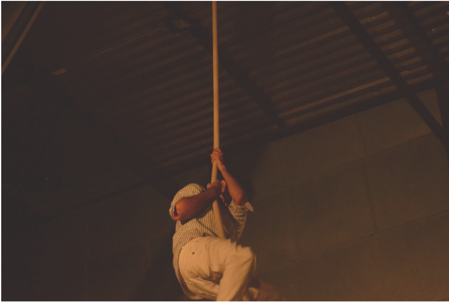
ANDAIME, mostra coletiva de alunos do Colaboratório em Artes Circenses.

p r o c e s s o s / á r e a d e a t u a ç ã o