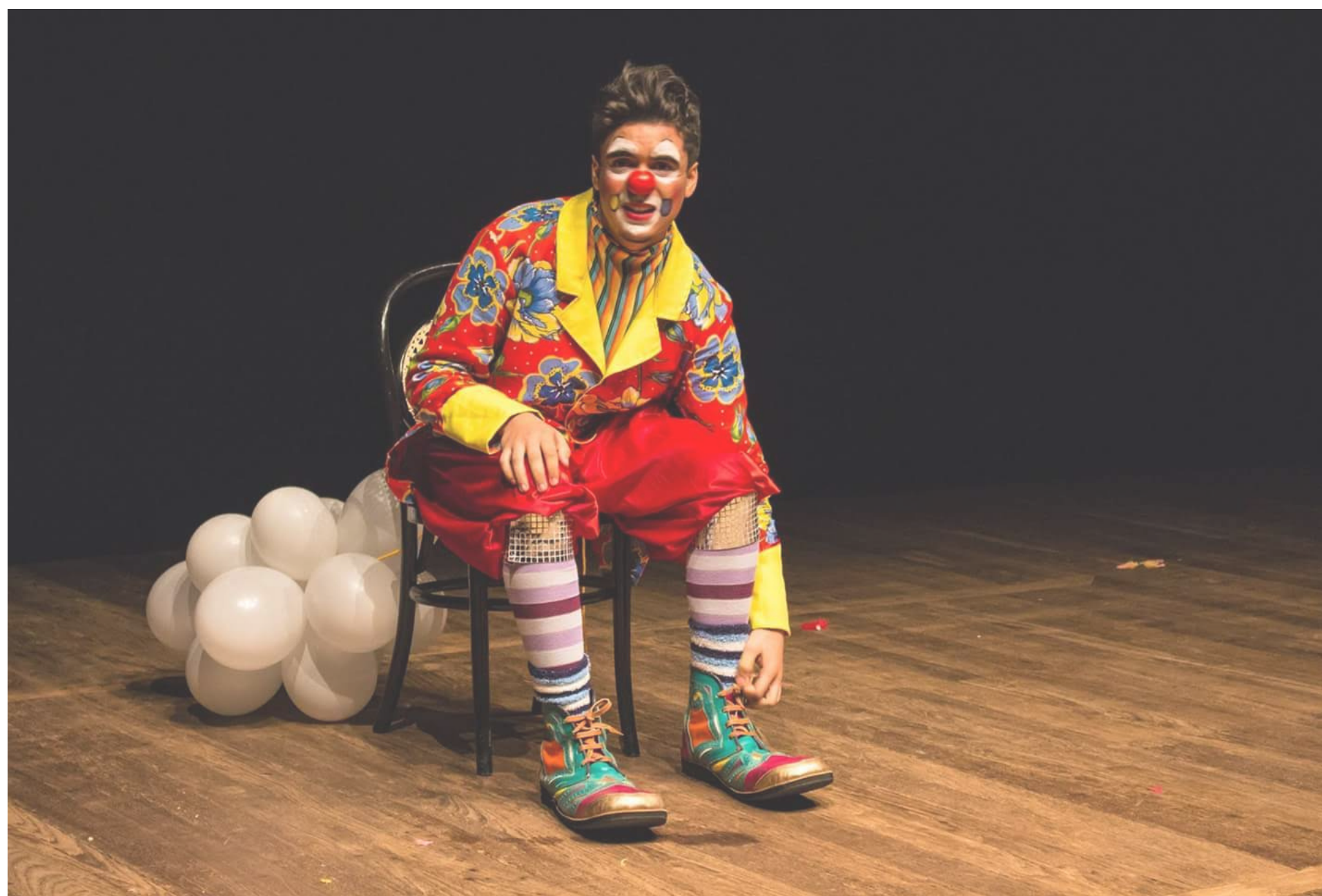
“Feliz aniversário”, Academia do Riso.