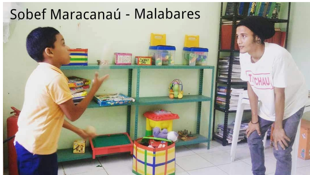
Sobef Maracanaú - Malabares