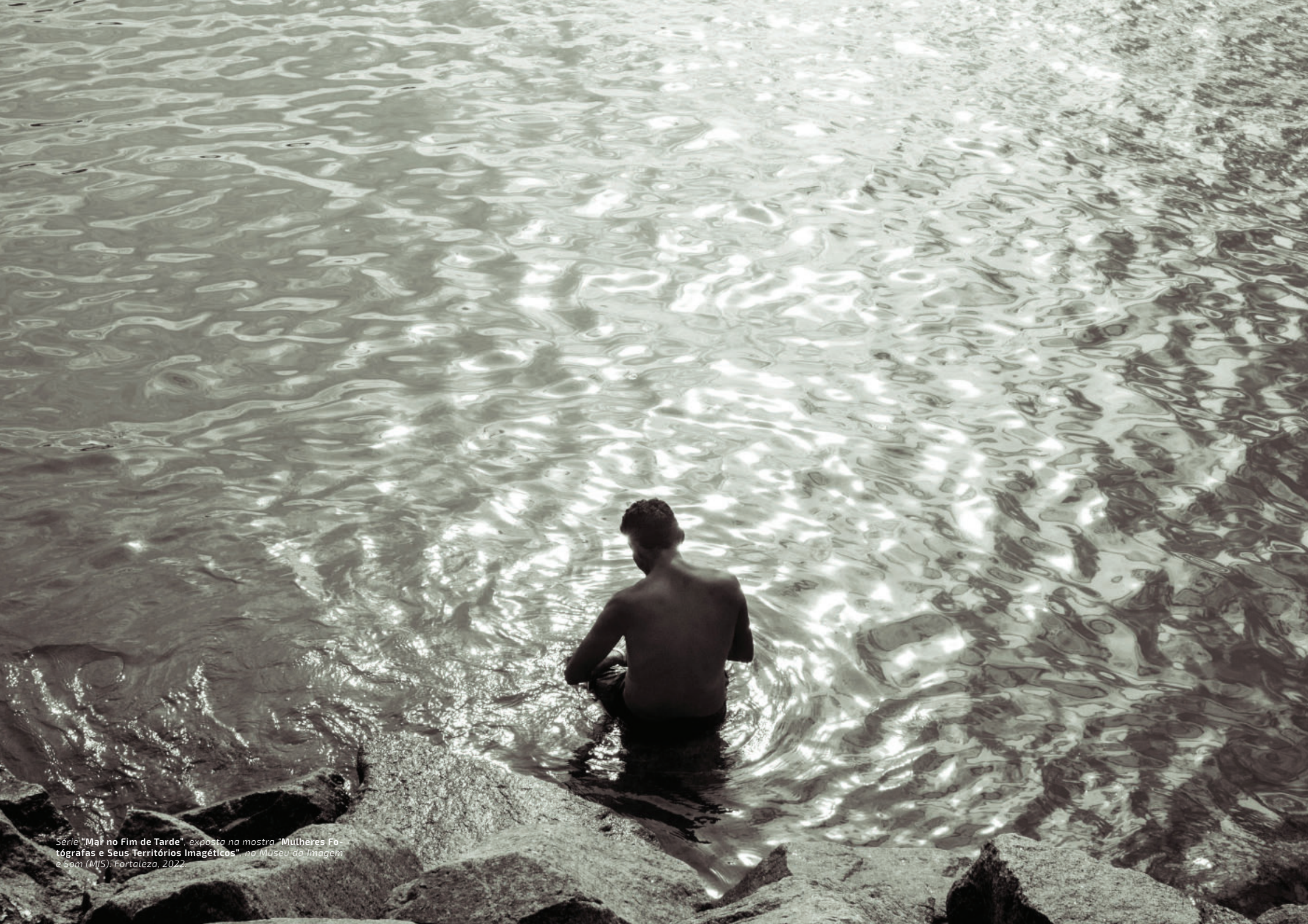
Série "Mar no Fim de Tarde", exposta na mostra "Mulheres Fotógrafas e Seus Territórios Imagéticos", no Museu da Imagem e Som (MIS), Fortaleza, 2022.