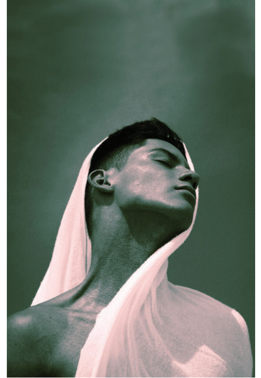
Ensaio editorial "VENDAVAL". Fortaleza, 2020.

Fotografias contempladas como "Melhor Série Fotográfica", pelo 19º Festival Noia. Fortaleza, 2020.