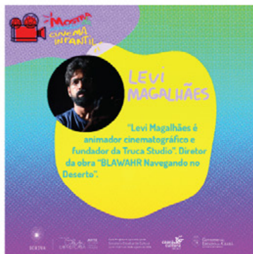
Layouts e logo-marca criados para o projeto "Mostra MICI". Arte visual: Fernando Barros.