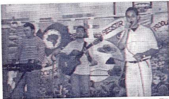
Die Brasilianische Musikgruppe „Alegra Brasil“ zu Gast in der Gesamtschule Neustadt Neustädter Schüler zum ersten Mal seit zwanzig Jahren gemeinsam in der Turnhalle

Impressum: Druck und Verlag: Henrich-Druck Inh.: Herbert Henrich Gartenstraße 16 35279 Neustadt (Hessen) Postfach 1108 35275 Neustadt (Hessen) Telefon (06692) 63-25 Telefax (06692) 54-88 Erscheinungsdatum: Einmal in der Woche donnerstags Bezugspreis: Monatl. 2,80 DM einschl. Zustellgebühr Annoncenstarif: Lokales: Montag 17.00 Uhr Anzeigen: Dienstag 12.00 Uhr