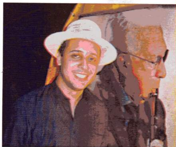
FESTIVAL MEL, CHORINHO E CACHAÇA VIÇOSA / CEARÁ