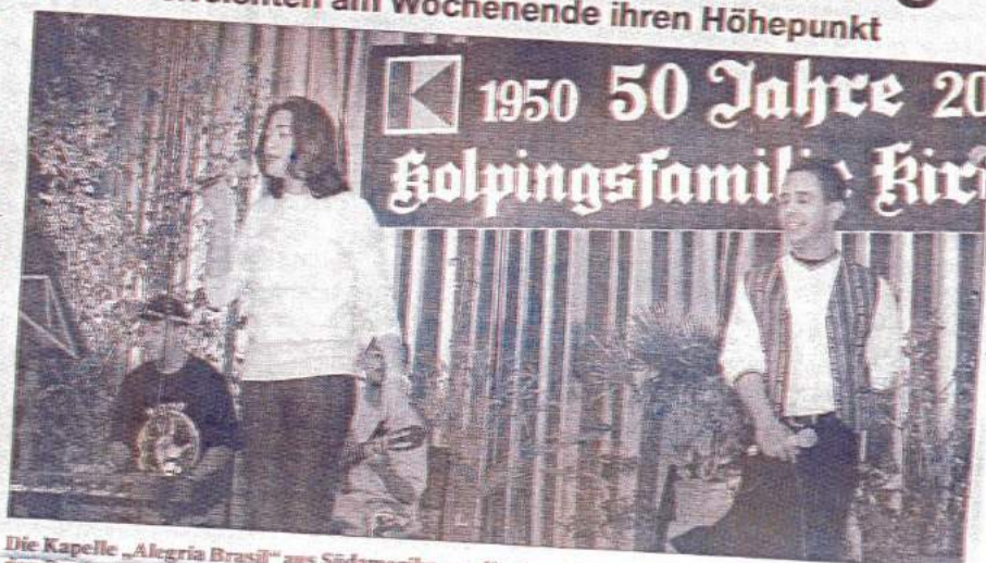
Die Kapelle „Alegria Brasil“ aus Südamerika zog die Besucher am Samstagabend mit ihrer Musik in den Bann.

Ein großer Festgottesdienst in der Pfarrkirche St. Elisabeth wurde am frühen Abend mit mehr als 400 Besuchern gefeiert. Die Messe wurde von Pfarrer Andreas Rhiel gehalten, ihm zur Seite standen am