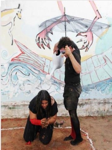
Construção e Atuação Máscara Perdoando Deus - Centro de Artes URCA/Pirajá - 2011-2012