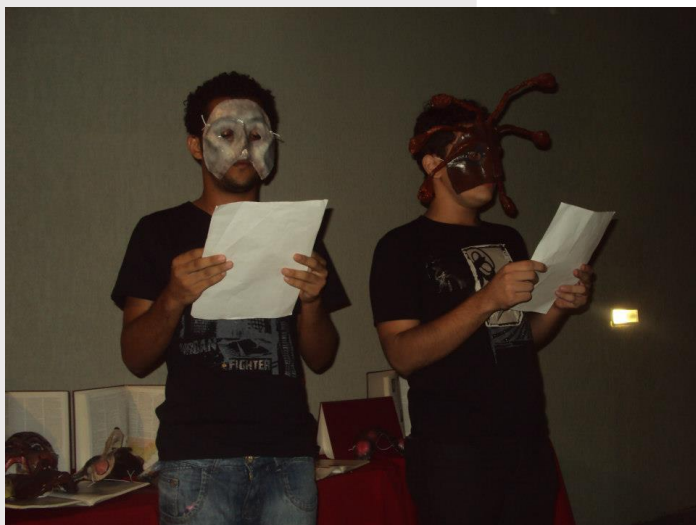
Construção de diversas Máscaras para recital poético: "Versos Livres - Diálogos possíveis" - em Galeria de Artes Ana das Carrancas/SESC-Petrolina - 2010.