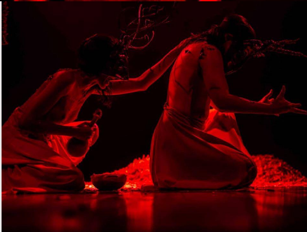
Construção da Máscara para circulação do espetáculo Obinrin de Faeina Jorge / CRATO/Cariri/CE - 2019