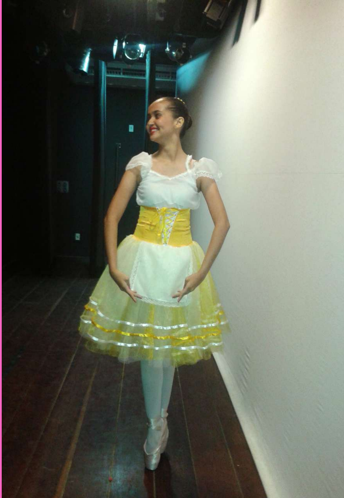
VALSA DAS FLORES, 2014