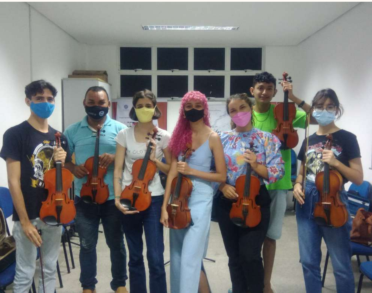
Turma de 2022.1