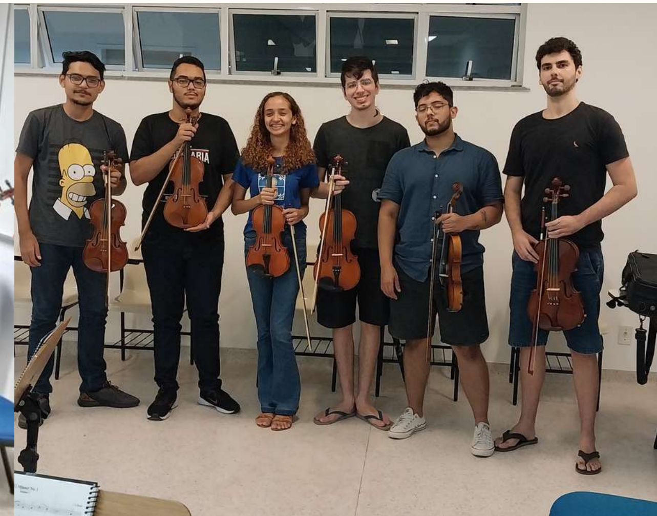
Turma de 2023.1