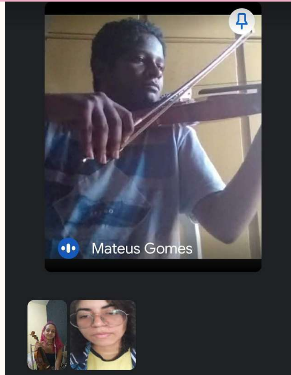
Monitorias online (2021)

Participo do Programa de Iniciação à Docência (PID) da UFC como bolsista monitora da disciplina de Cordas Friccionadas (2021/2023-atual), no qual, durante a pandemia, apresentava o programa de apreciação musical comentada “EscutaMus”. Atualmente, realizo monitorias para os alunos da disciplina.