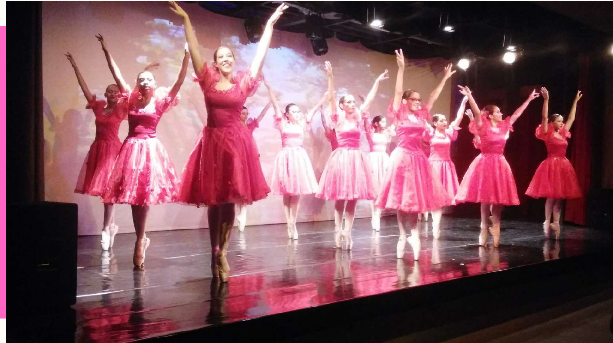
VALSA DAS HORAS, 2015