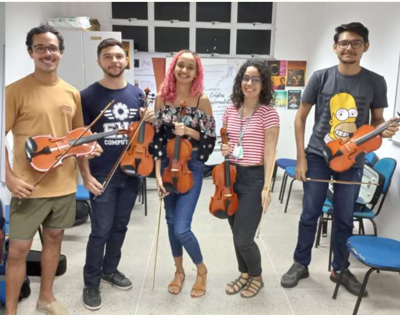
Turma de 2022.2