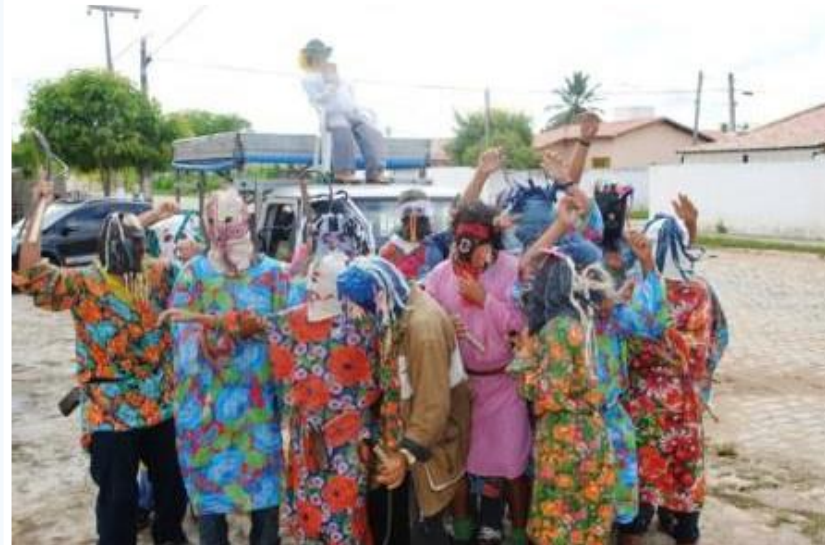
Na foto grupo dos caretas em ação de colheita de Prendas no próprio distrito de Engenheiro José Lopes.