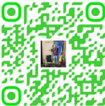
Mapa da Cultura