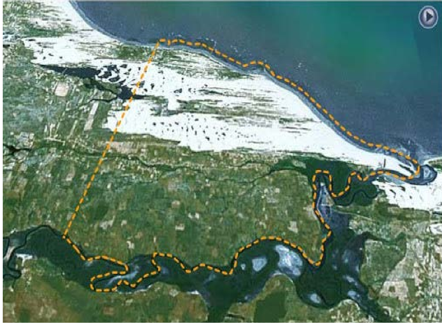
Terra Indígena do povo Tremembé da Barra do Mundaú

O Povo Tremembé da Barra do Mundaú vem enfrentando violações de direitos e situações de conflito no processo de demarcação da terra indígena. O território tradicionalmente ocupado pelos índios é objeto de disputa pelo grupo empresarial espanhol Afirma Housing Group , que tem planos para construção de um complexo turístico no local, o projeto Nova Atlântida . A empresa tem utilizado estratégias de cooptação de moradores que não se reconhecem como indígenas, estimulado a coerção e a violência física e moral contra os(as) índios(as), e tem trabalhado juridicamente e politicamente contra o reconhecimento e organização do povo indígena. Neste sentido será fundamental o reconhecimento da tradição cultural Ritual Sagrado Torém