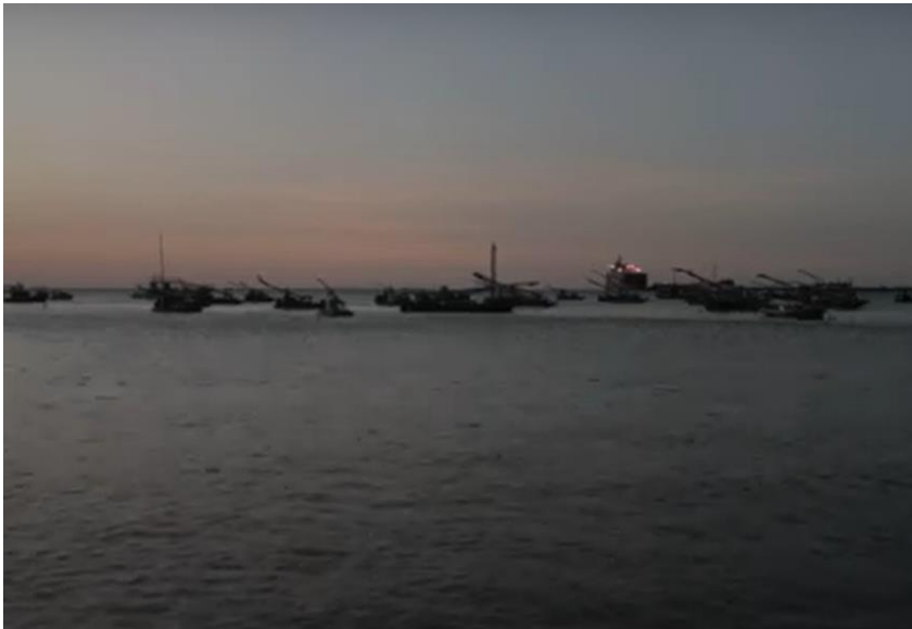
E você não está mais aqui (2022)

Link: https://www.youtube.com/watch?v=-c8SzUtVz9g