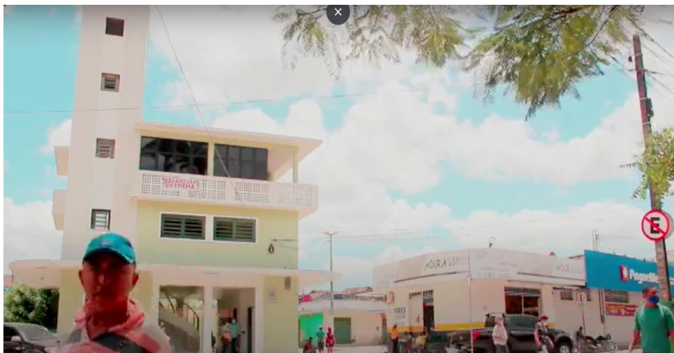
Sessão BRASIS | CineUrgente – Vinheta #4

Link: https://www.youtube.com/watch?v=IANnYvC1um4