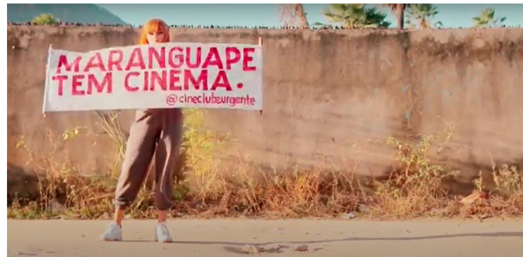
Sessão BRASIS | CineUrgente – Vinheta #5

Link: https://www.youtube.com/watch?v=IANnYvC1um4