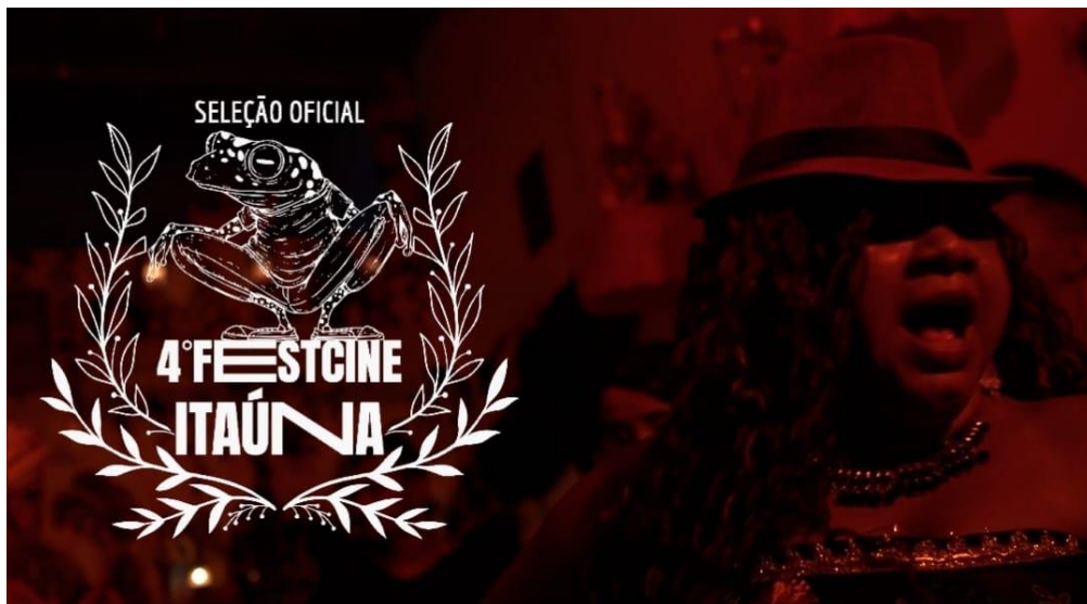
Festa de Exus | FestiCine Itaúna (2023) Mostra Xique-Xiq