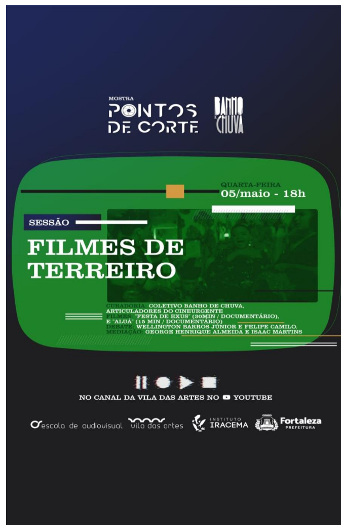
Festa de Exus | Mostra Pontos de Corte (2021)