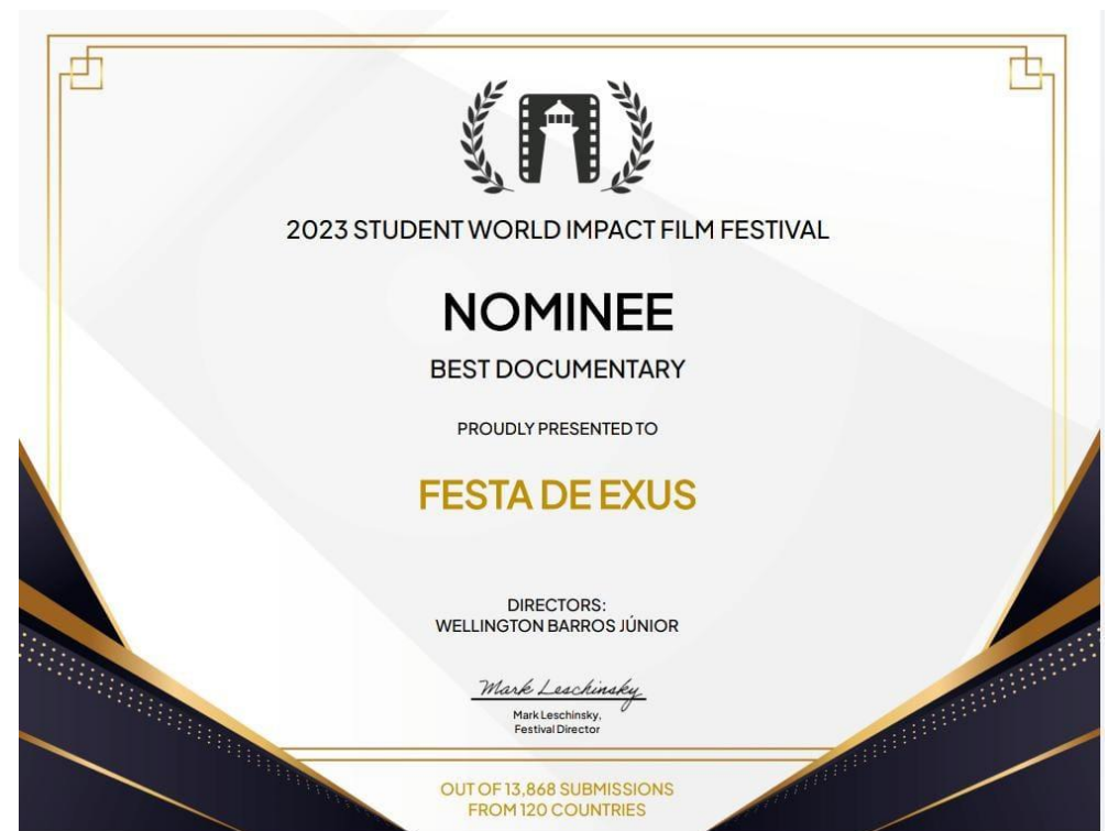
Festa de Exus | Student World Impact Film Festival (2023) Prêmio de Semi-finalista na Categoria Documentário