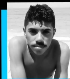
leão do gueto, 15'