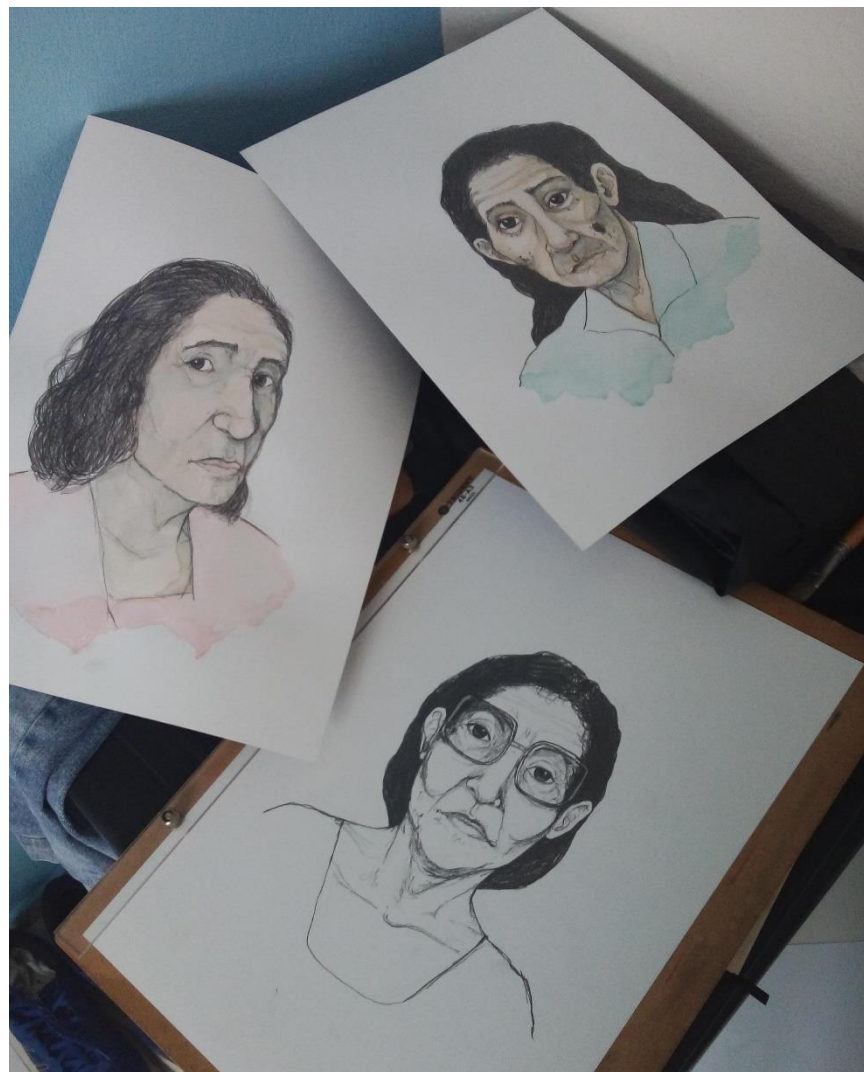
Três Maria | Prêmio Chico Anysio - Pintura (2021)