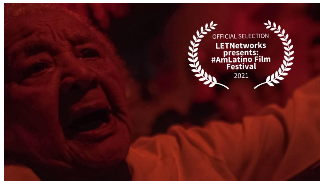
Festa de Exus | #AmLatim Film Festival - EUA (2021)