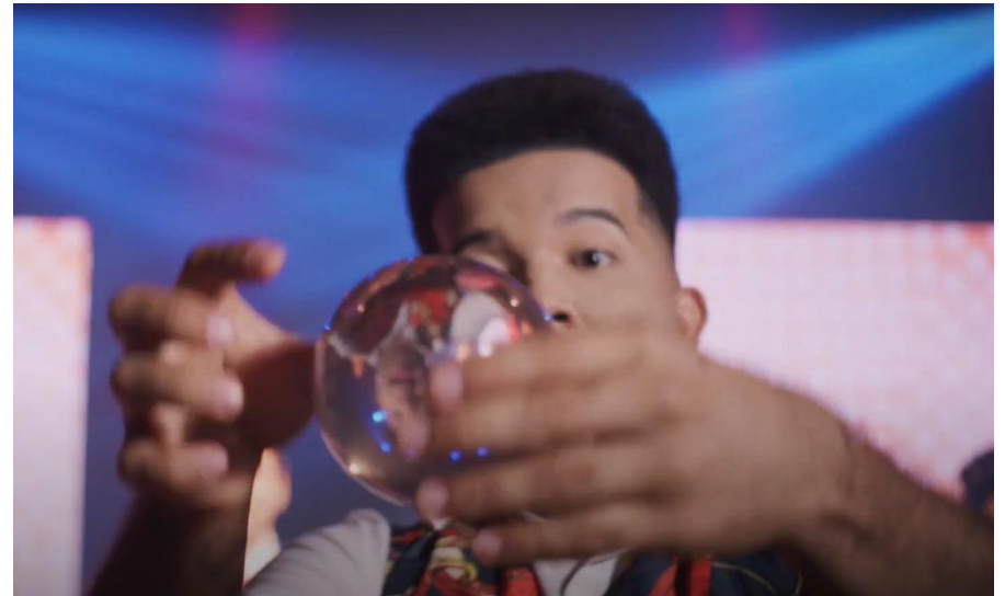
Feirão CREDISHOP (2023)

Link: https://www.youtube.com/watch?v=QETlhHxpY8