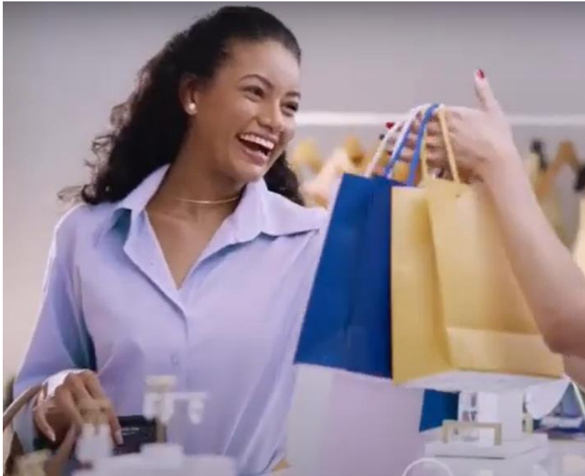
Campanha MOBILLS (2022)

Link: https://www.youtube.com/watch?v=QETlhHxpY8