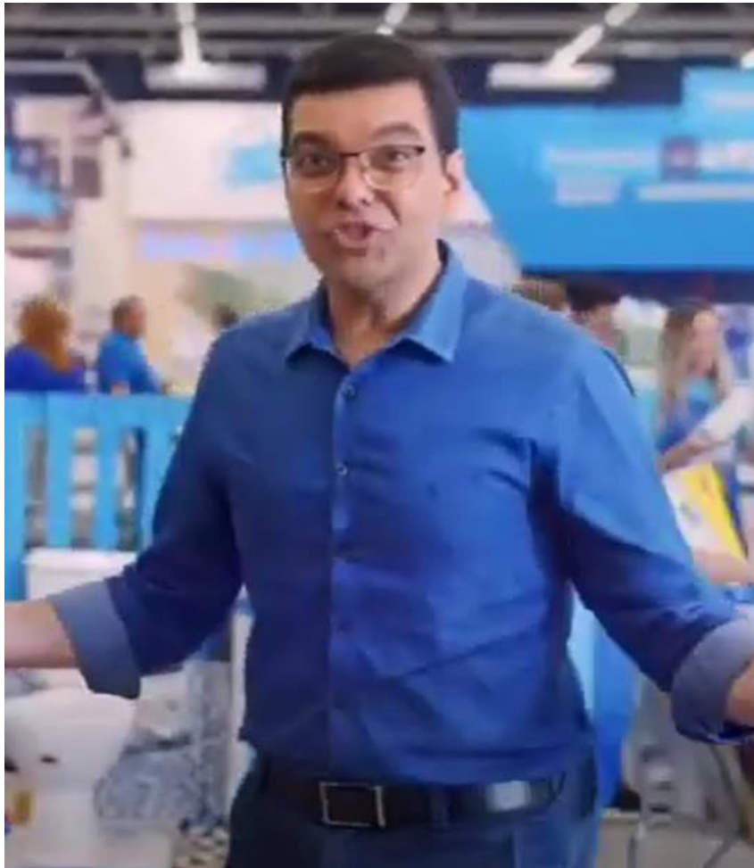
Campanha ACAL HOME CENTER(2023) Link: https://www.youtube.com/watch?v=U7zYOTGkjPg