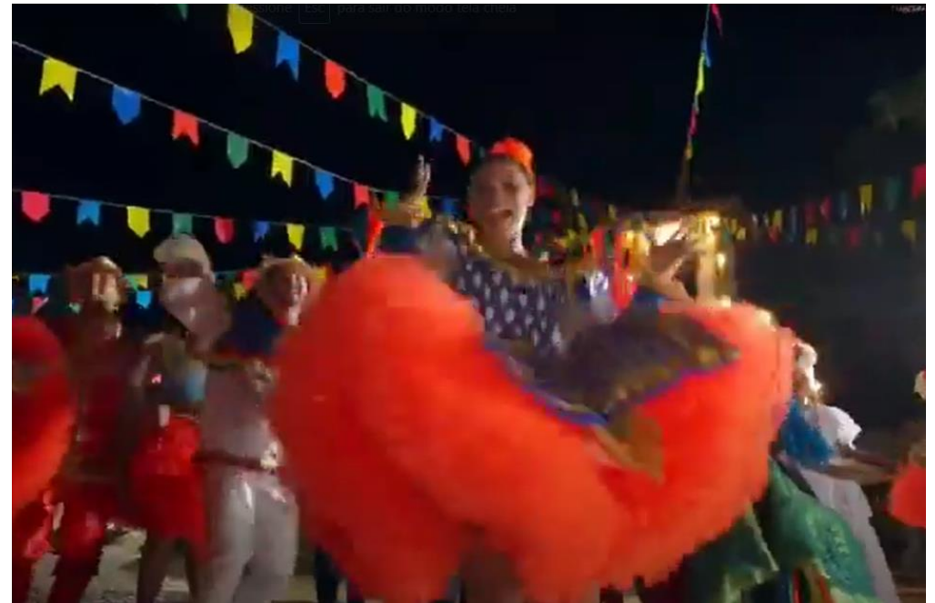
São João CREDISHOP (2023) Link: https://www.youtube.com/watch?v=EM3YHCHZ8co