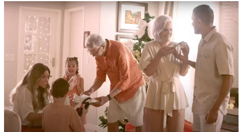
Fim de Ano NOVA (2022)

Link: https://www.youtube.com/watch?v=-c8SzUtVz9g