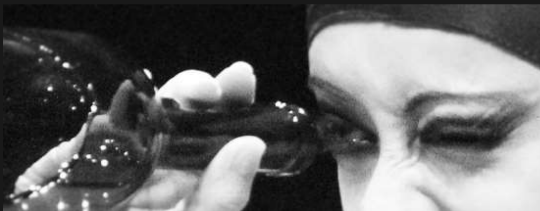
Clitemnestra , por Juliana Veras.