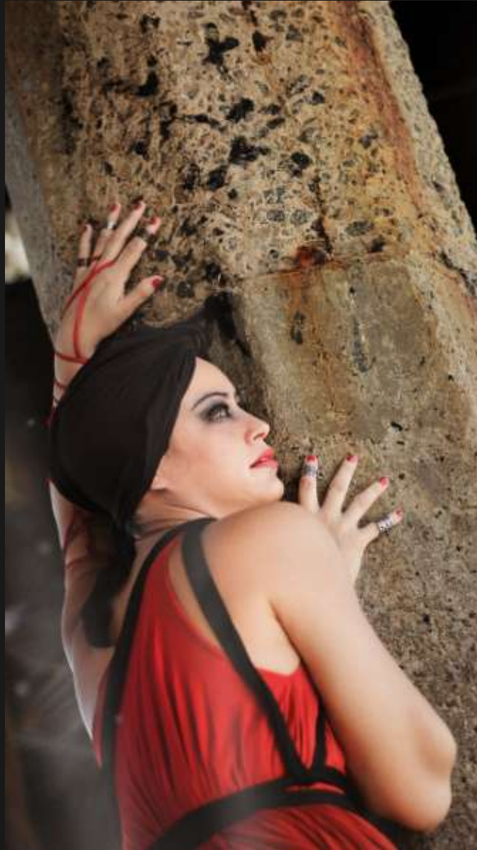
FOTO: Clitemnestra (Companhia Crisálida de Teatro), por Tim Oliveira, 2018.