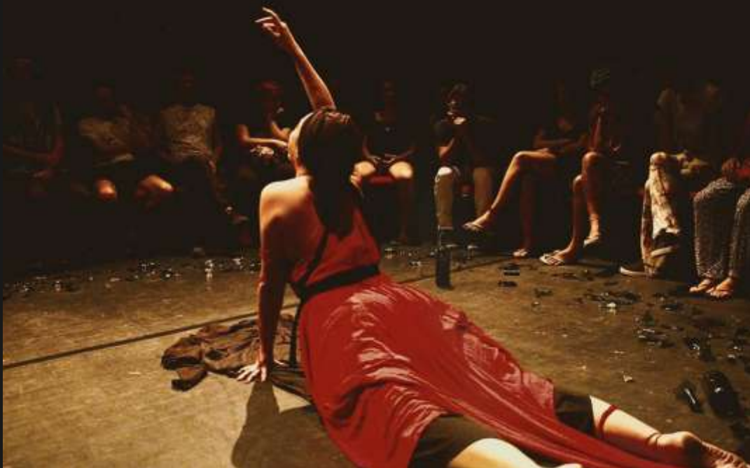
apresentação TJA Sala Sidney Souto, 23/07/2016