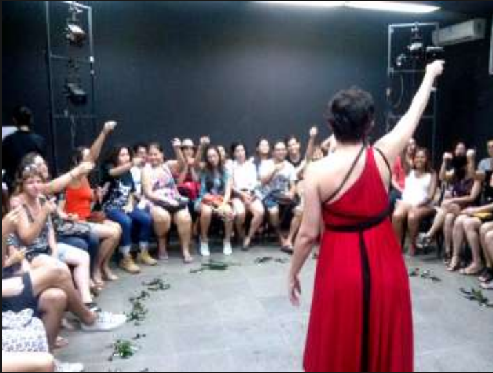
(Roda de conversa: brinde pós apresentação TJA Sala Sidney Souto, 23/07/2016)