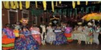
Apresentação na programação do Carnaval Meruoca 2019 Mostra "Um Baile de Carnaval"

aos orixás e mensagens de não ao preconceito de raça e religião, foi que o grupo de Maracatu Filhos de Zumbi, da comunidade de São Vicente, localizada na zona rural de Meruoca, realizou em 2019, apresentações do projeto "minha nação é nagô". O grupo realizou apresentações nos distritos de palestina, Camilos, comunidade de São Vicente e sede do mu-