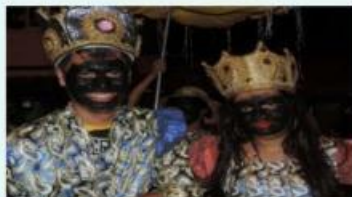
Rei e Rainha – Apresentação no distrito de Camilos, Meruoca

Atravessando décadas, os desfiles de maracatu seguem como símbolo de resistência cultural que fala das lutas do povo negro durante os dias de folia. Com muita dança, loas