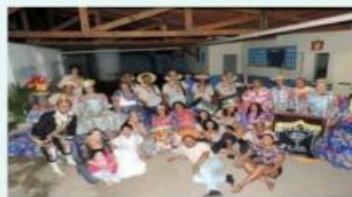
Apresentação no distrito de Palestina, Meruoca

tividade de nossas raízes negras, costumes, crenças e festividades, à questão da resistência de uma cultura que ainda teima, aos trancos e barrancos, em sobreviver diante da falta