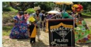
Apresentação na comunidade de São Vicente, Meruoca

de apoio e recursos, mas diante de todas as dificuldades e além de promover momentos festivos o grupo é uma importante ferramenta de atuação na formação cultural para crianças e jovens e tem relevante contribuição para manutenção das tradições da cultura local.