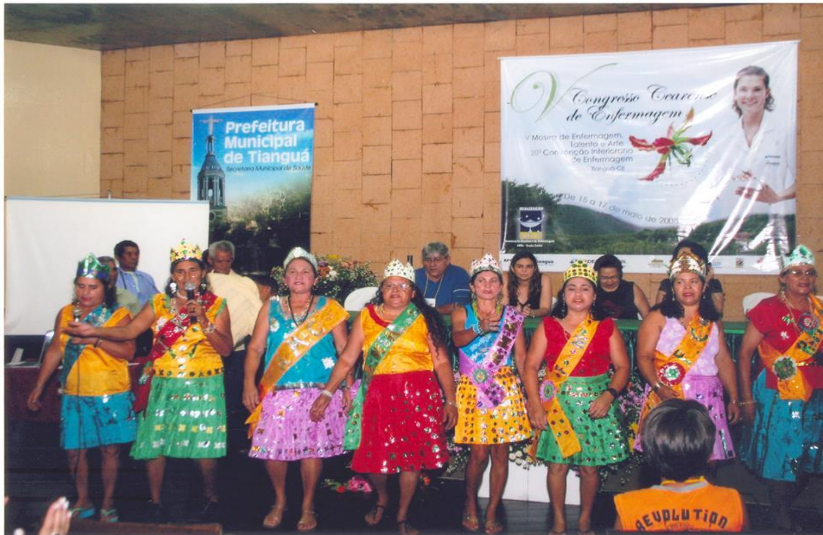
Congresso Estadual de Enfermagem Viçosa do Ceará