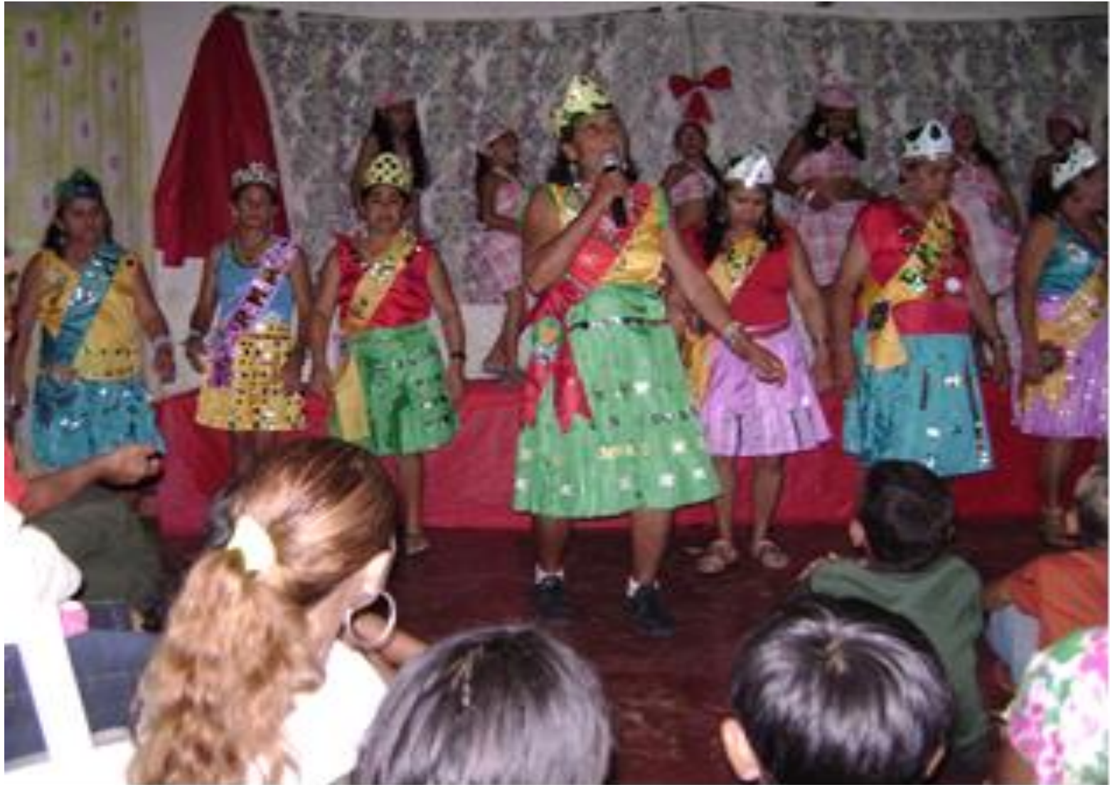
Apresentação na comunidade Tucuns - Tianguá -Ceará