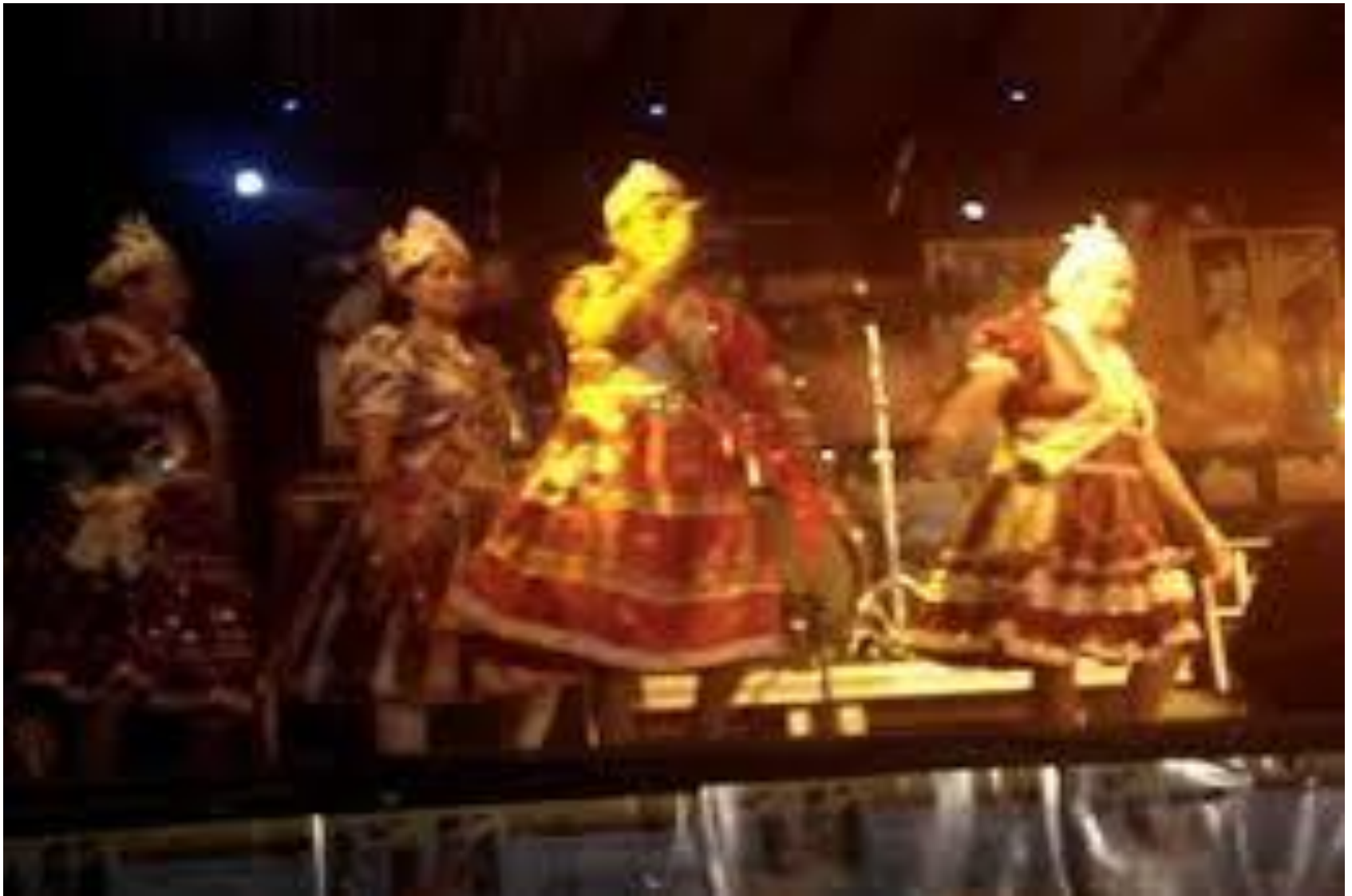
Dragão do Mar – Fortaleza-Ceará