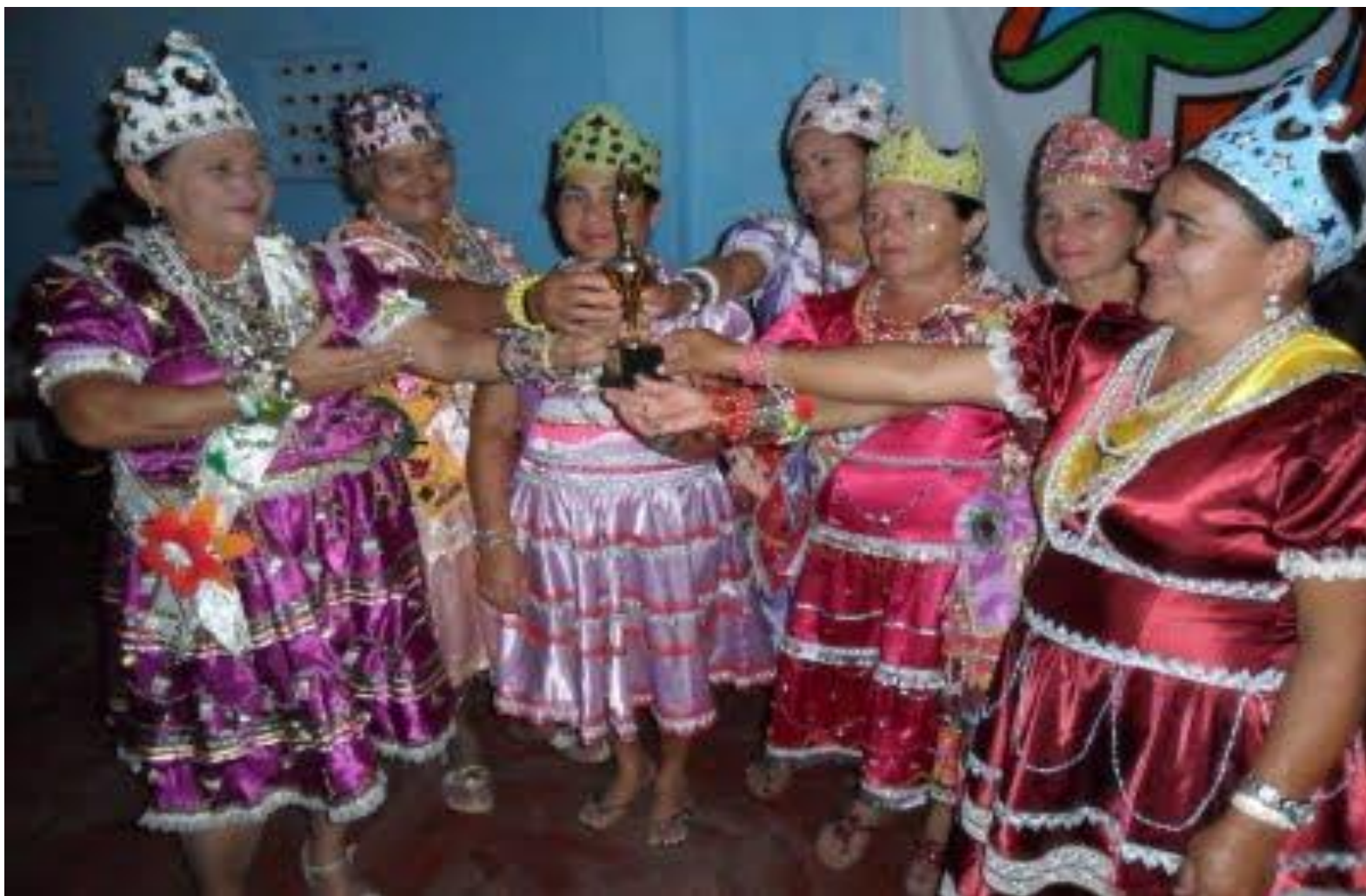
Entrega do Premio Tiaguá em Foco tianguaemfoco.blogspot.com