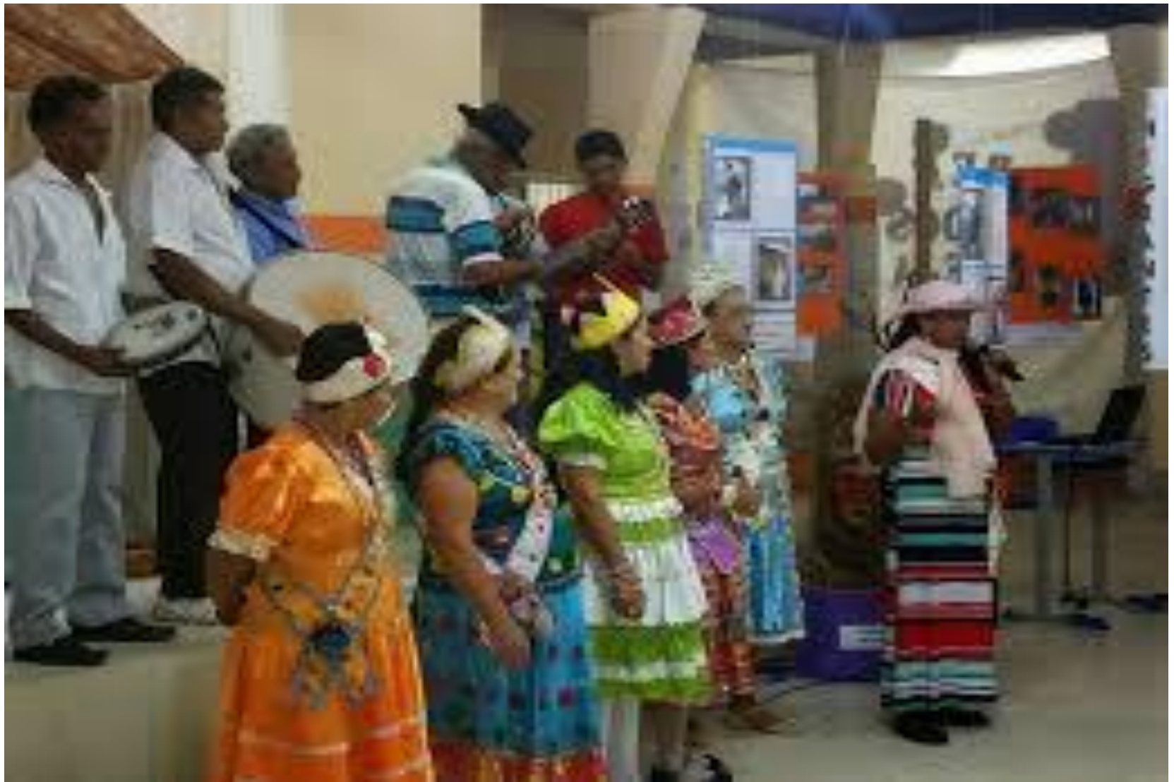
Município de Pires Ferreira -Ceará