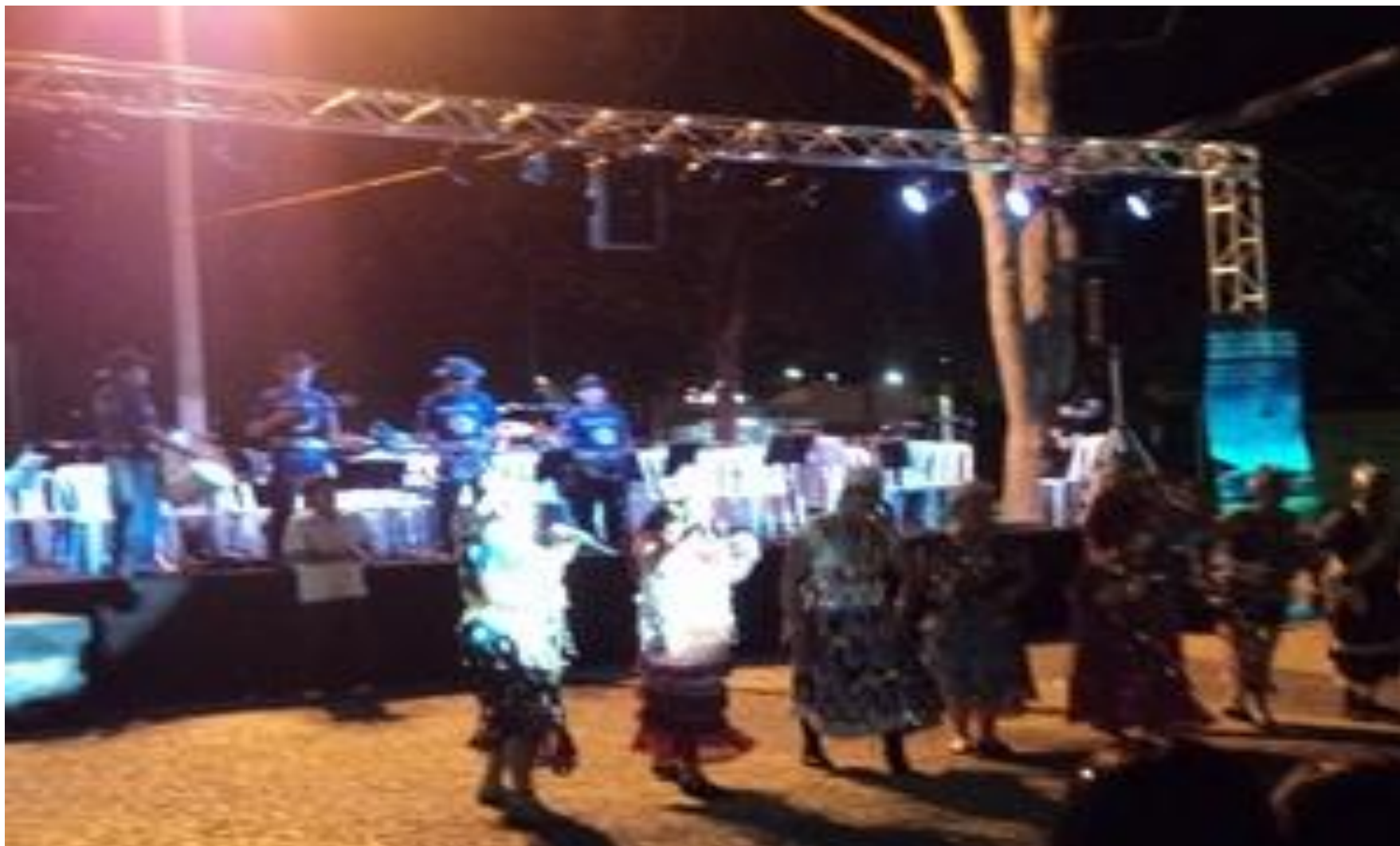
FUI - Filarmônica Estrelas da Serra e as Dramistas dos Tucuns www.correioibiapaba.com.br