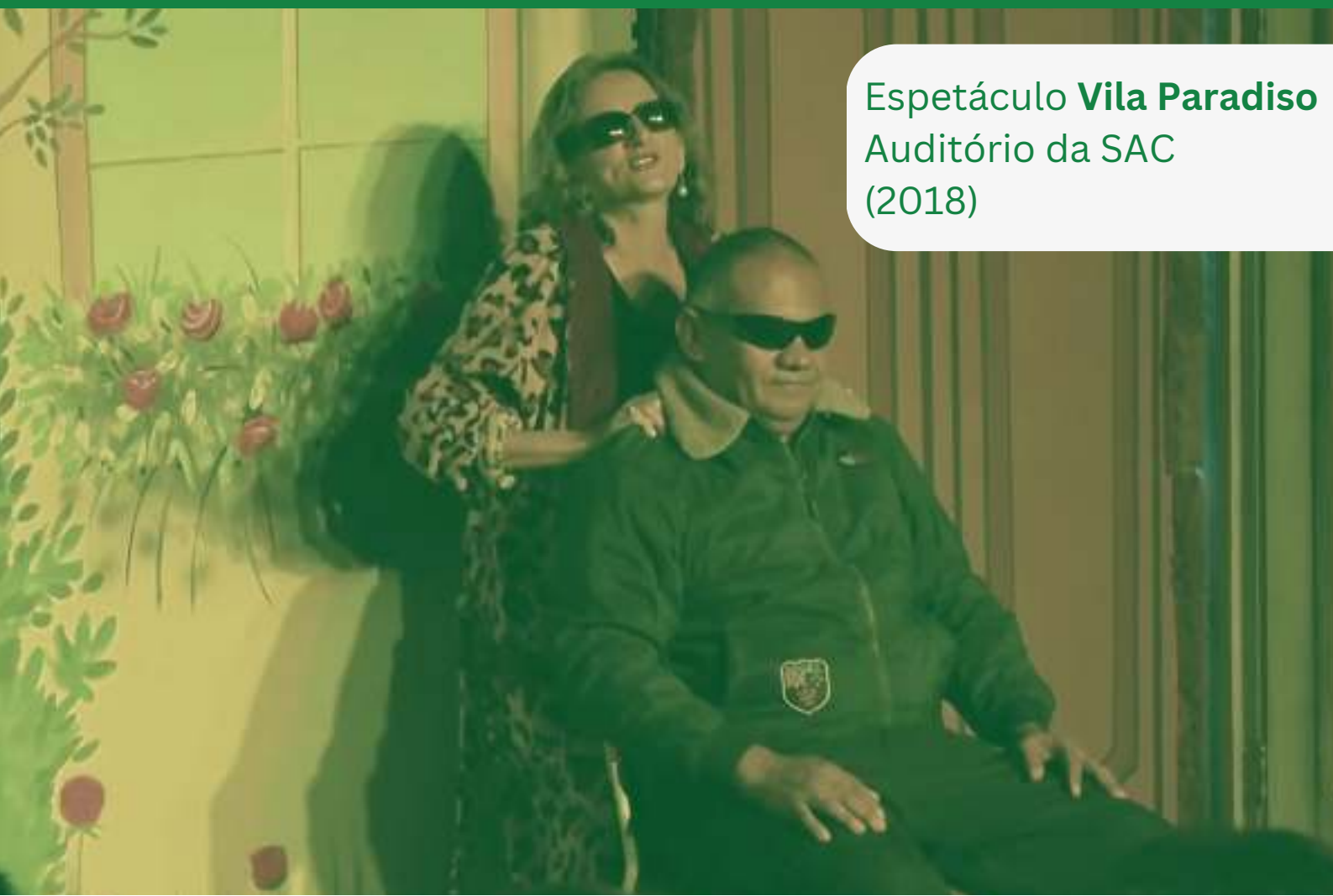
Espectáculo Vila Paradiso Auditório da SAC (2018)

O elenco é formado por 18 atores e atrizes com deficiência visual, para sua acessibilidade em cena é utilizado piso tátil (pisos para deficientes visuais com orientações direcionais e alerta).