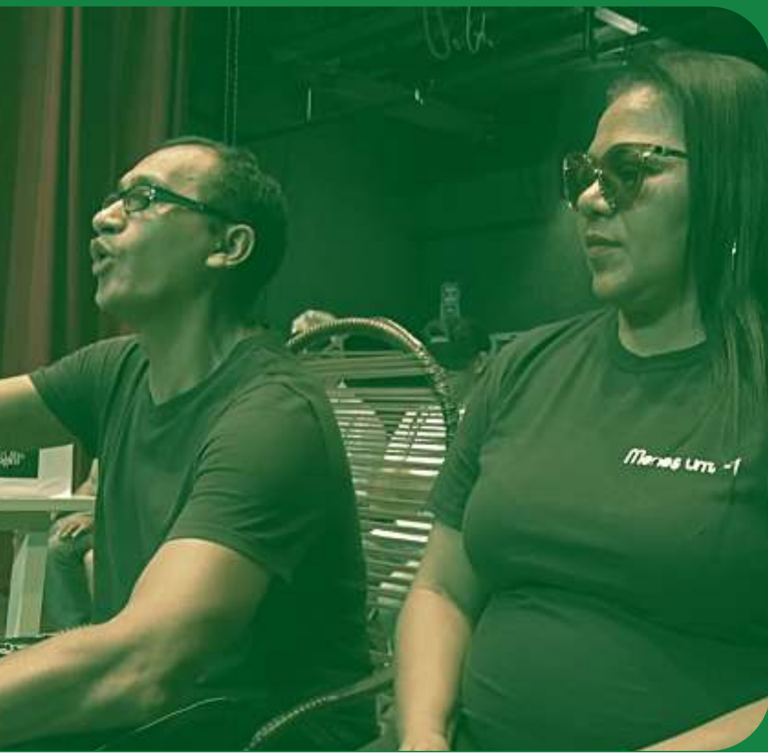
Espectáculo Menos 1, -1 Cineteatro São Luiz (2019)

Sendo assim, o objetivo da encenação é propiciar a experiência de colocar os videntes no lugar da pessoa com deficiência visual através de um processo lúdico e pedagógico.