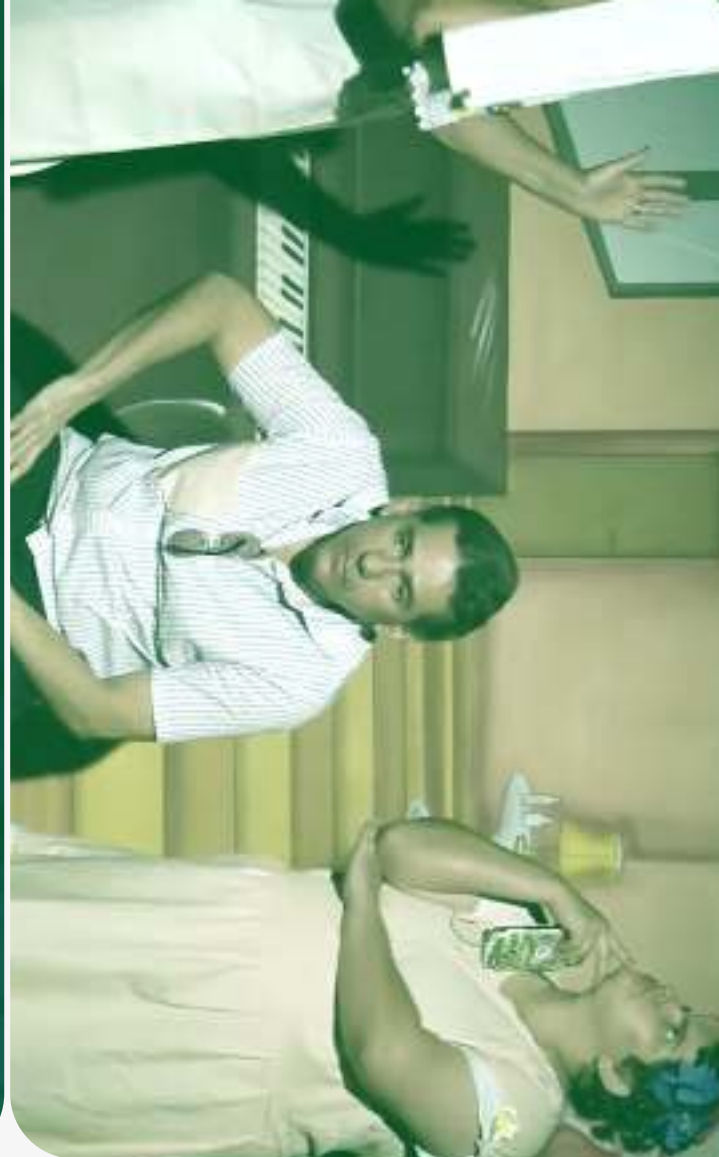
Espetáculo Vila Paradiso Auditório da SAC (2018)