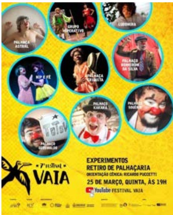
Apresentação do curta-metragem: Delírios de Astral