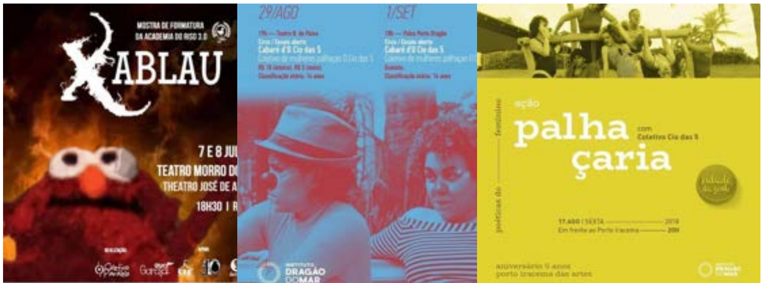
Apresentações do número A dança Proibida no Cabaré do Cio das 5