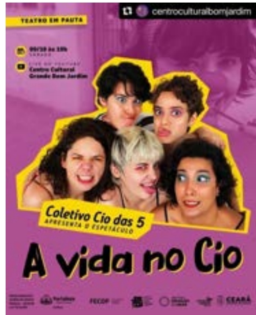
Apresentações do curta-metragem A vida no Cio