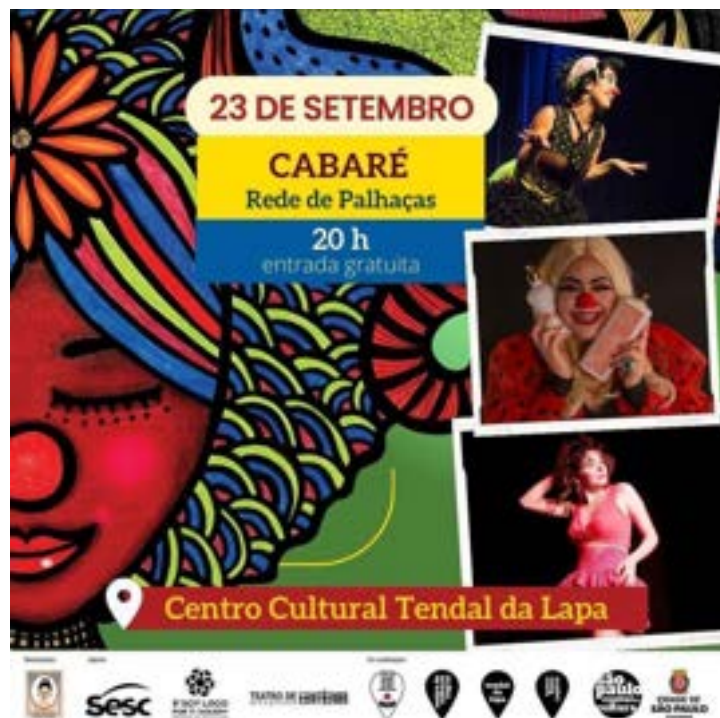
Apresentação do número A dança proibida