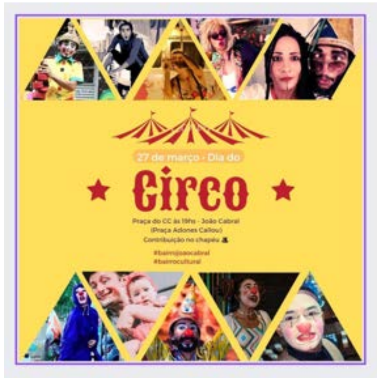
Apresentações do número A palhaça nas alturas