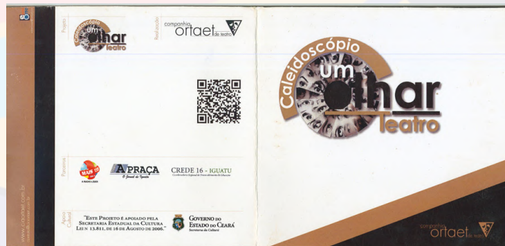
Projeto Caleidoscópio: Formação artística

PRODUÇÕES ENTRE 2010 E 2017 - IGUATU / CE