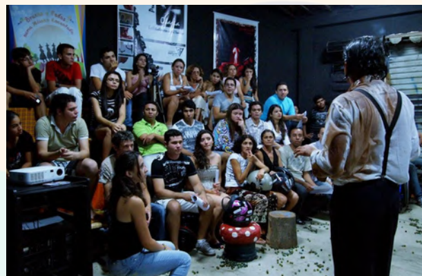
Formação de plateia Galpão de Artes