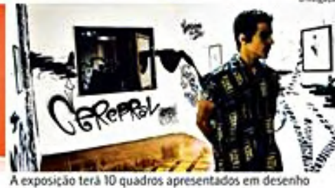
A exposição terá 10 quadros apresentados em desenho nanquim sobre papel creme