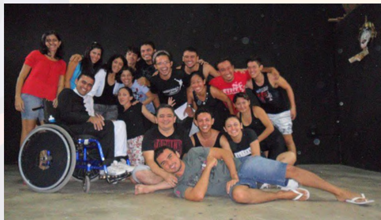
Projeto Olaria. Formação artística