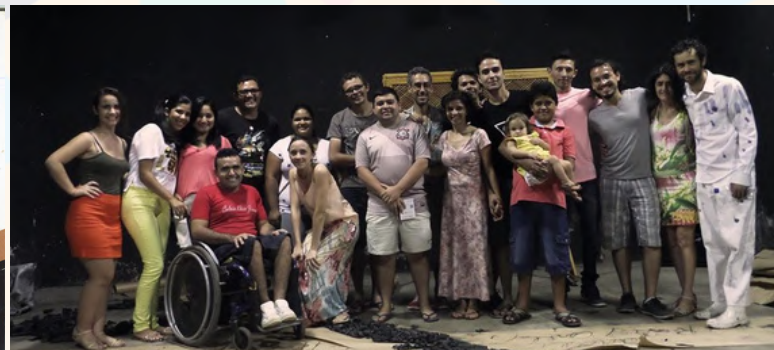
Produção: Espetáculo Ledores no breu (Cia do Tijolo)