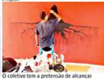
O coletivo tem a pretensão de alcançar espaços diversificados