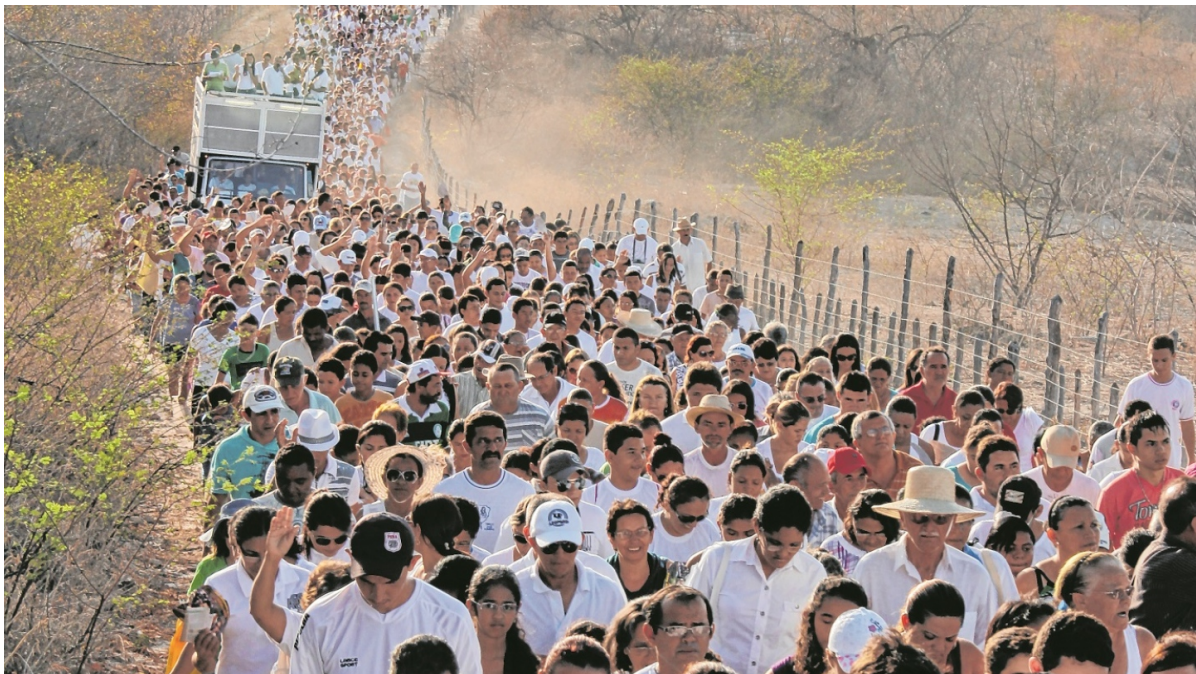
Caminhada da Seca reúne milhares de pessoas no município de Senador Pompeu

Grupos iniciaram a jornada antes da romaria que ocorre hoje (10). Um total de 31 pessoas saiu, ontem, de Piquet Carneiro em uma peregrinação prévia. Eles caminharam 27km para homenagear vítimas da seca de 1932