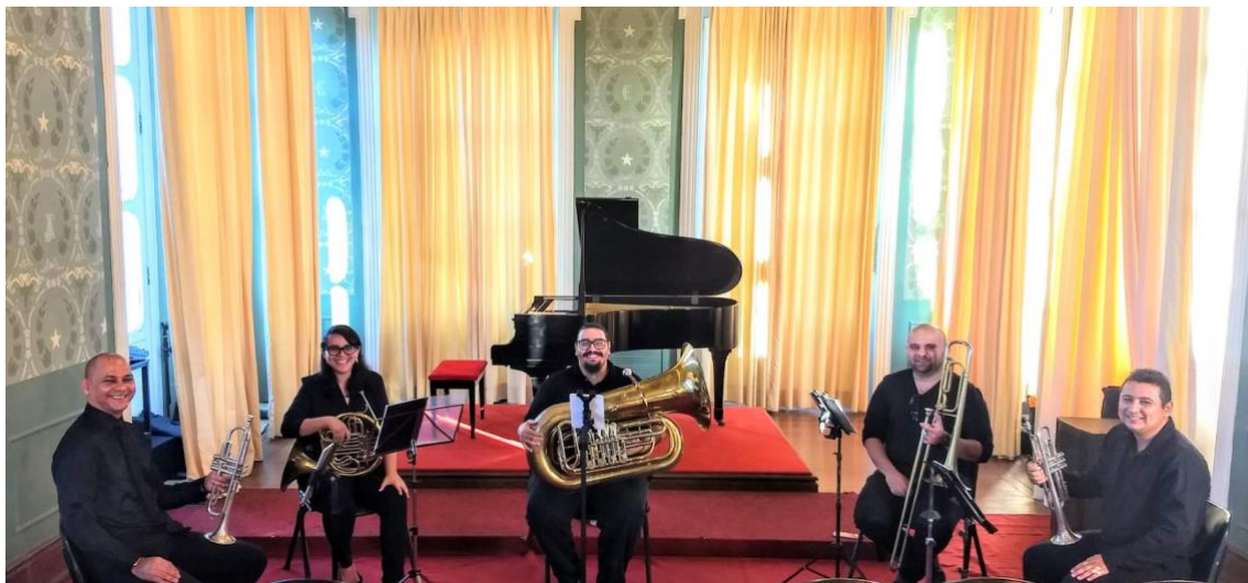
Quinteto Ceará Brass

https://www.instagram.com/tv/B5ok1ROHK6c/?igshid=w95xtnzth8g