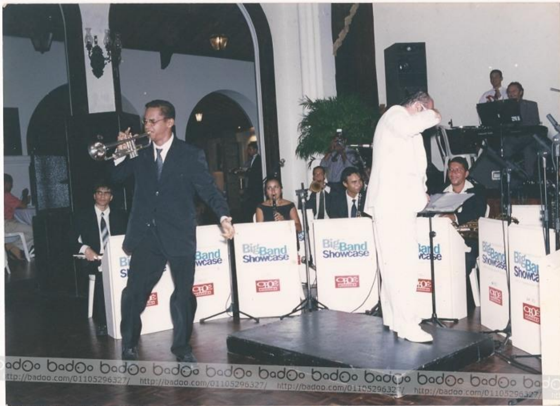
Big Band ShowCase