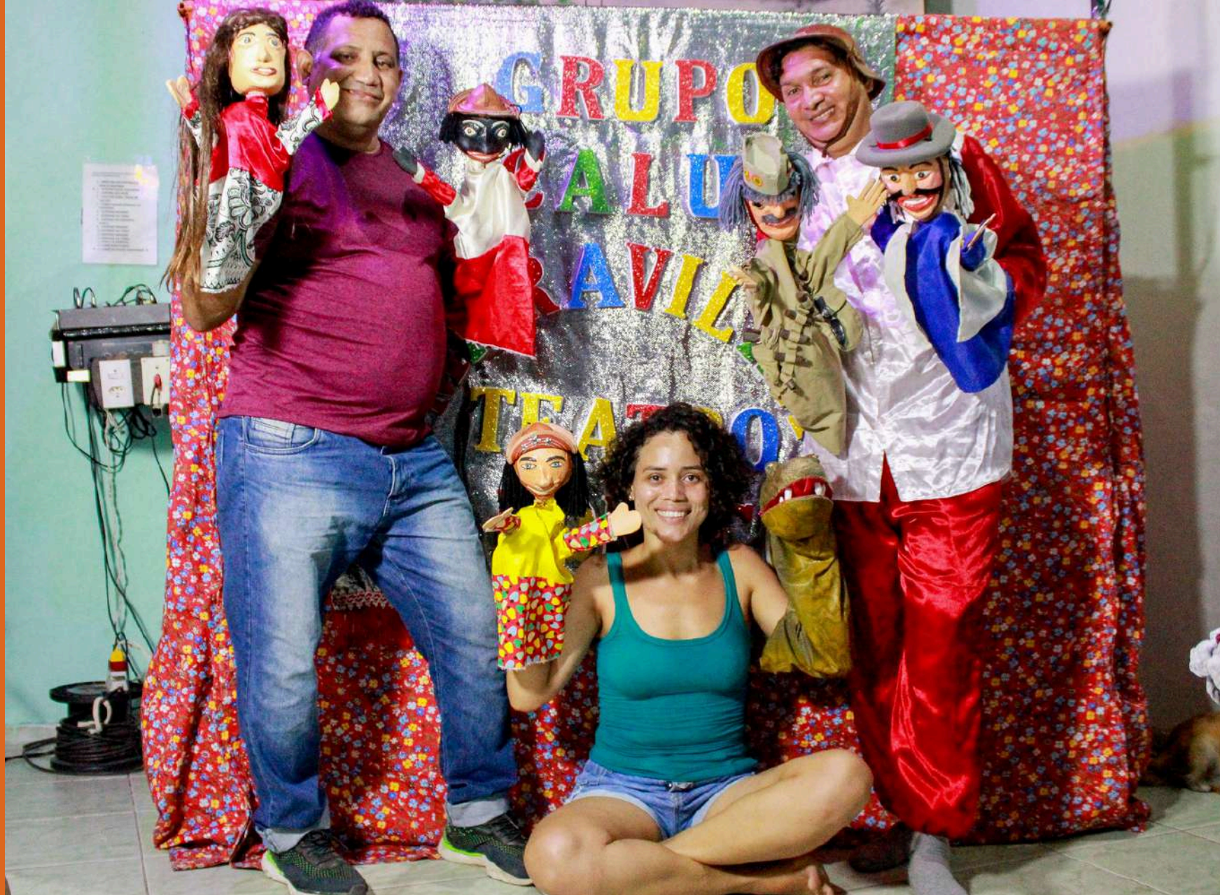
Teatro de Bonecos Calu Maravilha