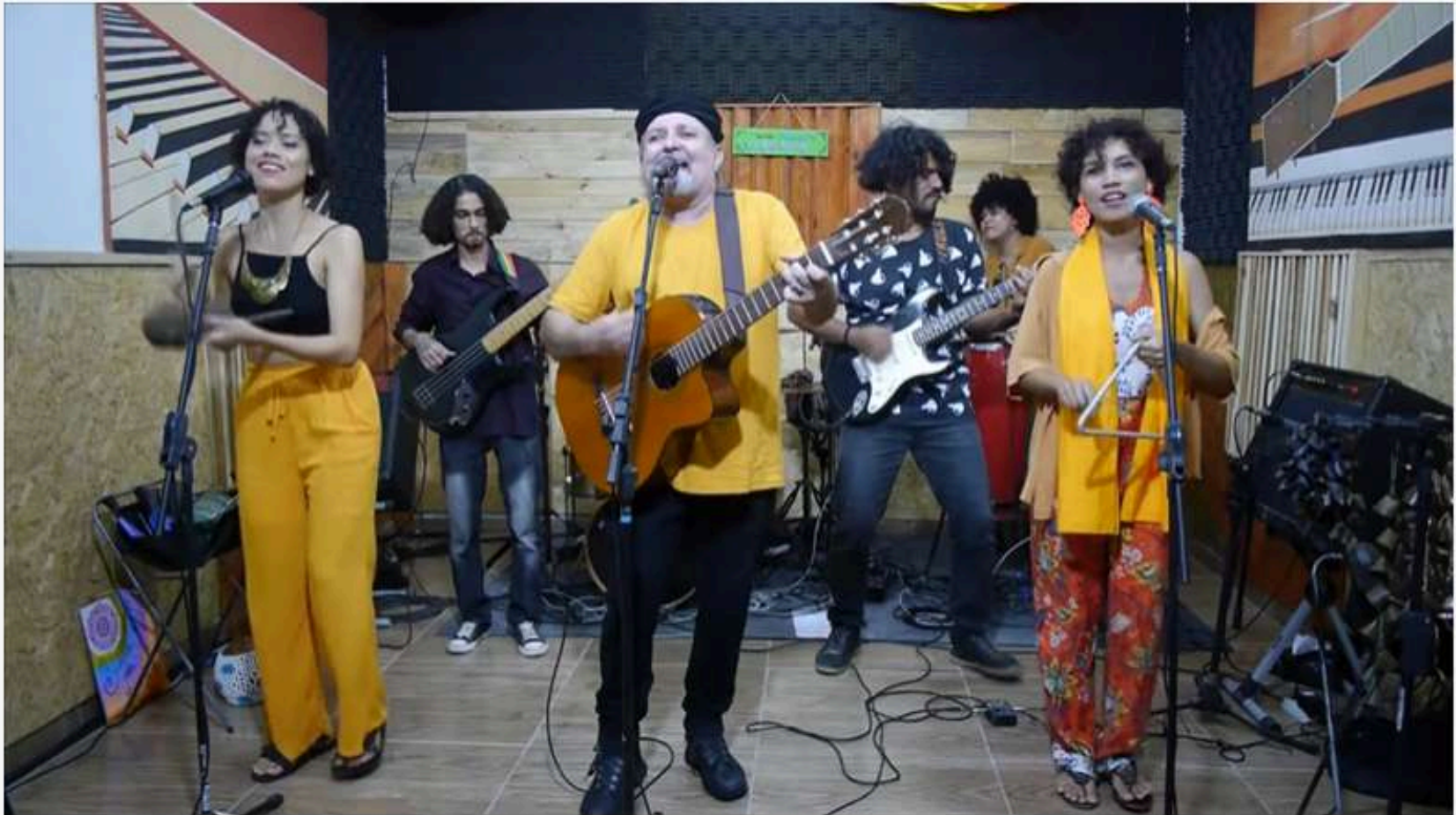
SHOW PARAHYBA E CIA BATE PALMAS