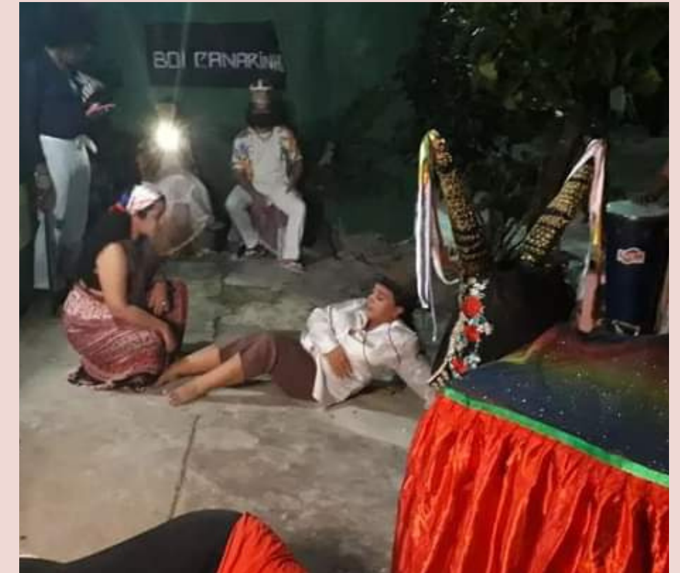
I Matança do Boi Canarinho Casa das Negas - 2022 (Brincante/Cigana)