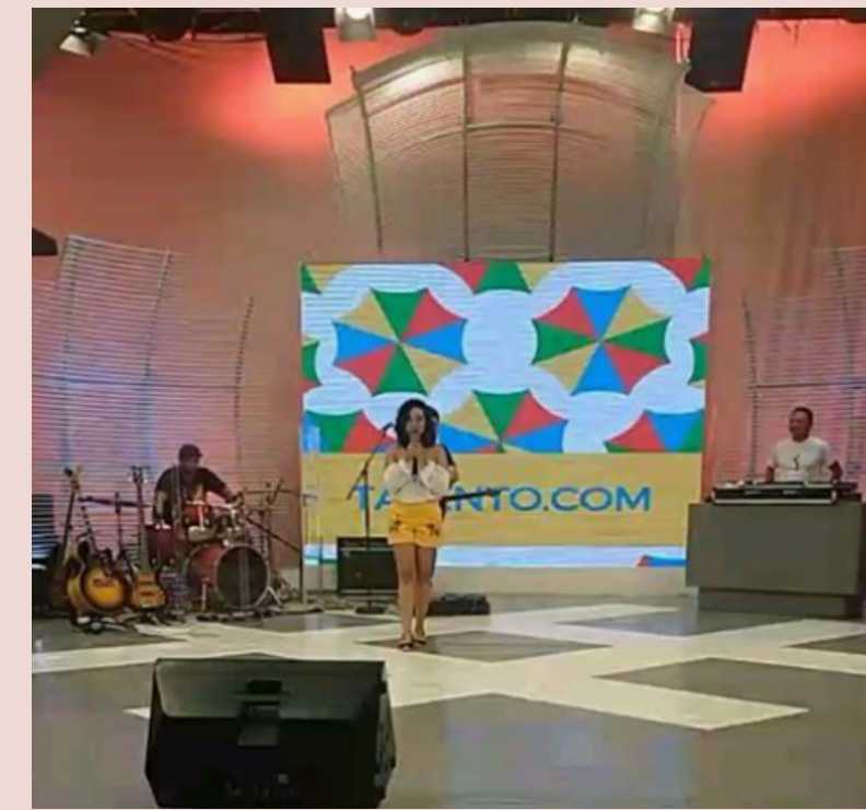
JackLima.com na TV Diário (2017)