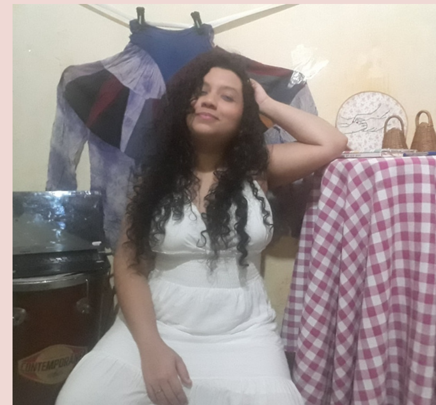
Mostra de repertório virtual A menina que fala Instagram @ameninaquefala - 2020