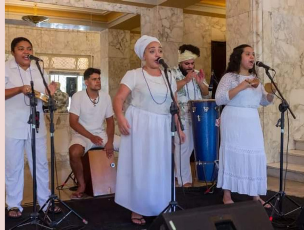
Apresentação Coco das Goiabeiras pra Rainha do Mar- Sesc em parceria com Cine Teatro São Luiz - 2022 (Voz/resposta, Caxixi)