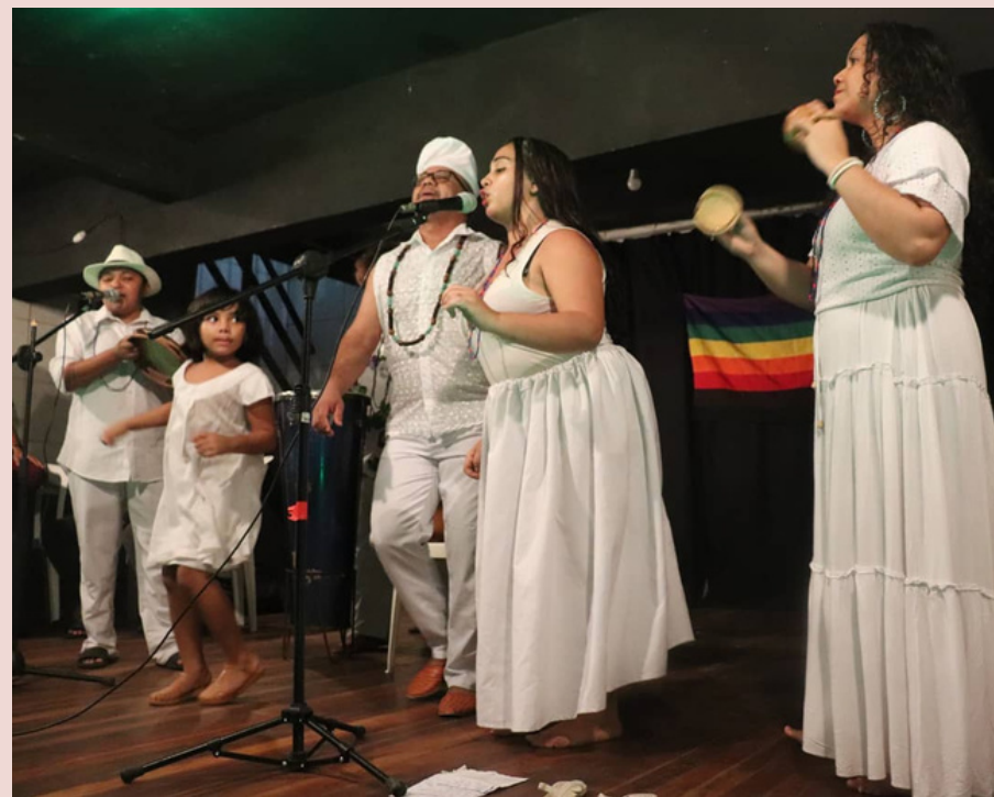
Sarau ALIUMRESISTENCIA/PIRAMBU - 2021 (Voz/resposta, Caxixi)