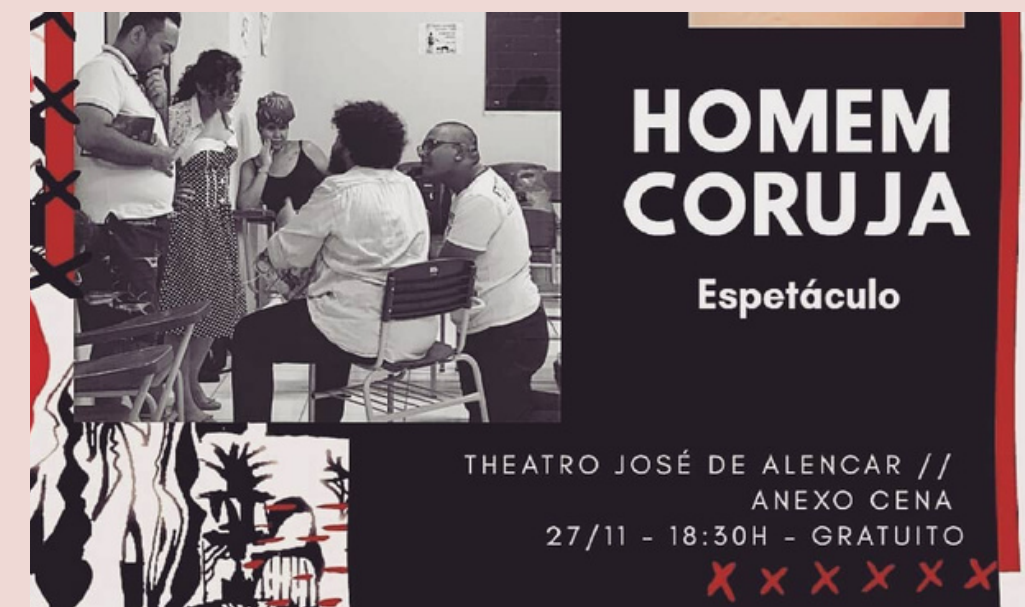
Cartaz de estreia no Festival Calungagem - 2019