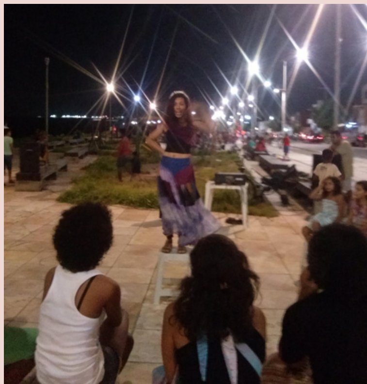
Sarau de Mulheres - Sabacu da Arte no sistema/Pirambu - 2016