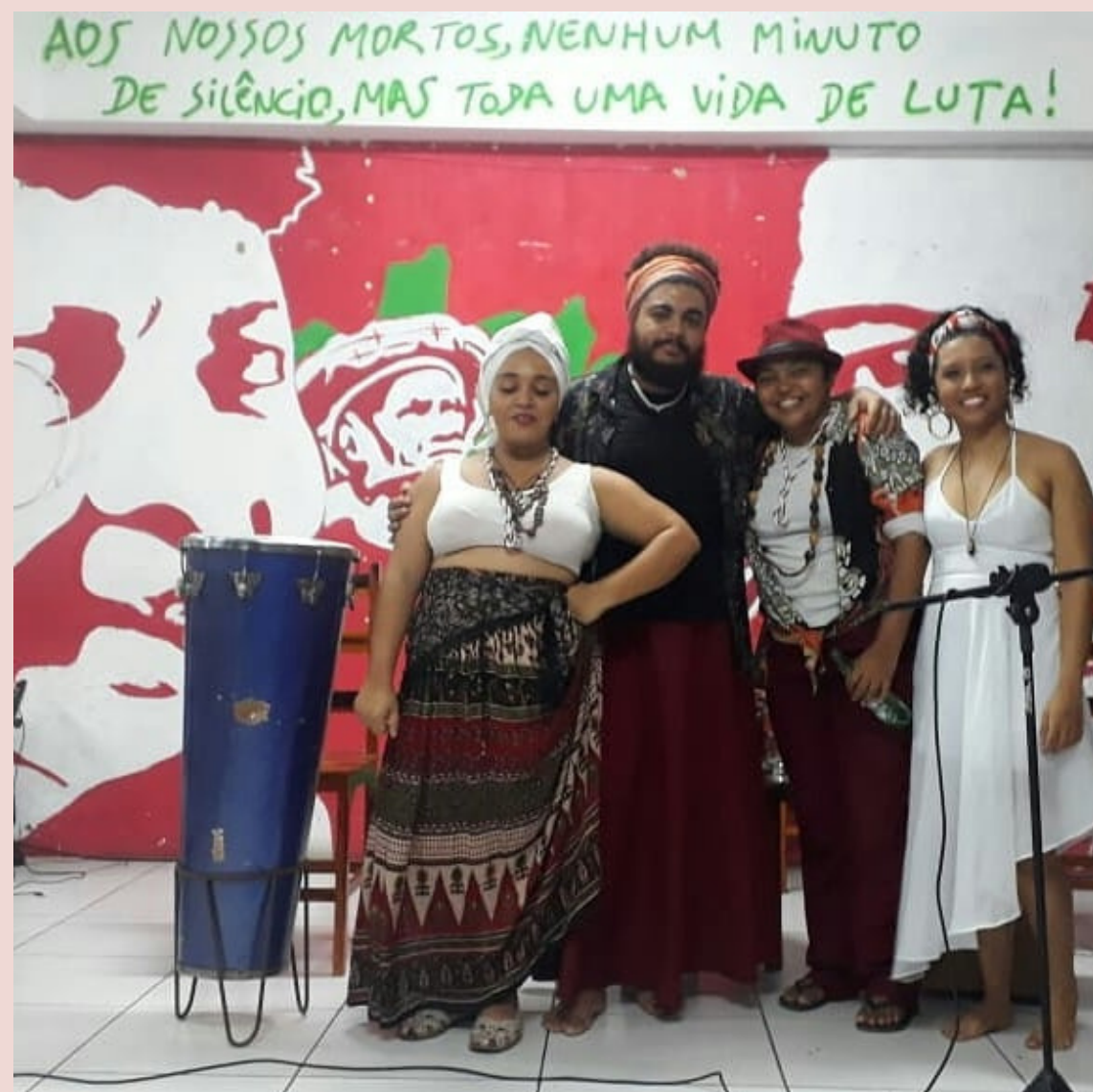
Sangue de Preto e outras Batucadas - 2019 (Participação/Caxixi e Voz/Resposta) No espaço Frei Tito