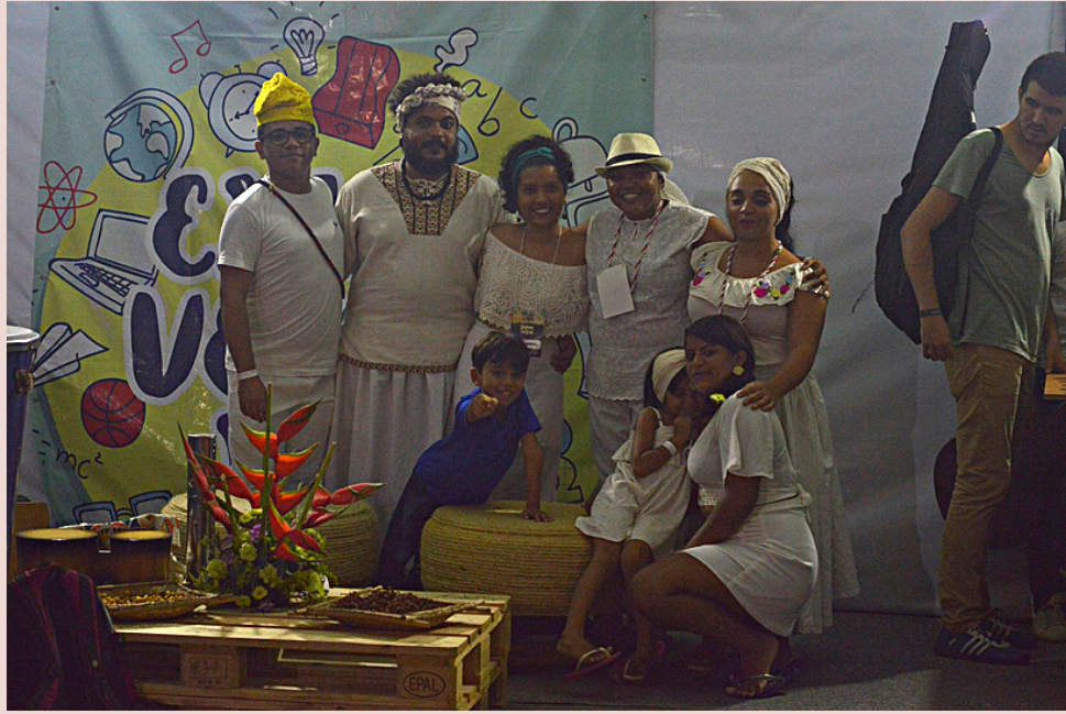
Encontro SESC POVOS DO MAR com Coco das Goiabeiras da Rainha do Mar - 2019 (Gravação/fotos)