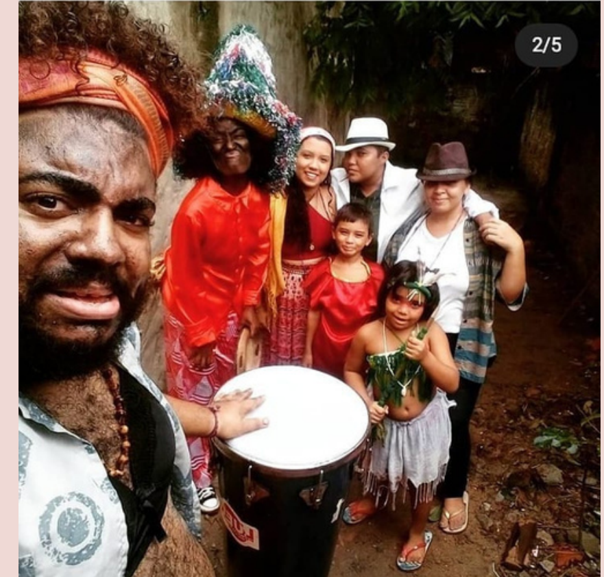
Batizado Boi Canarinho Casa das Negas - 2021 (Brincante/Cigana)