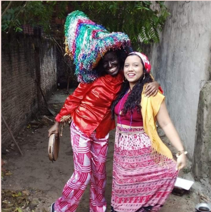
Batizado Boi Canarinho Casa das Negas - 2021 (Brincante/Cigana)