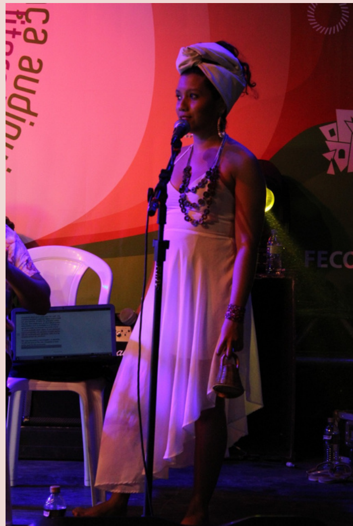
Peço Agô - 2019 (Pesquisa, Caxixi e Voz resposta) III Mostra de Artes do Centro Cultural Bom Jardim (Espetáculo de Música criado através do Laboratório de música do Centro Cultural do Bom Jardim - 2019)