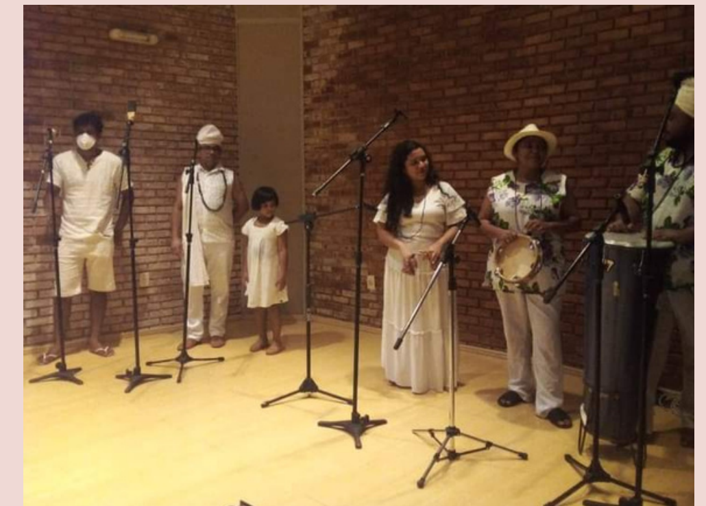
Encontro Sesc Povos do mar - projeto Sesc cocotorémoré de registro sonoro dos cantos, rezas e rituais das comunidades tradicionais. - 2021 (Voz/resposta, Caxixi)