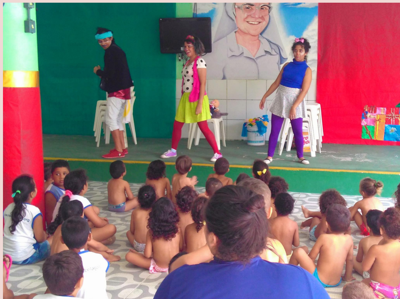
Descubra outra versão de você - 2018 (Palhaça Bue)

O espetáculo fala sobre como podemos lidar com os acontecimentos da vida, descobrimo sempre novas versões de nós mesmos