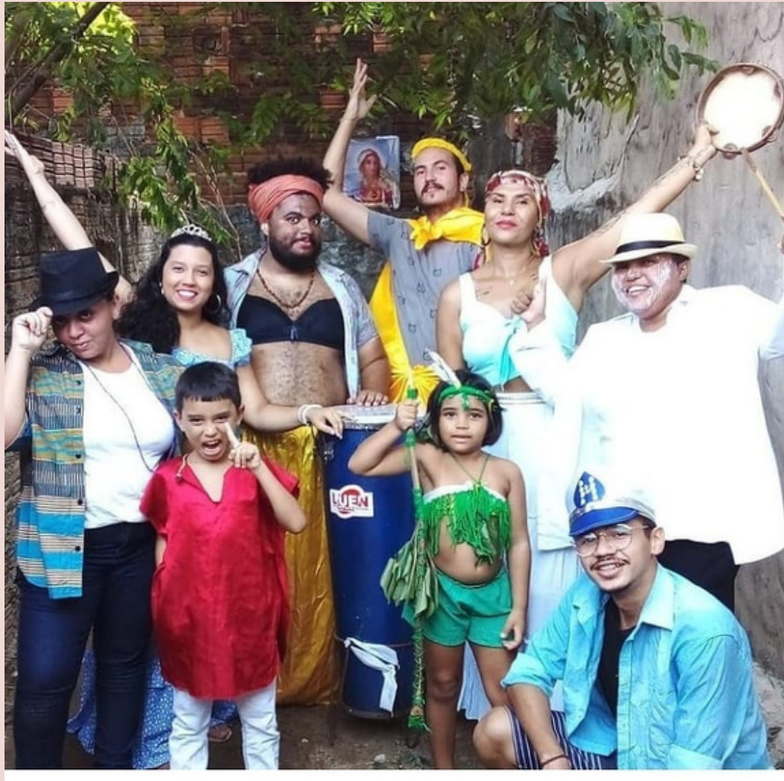
Nascimento Bumba Meu Boi Canarinho Casa das Negas - 2021 (Brincante/Rainha)