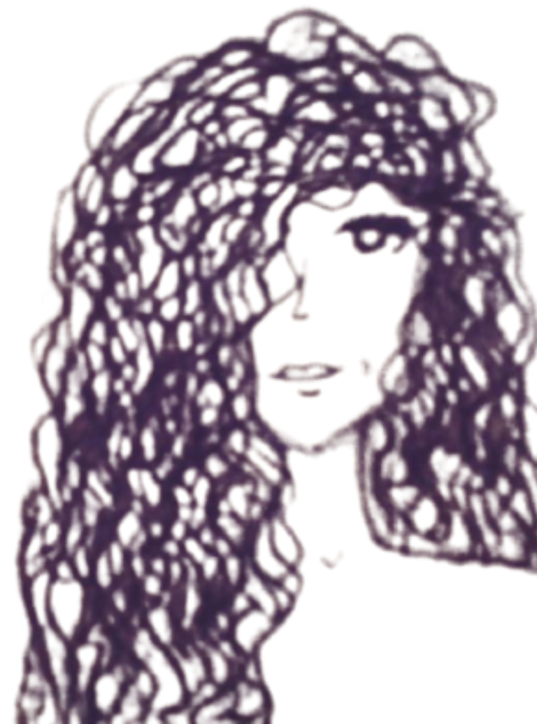
ilustração: Taciana Santos

A menina que fala é uma persona e performance poética voltada para apresentações em formato de sarau. Sob este pseudônimo, assino poemas de minha autoria e mantenho plataforma virtual que serve como acervo poético. Neste projeto sou idealizadora, poeta, atriz/performer e escritora.