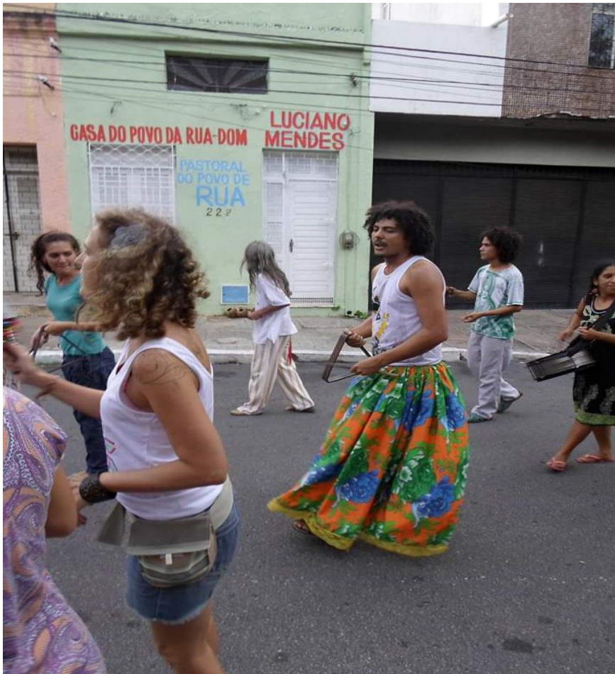
Oficina Viver Maracatu no Grito Rock Fortaleza