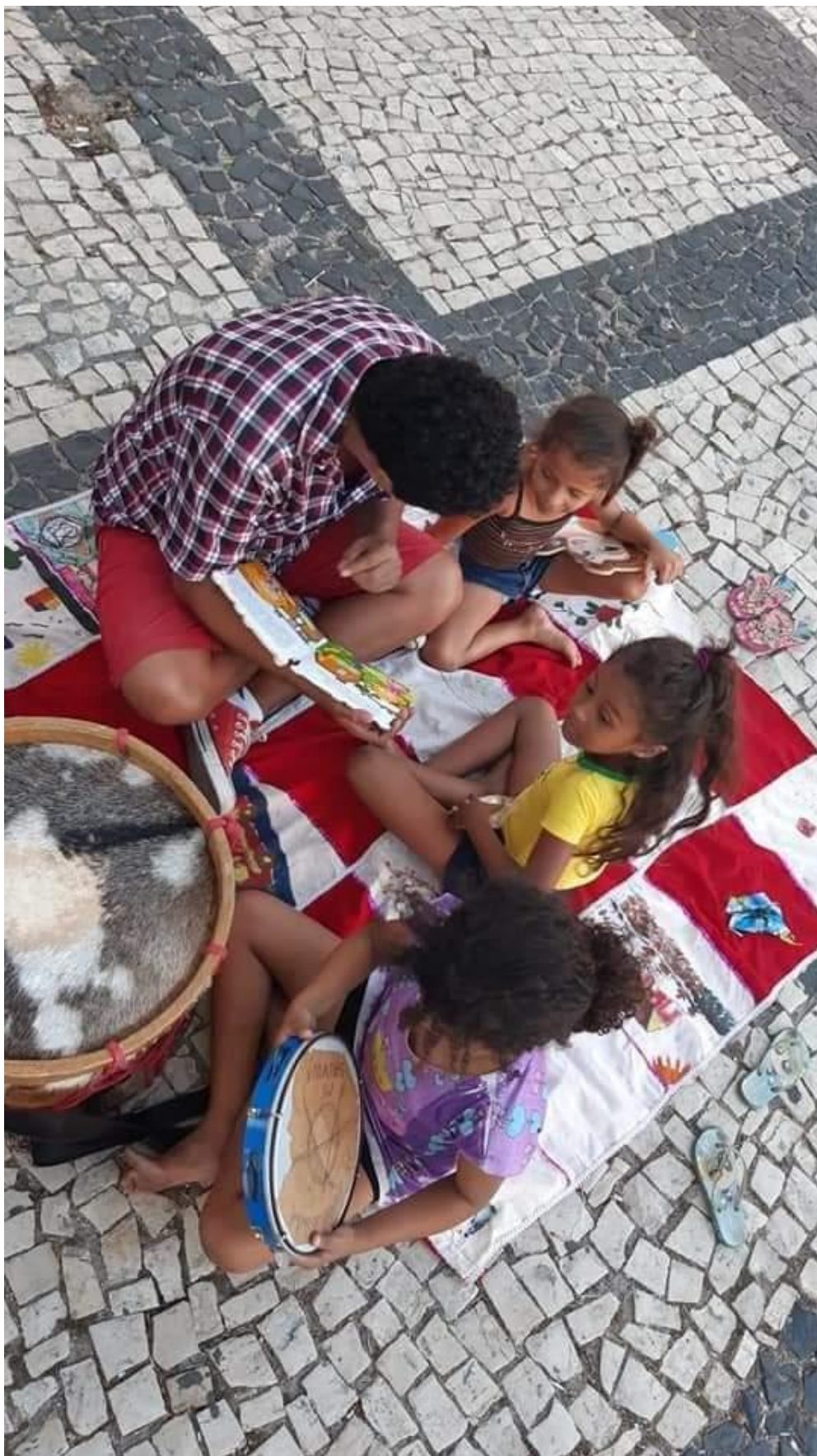
Oficina de Musicalização – Projeto Fortalece Redes – Associação Criança Não É de Rua em 2020