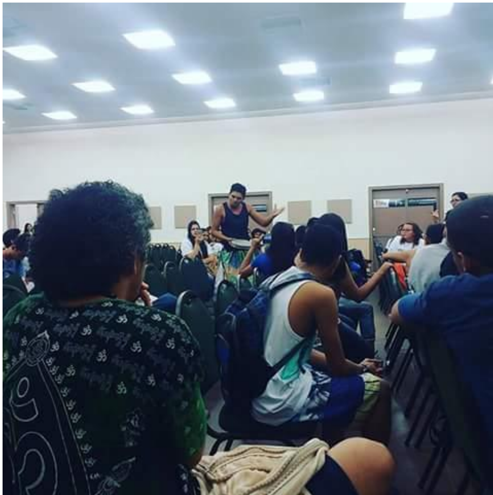
Apresentação na Bienal Internacional do Livro do Ceará em 2017