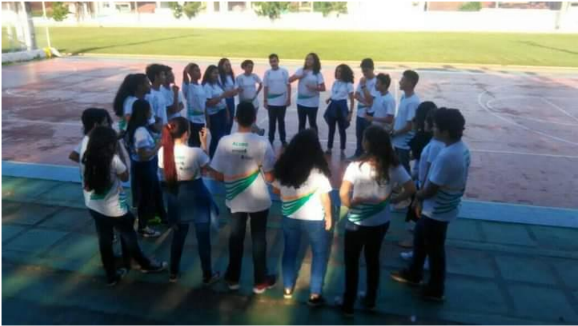
Oficina de Teatro – Programa Integração – Pólo João 23 em 2019