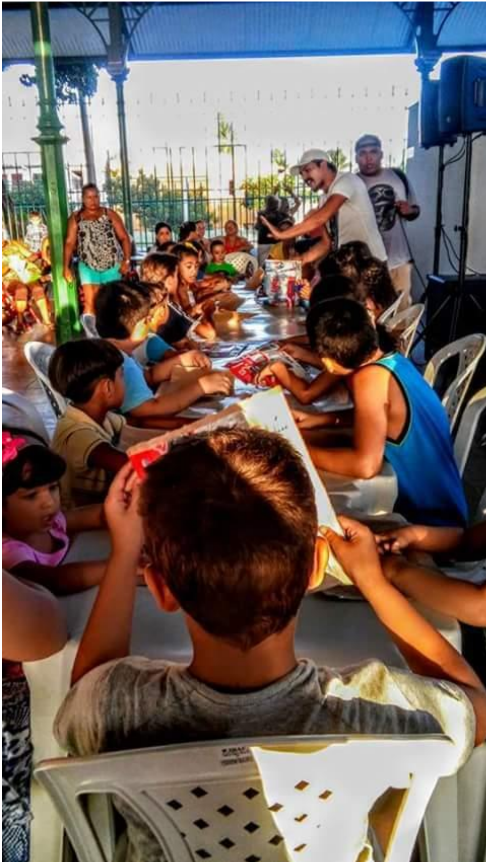
Oficina de Percussão - Mercado Cultural da Aerolândia