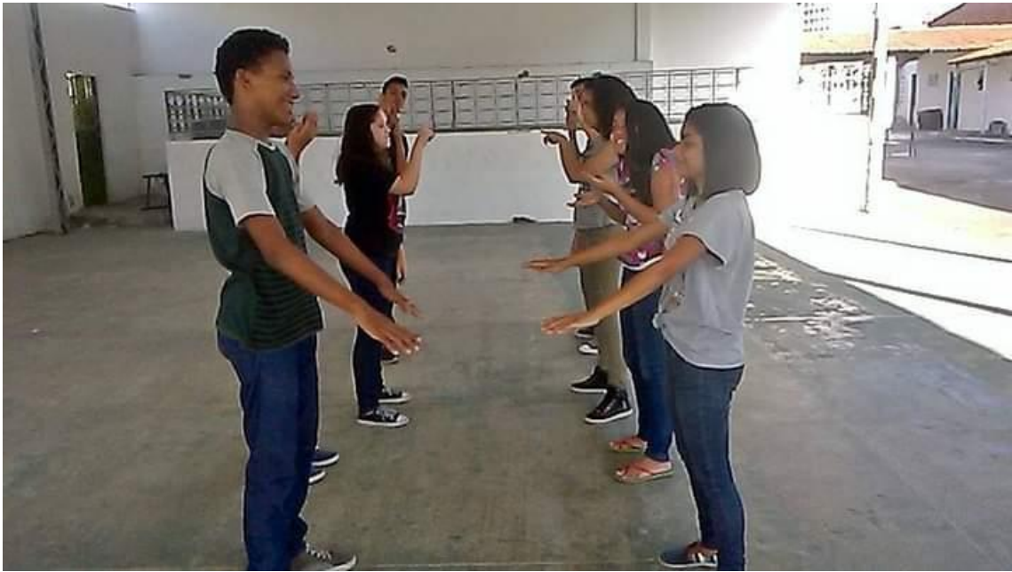
Oficina de Teatro – Programa Pró Técnico – Pólo João 23 em 2017