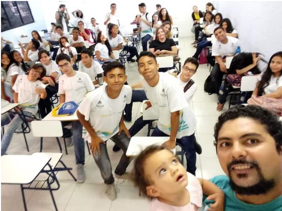
Aula de Arte no Programa Interação