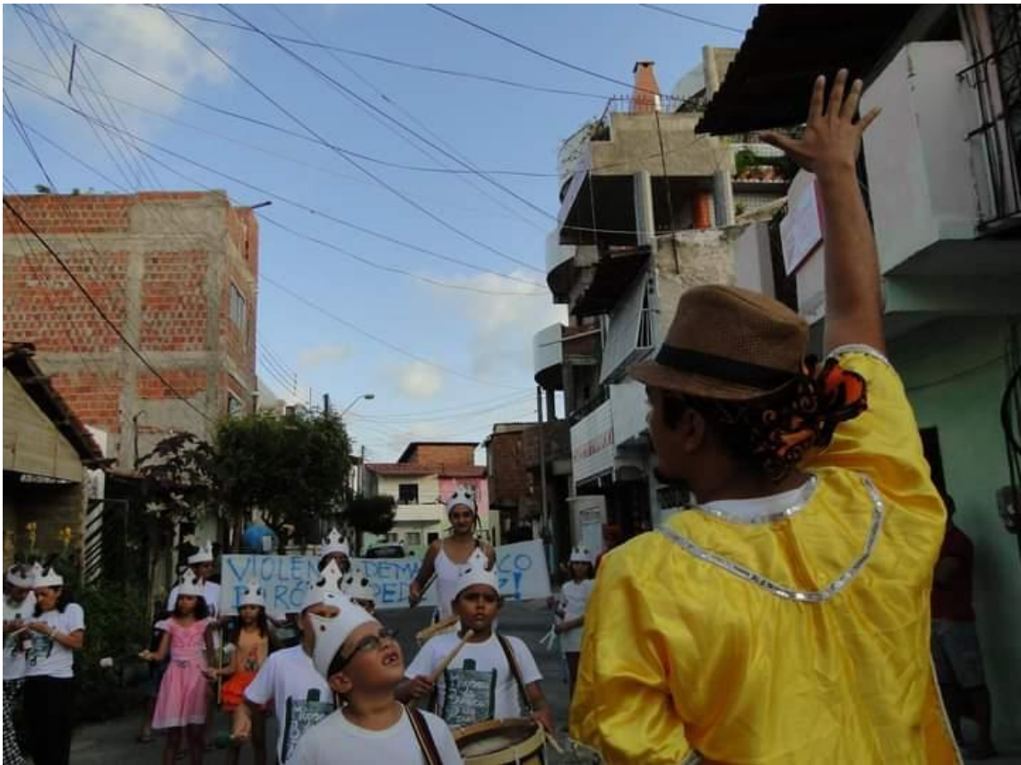
Bloco Roi Roi – Pré Carnaval do Planalto Píci