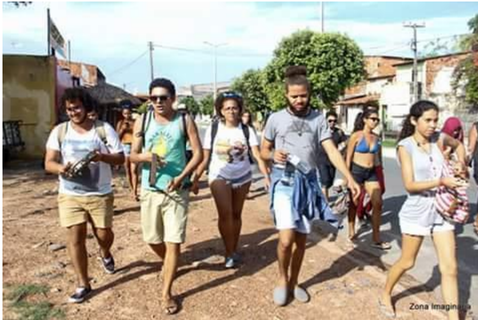
Bienal da Une