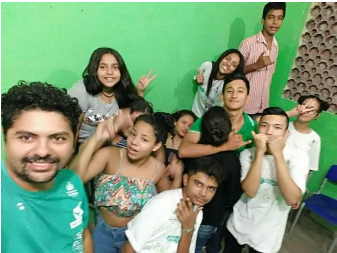
Oficina de Teatro – Programa Pró Técnico – Escola São José no Presidente Kennedy em 2018