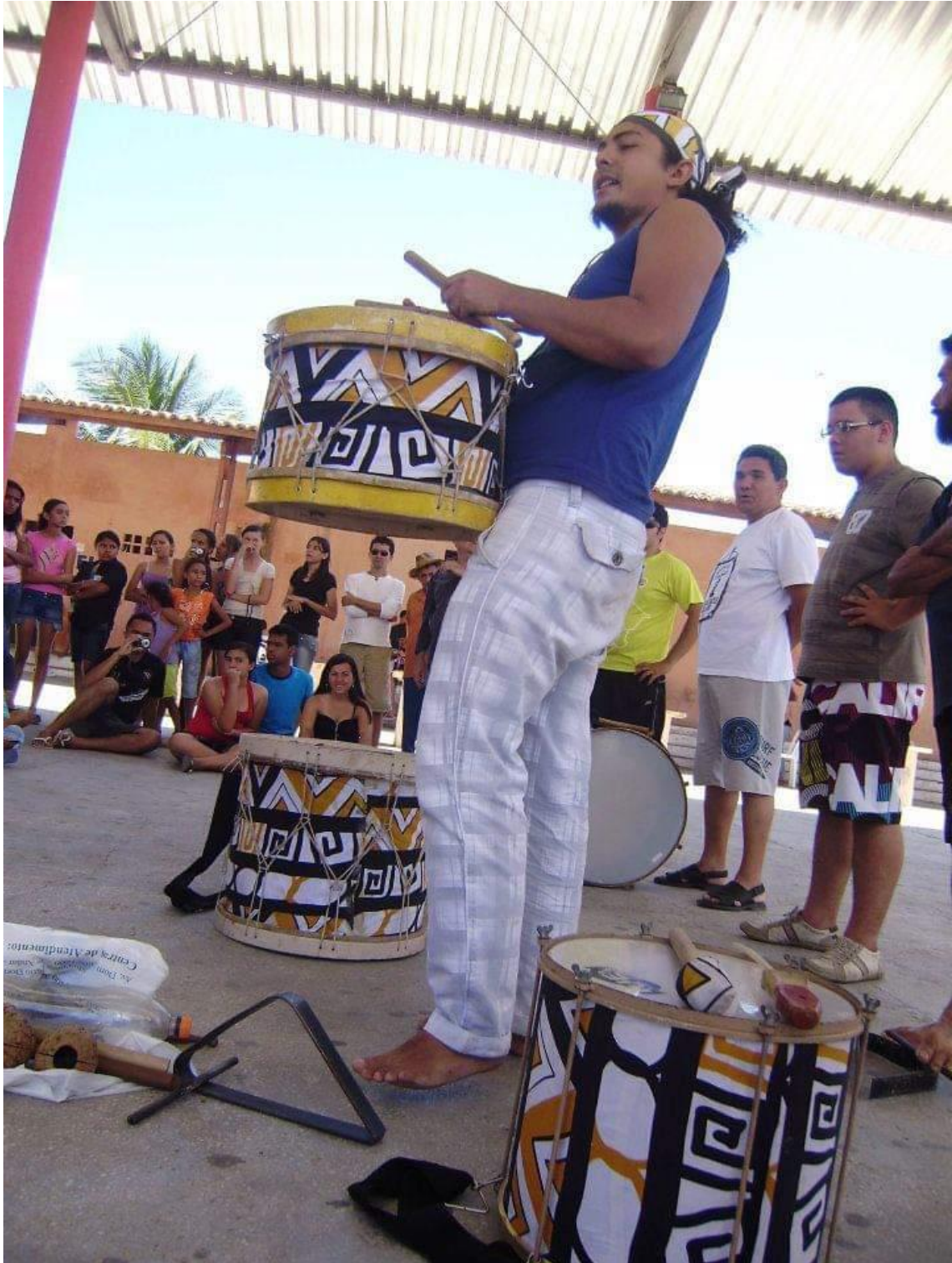
Oficina de Maracatu em Piquet Carneiro – CE