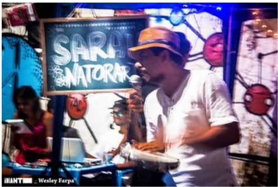
Apresentação do Sarau Natorart