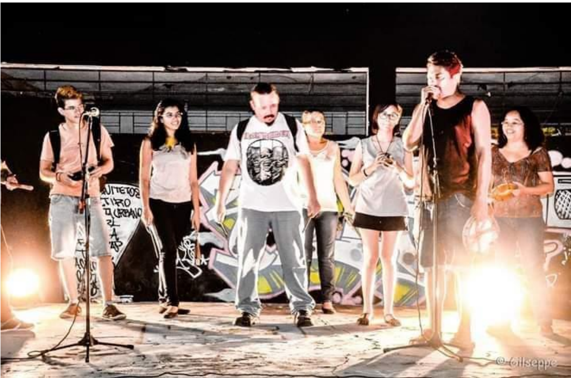
Apresentação no Sarau O Corpo Sem Órgãos