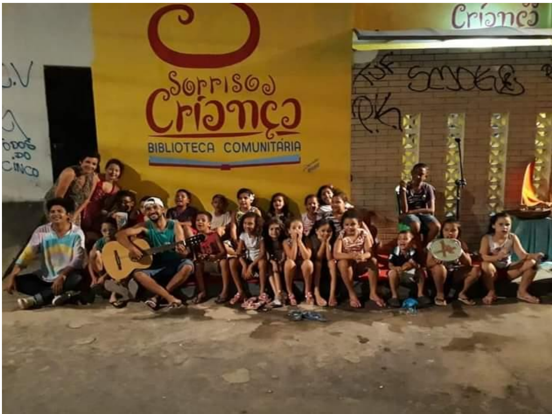
Oficina de musicalização no Projeto Comu Lê