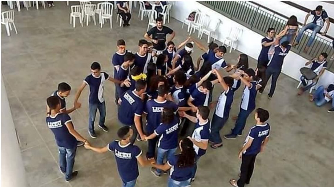
Oficina de Teatro PIBIB – Liceu do Conjunto Ceará em 2017