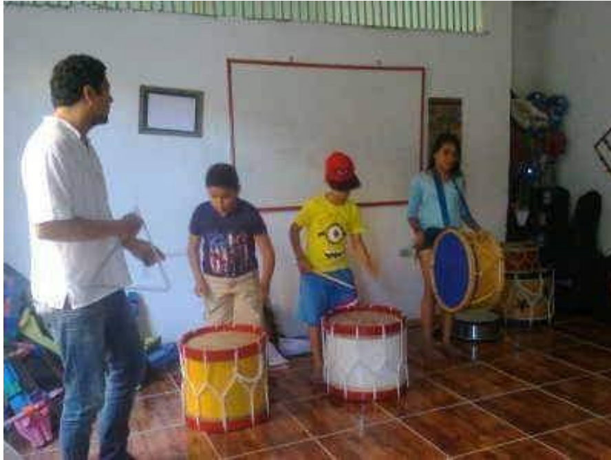
Oficina de Batuque - Museu da Boneca de Pano