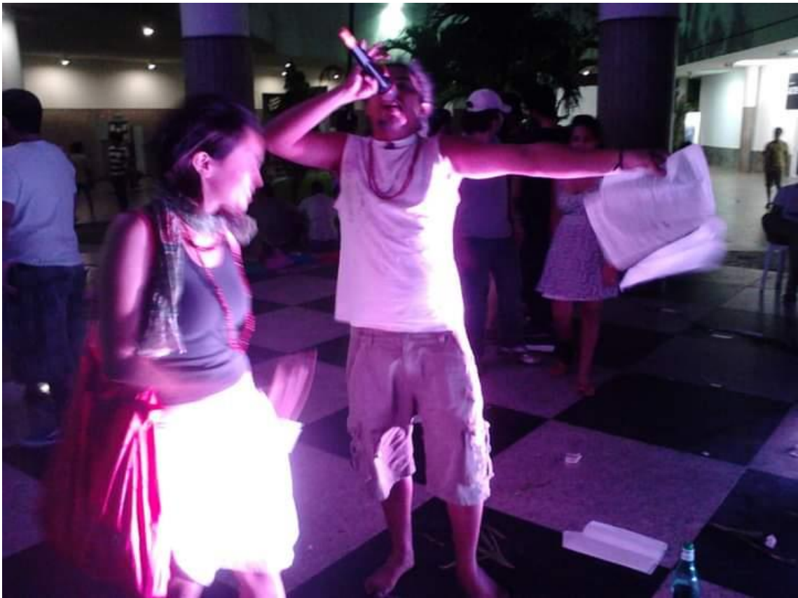
Estado de Poeta no Festival Manifesta