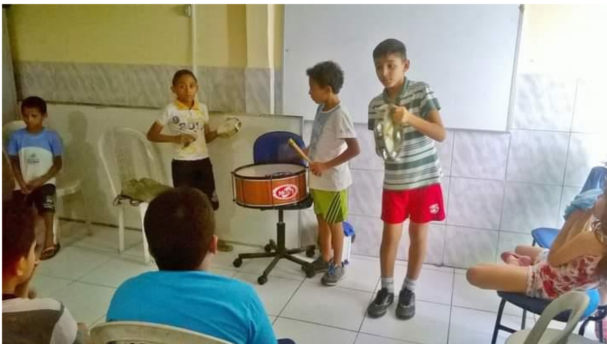
Oficina de Percussão – Programa Novo Mais Educação – Escola Irmã Maria Ivanete – Conjunto – 2017