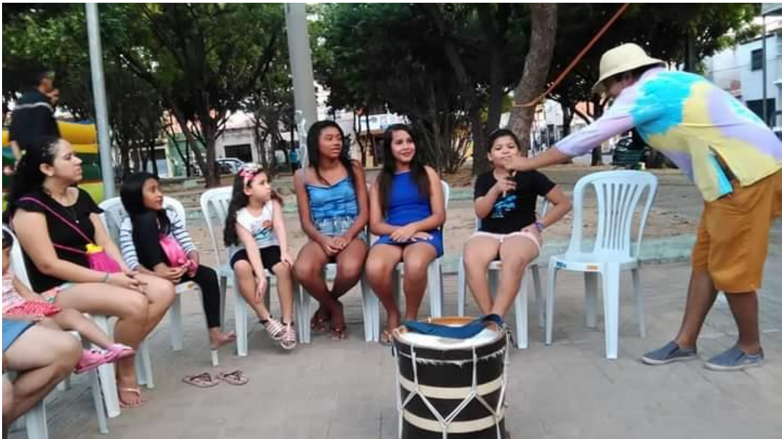
Oficina de Percussão – Projeto Bom de Fortaleza – Antônio Bezerra em 2018