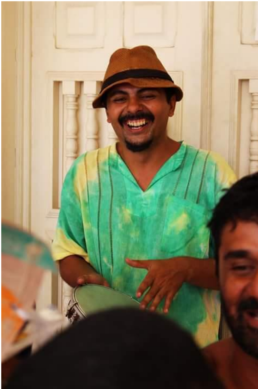
Apresentação Ocupa Funai