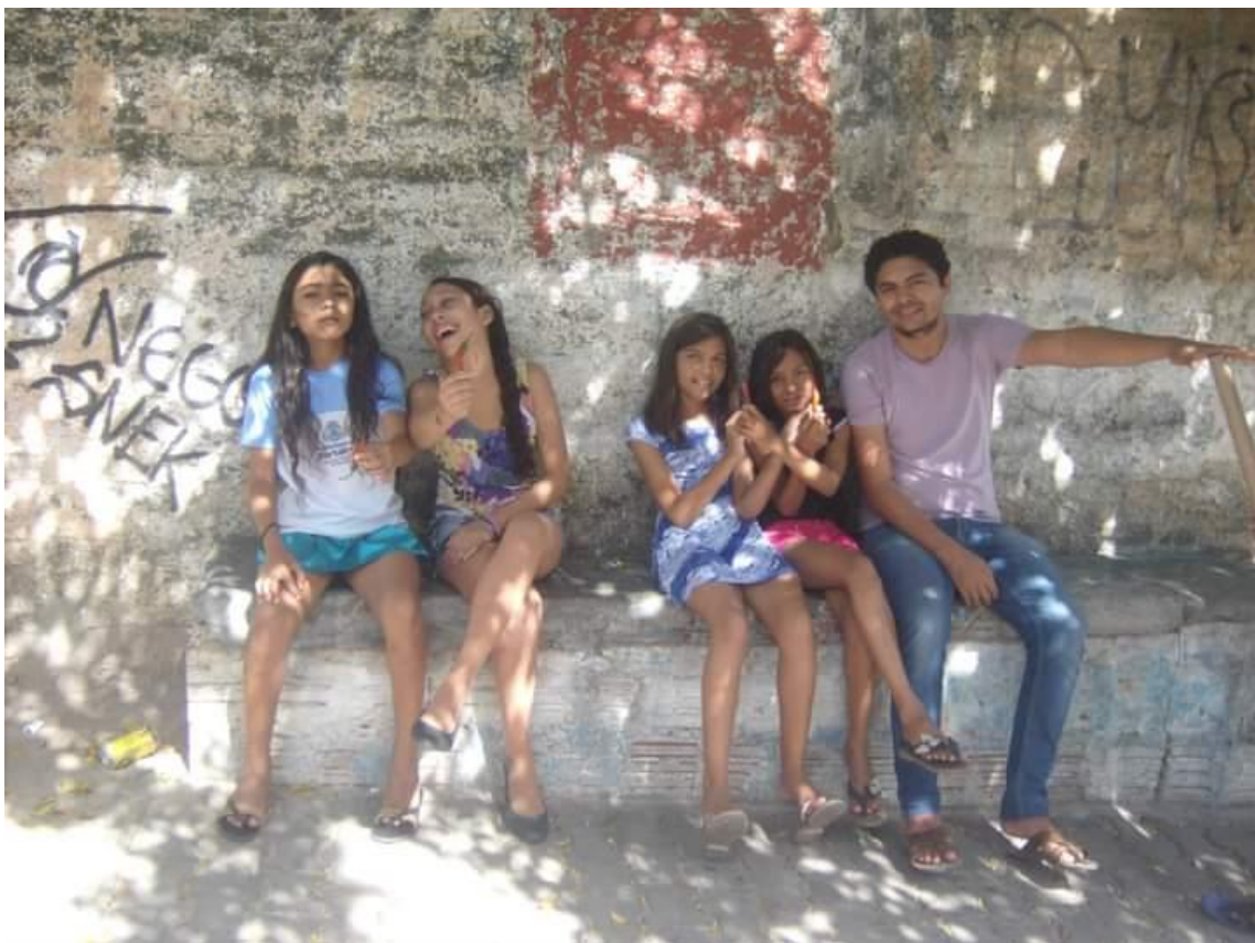
Oficina de Fotografia – Programa Mais Educação – Escola Dolores Alcântara no Autran Nunes em 2014.