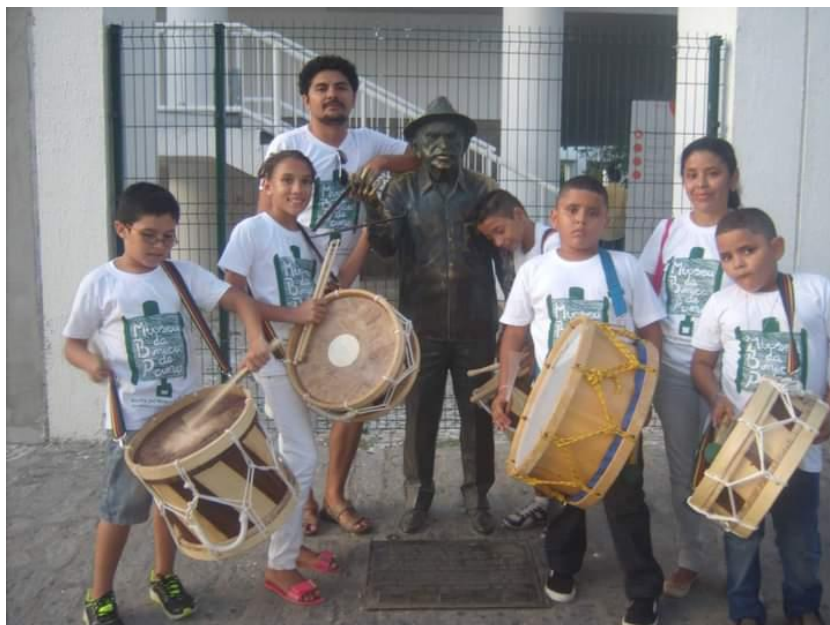
Apresentação do Bloco Rói Rói na Feira da Música