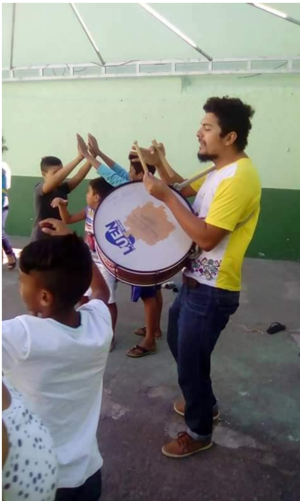
Aula de Teatro no Programa Mais Educação – Escola Irmã Maria Freire