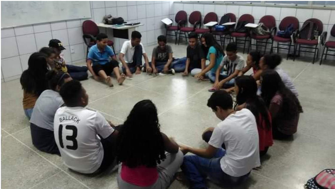
Oficina de Teatro – Programa Integração- Pólo Cuca do Jangurussu em 2018