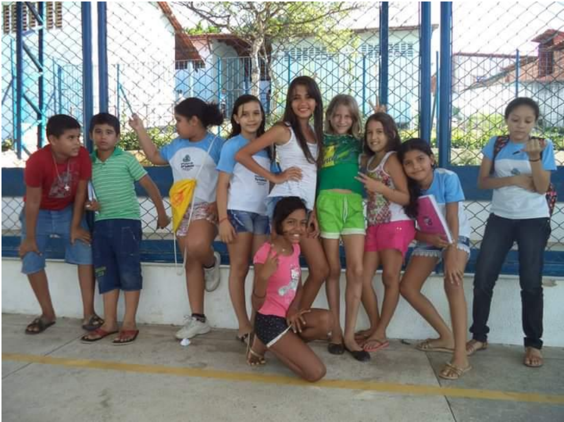
Oficina de Percussão – Programa Mais Educação – Escolas Dolores Alcântara no Autran Nunes em 2014.