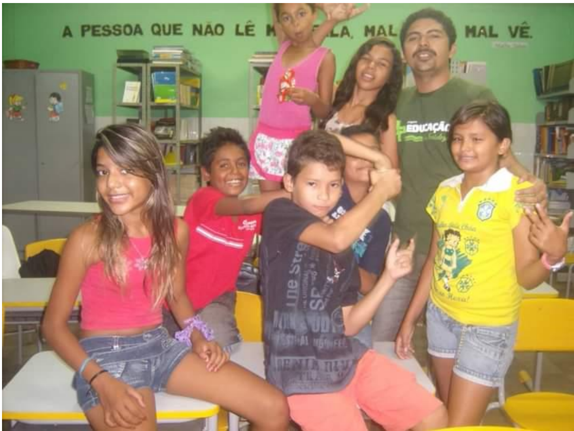
Oficina de Fotografia – Programa Mais Educação – Escola Dolores Alcântara no Autran Nunes em 2014.