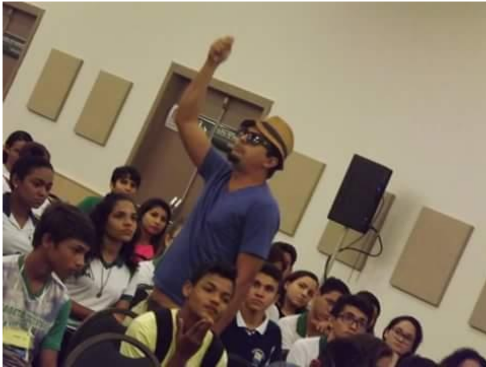
Apresentação na Bienal Internacional do Livro do Ceará em 2017