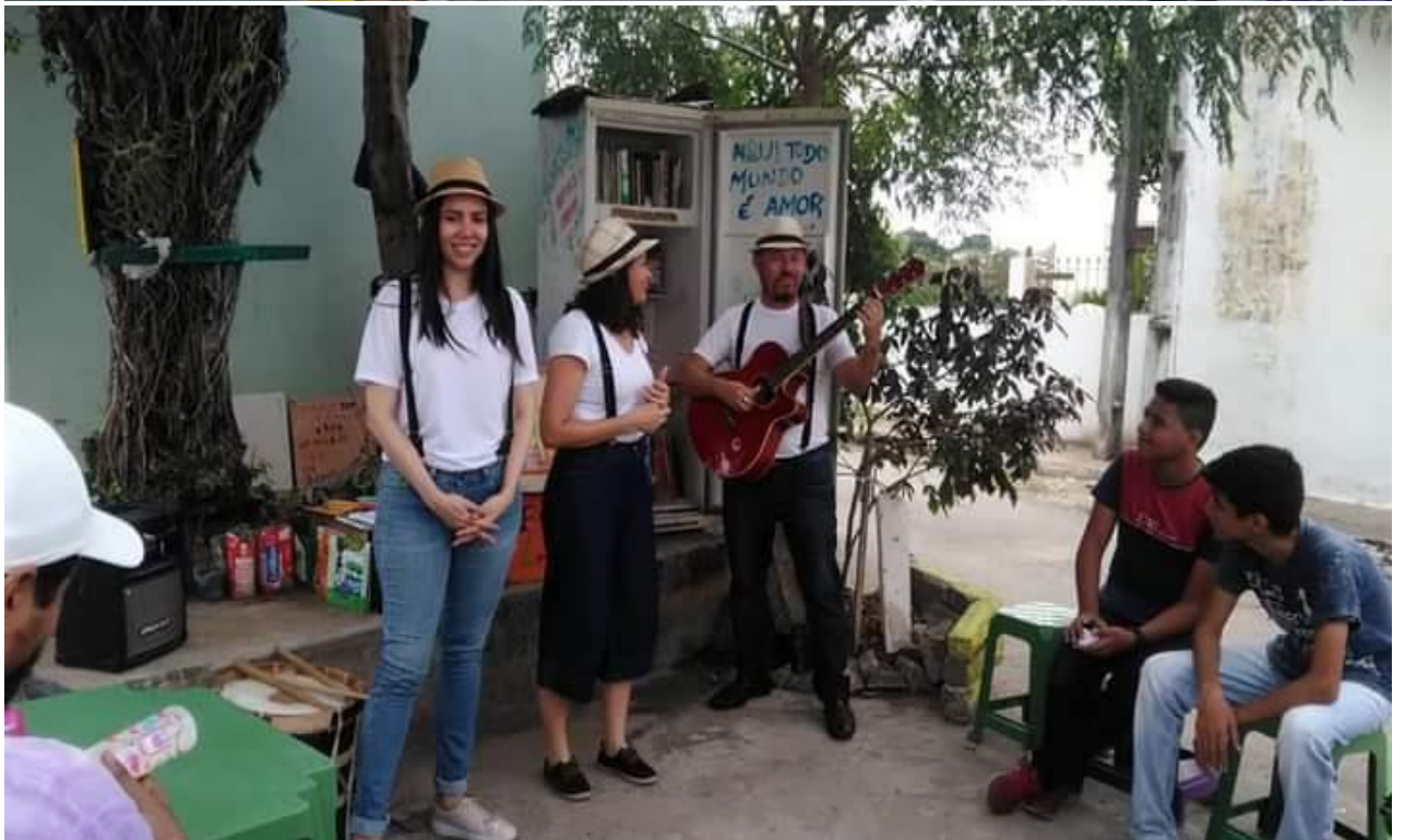
Recebendo o projeto Baú de Leituras da Casa do Conto em 2018