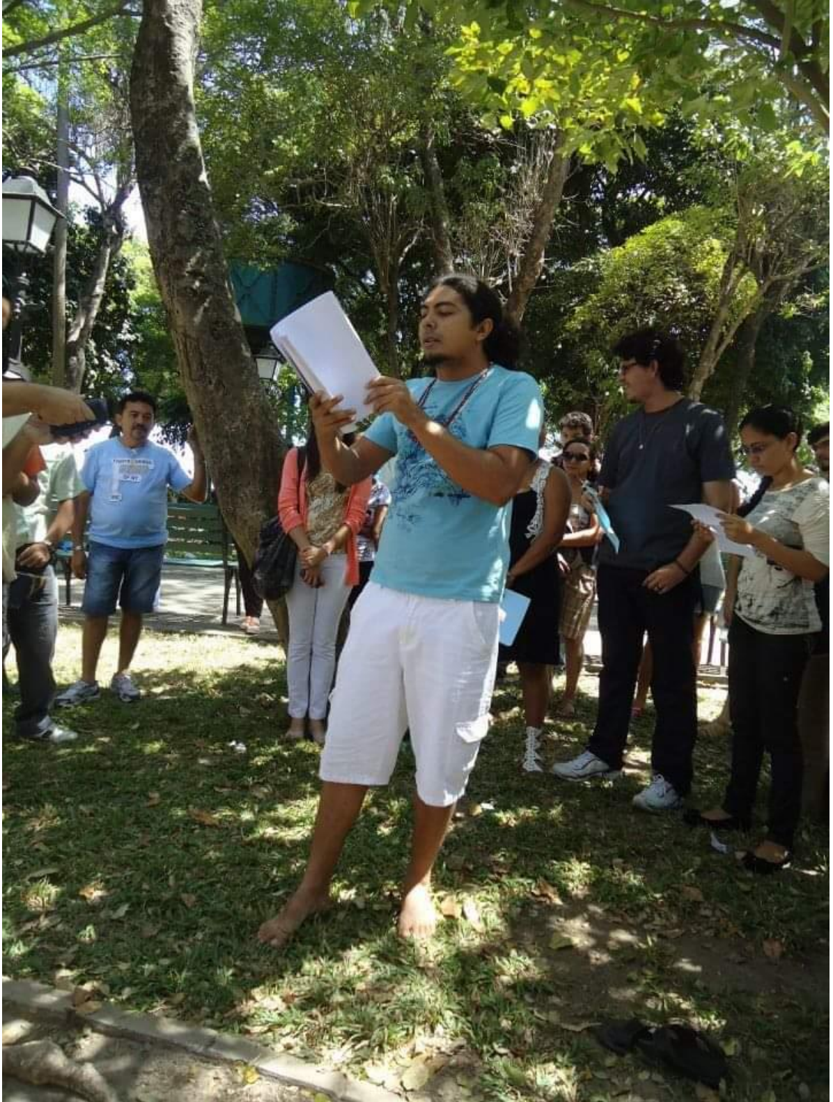
Festival Manifesta com o Templo da Poesia