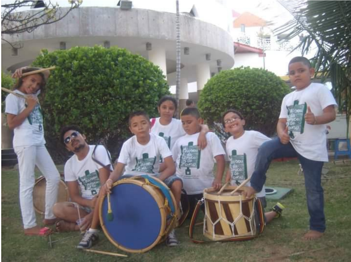
Oficina de Percussão na Feira da Música em 2015.