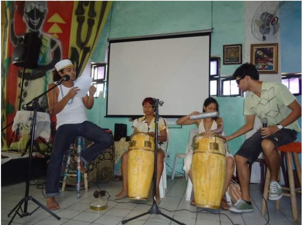
Ritmos e Batuques – Coletivo Provocações no Templo da Poesia