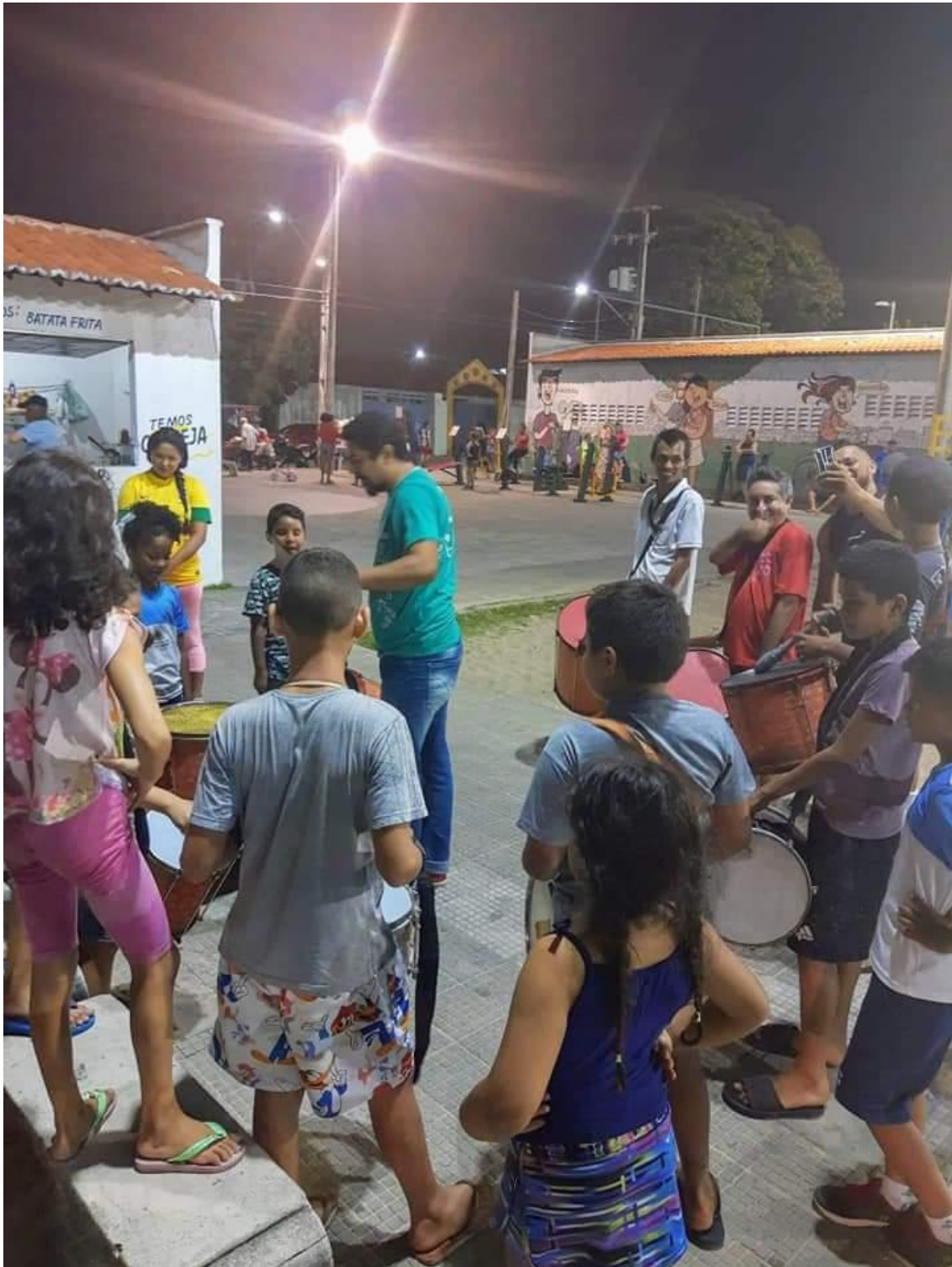
Oficina de Percussão – Escola de Ritmistas do Bloco Doido É Tu/Fundação Silvestre Gomes – Rodolfo Téofilo em 2019