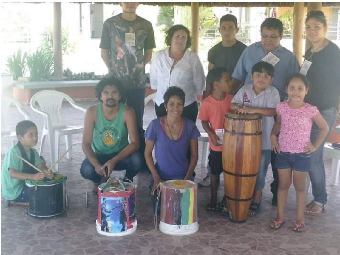
Oficina Viver Maracatu no Encontro Nordeste de Cultura e Cidadania