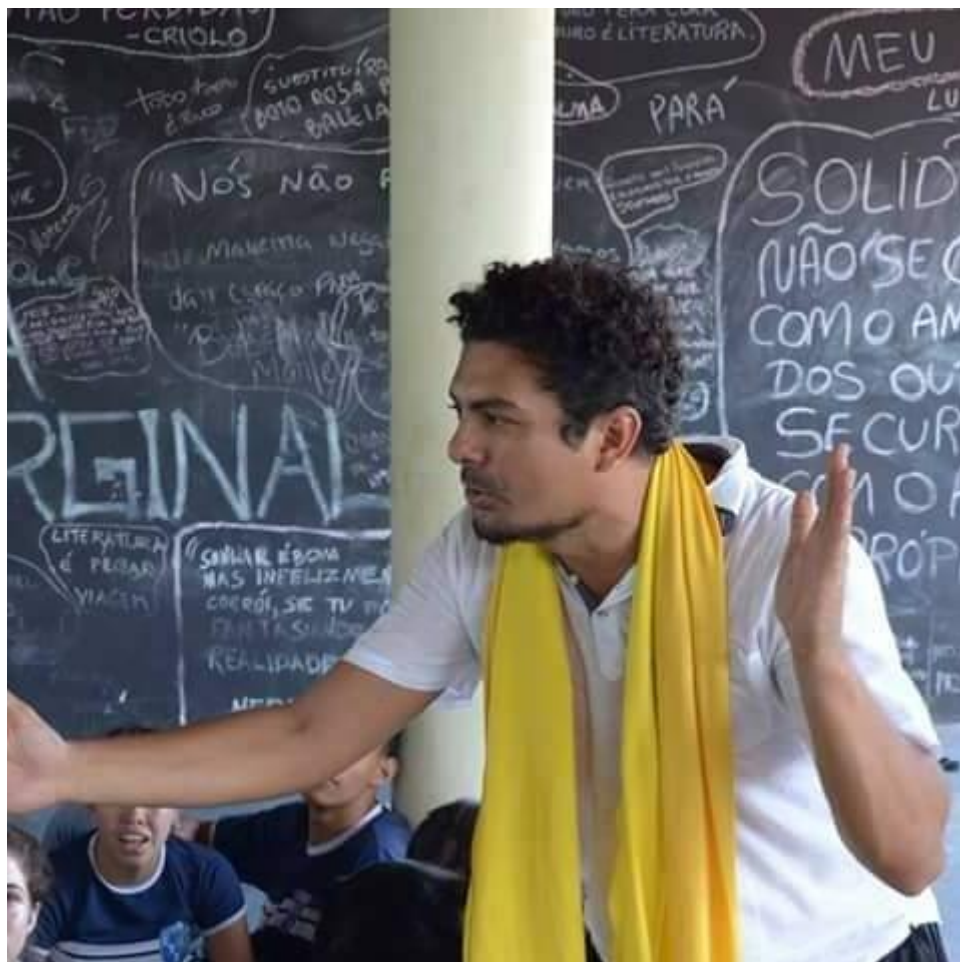
Apresentação no Colégio Castelo Branco