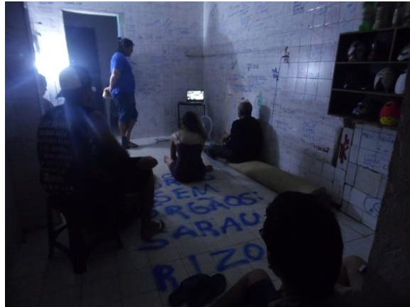
Figura 2 a sala onde a atividade era realizada em dia de sarau do coletivo