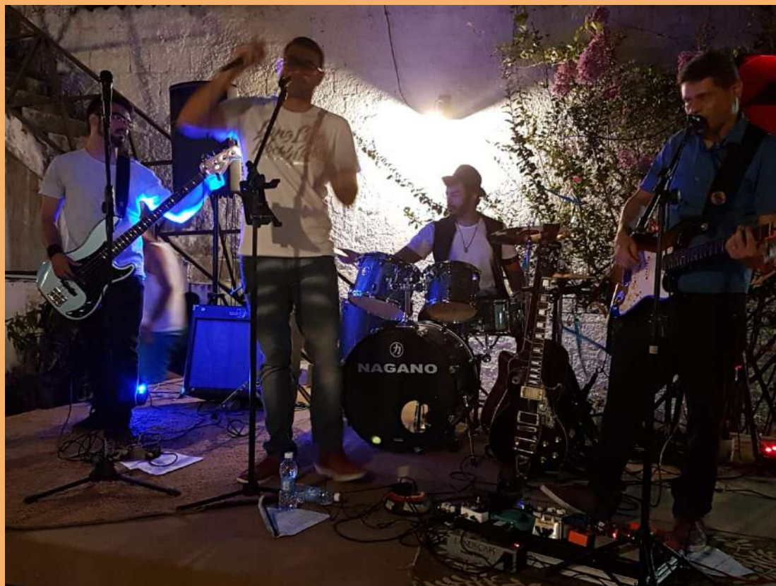
Tributo a Raul Seixas | Sobral, 2018