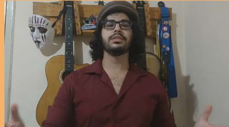
Interpretação de Tanto Mar de Chico Buarque | 2021