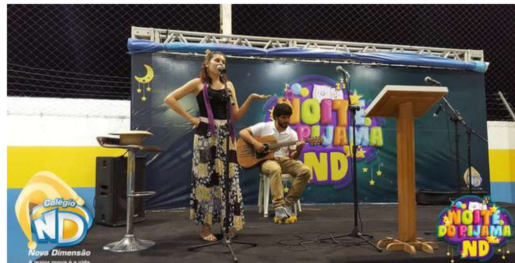
NOITE DO PIJAMA