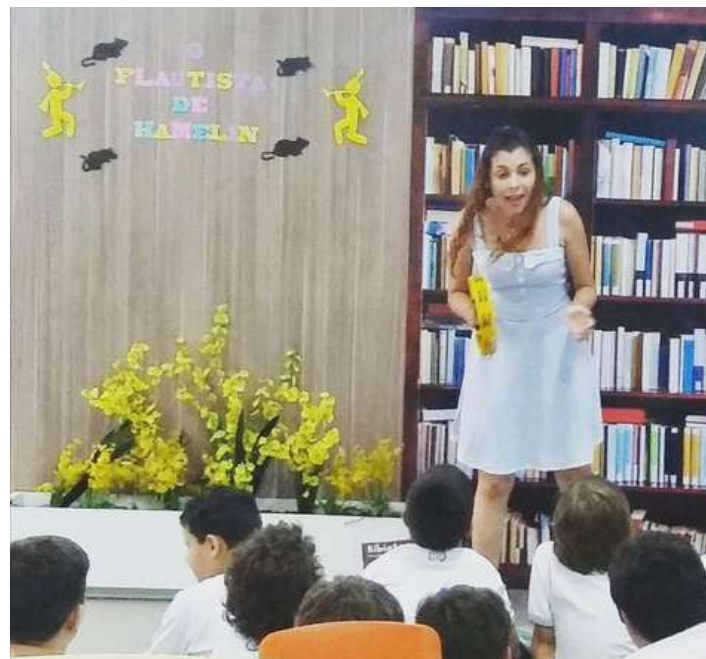
CONTAÇÃO DE HISTÓRIAS