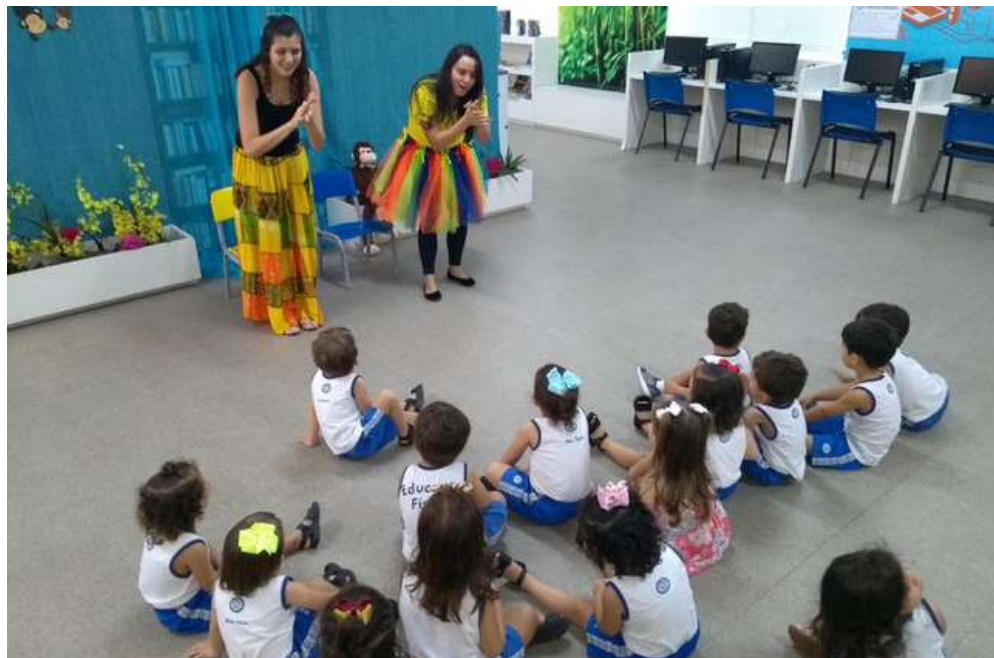
CONTAÇÃO DE HISTÓRIAS - EDUCAÇÃO INFANTIL