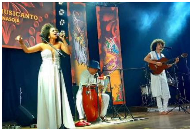
Festival Musicanto 2020 - Santa Rosa Rio Grande do Sul