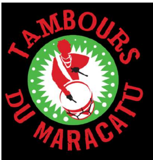
Tambores du Maracatu Rennes, França