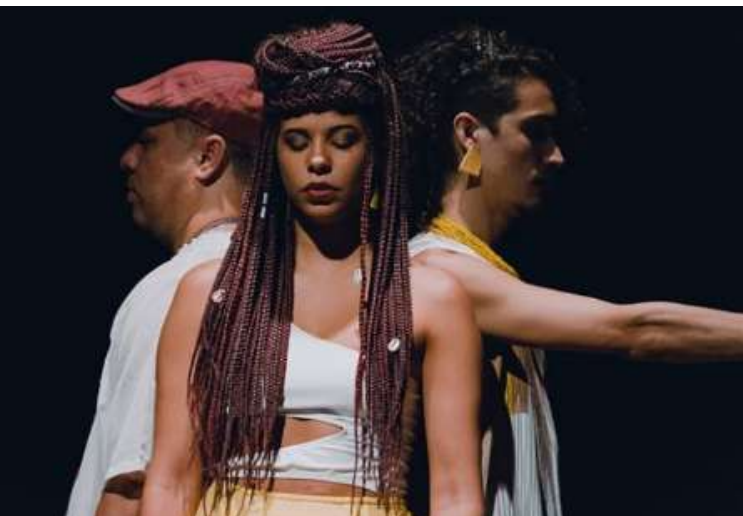
Lançamento do ep Fortalezas- Fortaleza 2020