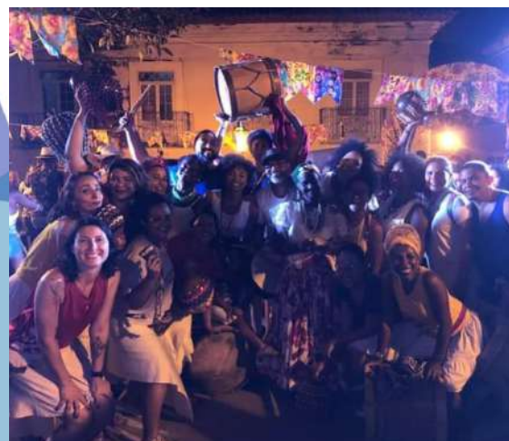
Afoxé Acabaca- Fortaleza ce