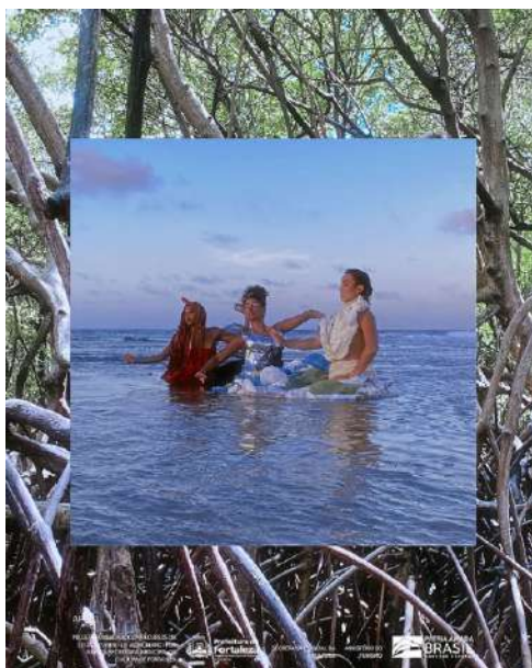
Vídeo clipe lara Música do ep Fortalezas