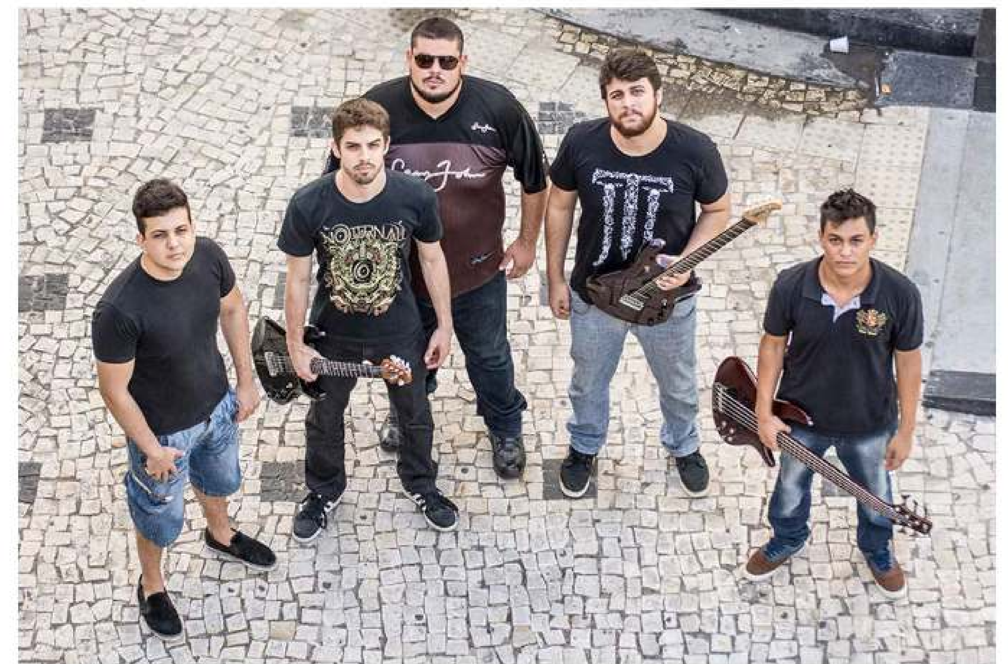
Quinteto Jack The Joker toca heavy metal progressiva