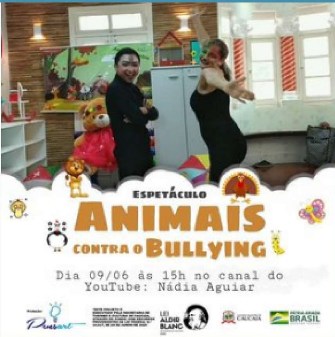
2019 - Teatro Infantil Produção executiva: Tatiana Soares | Pensarti