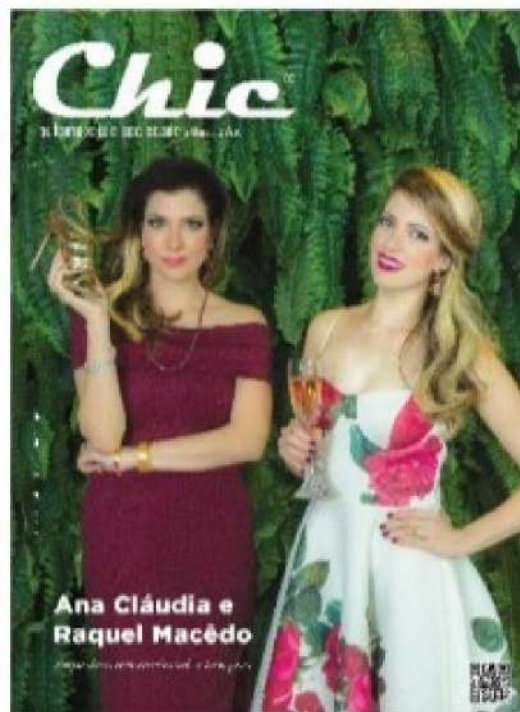
Beauty artist: Ticiane Gomes Produção de moda: Yáskara Monteiro Tratamento de imagem: Raul Peixoto

Chic ® automóveis e sociedade o Recasão Fundada em 07 de junho de 2005