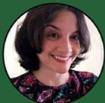
Ana Cecília Soares Editora