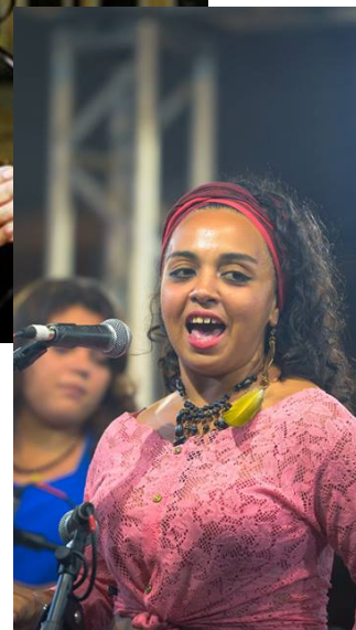
Festival For Raibow