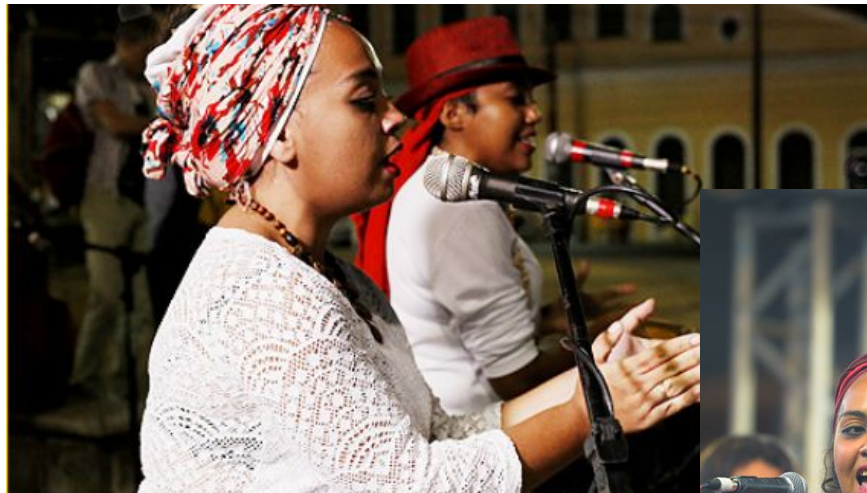
Festival Internacional de artistas de rua da Bahia

O trabalho dialoga com as manifestações de raízes populares e provoca o público a pensar o lugar da mulher nesses espaços, bem como na sociedade em que vivemos. Feito para feiras, praças, espaços alternativos e tradicionais, o trabalho das negas reflete o espírito da brincadeira de rua, de feira, de interior, interagindo diretamente com o público, proporcionando também ao espectador o contato com a espiritualidade popular.