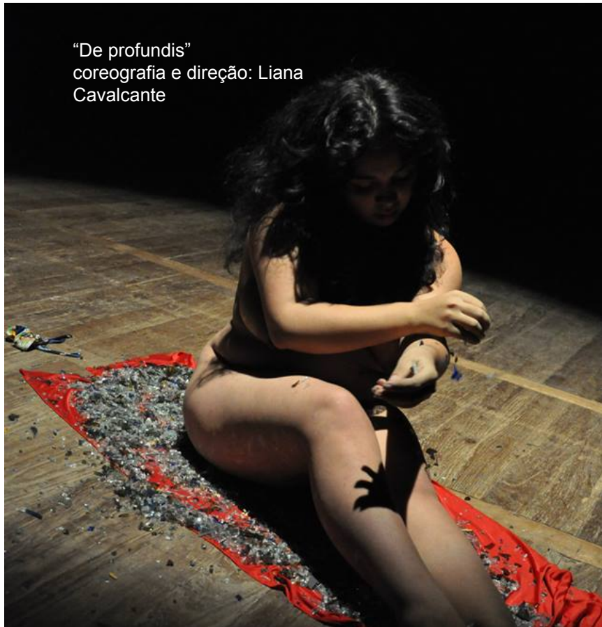
“De profundis” coreografia e direção: Liana Cavalcante