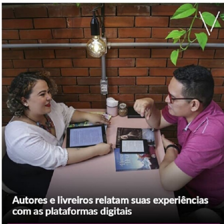
Autores e livreiros relatam suas experiências com as plataformas digitais

https://diariodonordeste.verdesmares.com.br/verso/autores-e-livreiros-relatam-suas-experiencias-com-o-livro-digital-1.2216775