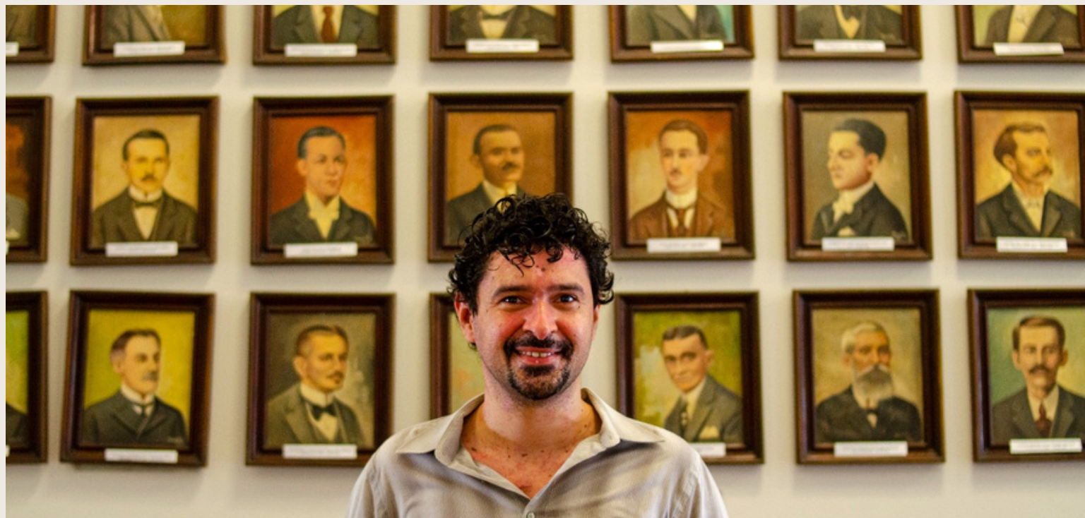
01 Série Entranhas, 2022

A série documental "ENTRANHAS" é composta por 6 episódios. A série apresenta e investiga a reverberação da Padaria Espiritual, um movimento autêntico e original que aconteceu nas terras desse Ceará.