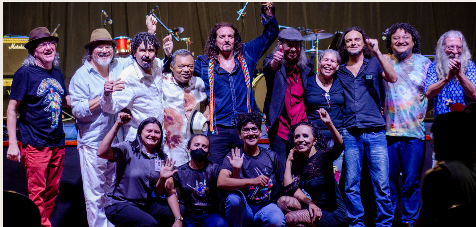
03 1º Festival A Massa, 2022

O Festival, além de ser uma celebração da cultura e da arte, também teve um foco especial na Padaria Espiritual, uma parte importante do nosso patrimônio cultural, que precisa ser cada vez mais reverenciada.