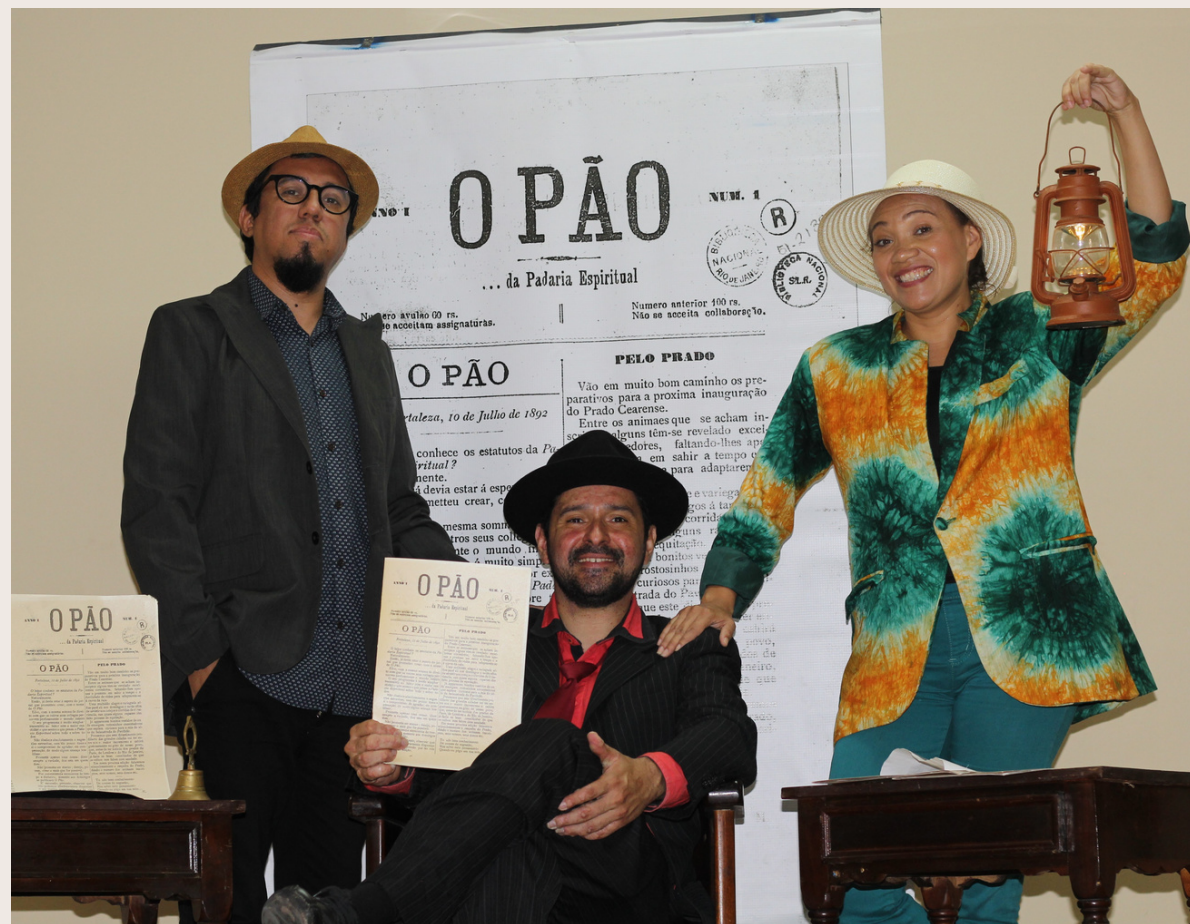
02 Sarau Padaria Espiritual, 2022

O “Sarau Padaria Espiritual” é uma jornada única e fascinante, onde um narrador e dois poetas entram em uma máquina do tempo e viajam ao passado para trazer ao presente o Pão da Padaria Espiritual. Alimentando o espírito com a arte e a poesia daqueles que têm fome de cultura, inspirações e revoluções.