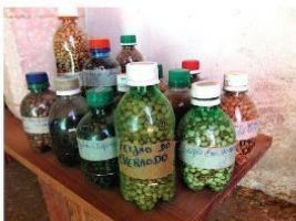
Parte do estoque coletivo da Casa de Sementes Pai Xingano. O grupo pretende diversificar as espécies guardadas para abastecer colaboradores