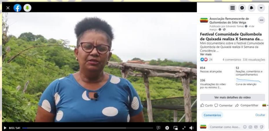
Figura 10 Minidocumentário sobre o Festival Comunidade Quilombola de Quixadá realiza X Semana da Consciência Negra.