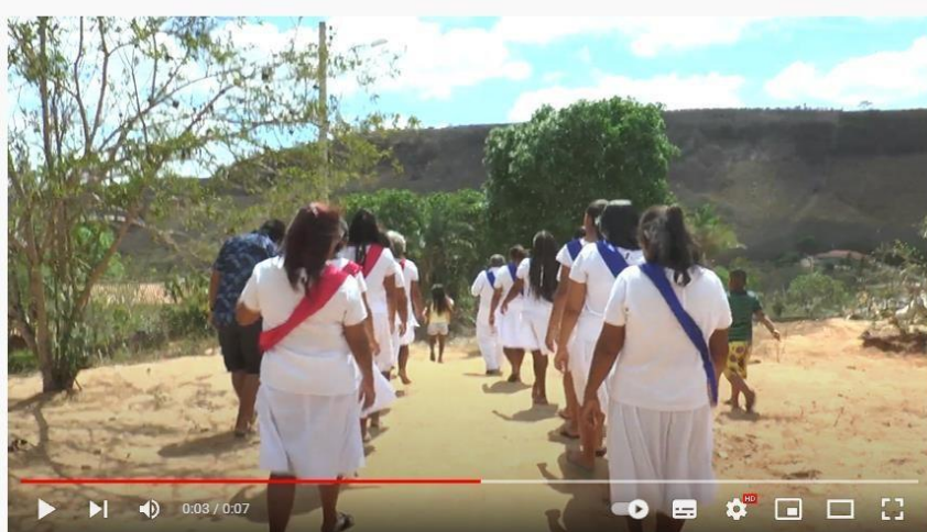
Trecho da Dança de São Dança Gonçalves | Parte I