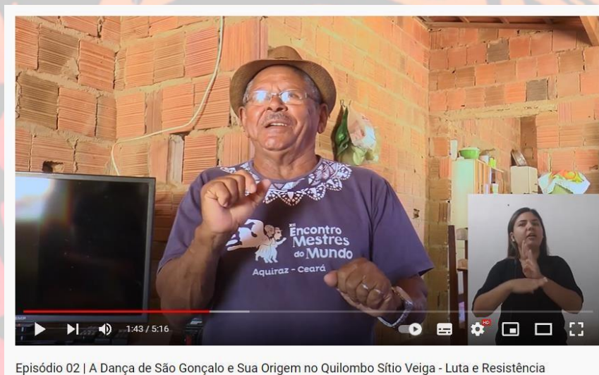
Episódio 02 | A Dança de São Gonçalo e Sua Origem no Quilombo Sítio Veiga - Luta e Resistência