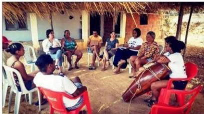
Rodas de conversa serão realizadas na IX Semana da Consciência Negra na comunidade quilombola do Sítio Veiga.

Até o próximo sábado (23) a Comunidade Quilombola do Sítio Veiga , na Serra do Estevão, distante 25 km do Centro de Quixadá, realiza a IX Semana da Consciência Negra . Palestras, rodas de conversa e atividades culturais são algumas das atividades iniciadas na manhã deste domingo (17) com um torneio quilombola.