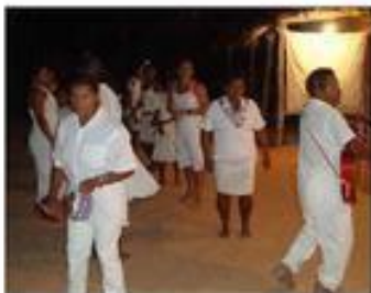
Manifestação cultural - Dança de São Gonçalo