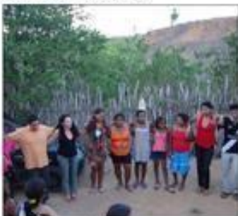
Curso - Gestão de Água para Produção de Alimentos

A dança de São Gonçalo, que acontece no mês de julho por ocasião da Caravana da Cultura – um costume do distrito, além de outros momentos quando as pessoas fazem promessas; o grupo de capoeira, e outras manifestações são parte destas características e manifestação da cultura local.