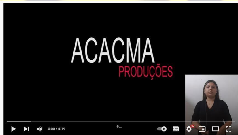
Figura 5 Episódio 1 | Dança de São Gonçalo e Sua Origem no Quilombo Sítio Veiga