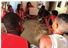
No projeto de leitura com crianças e jovens do Sítio Veiga é dialogado sobre a importância das sementes crioulas

Os moradores do Veiga perceberam que suas sementes resistem melhor às condições climáticas da região, produzem espigas de milho maiores e maior quantidade de palha que serve de forragem para os animais. Além disso, há entre eles o propósito de não depender do fornecimento de sementes do governo, que muitas vezes atrasam e são de difícil acesso para os agricultores e agricultoras. Grãos transgênicos e híbridos são considerados sementes envenenadas, que podem contaminar suas sementes crioulas, por isso zelam por sua casa de sementes, para que a biodiversidade seja mantida.