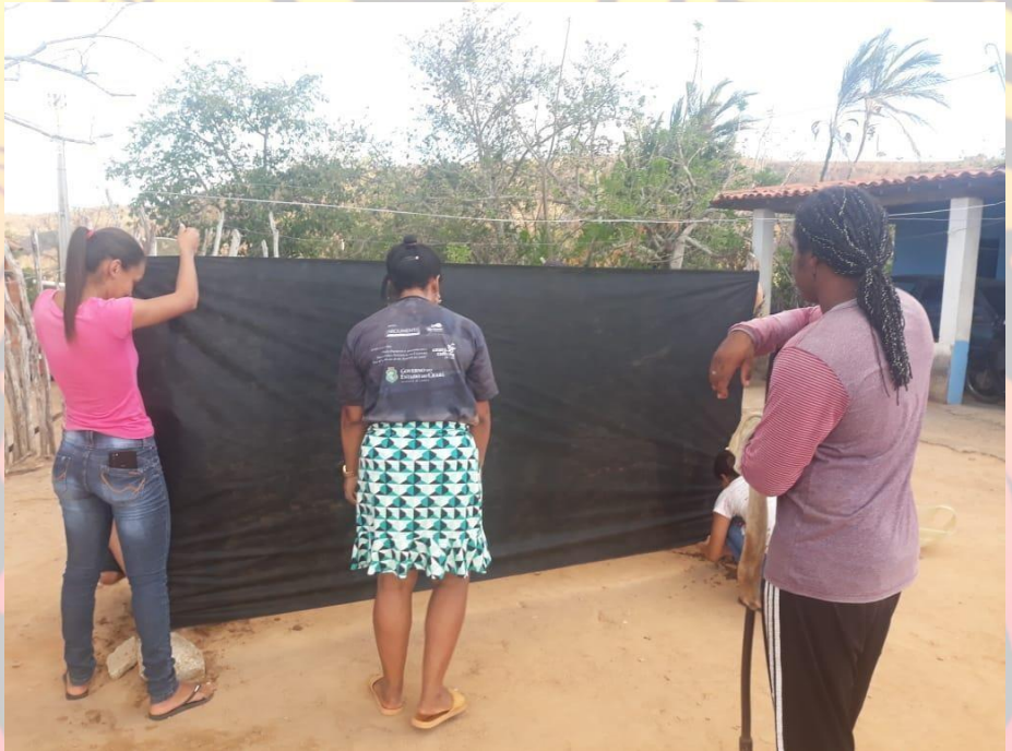
Figura 1 EDITAL DE PATRIMÔNIO CULTURAL DO CEARÁ - LEI ALDIR BLANC

2020-Festival Comunidade quilombola de Quixadá realiza X Semana da Consciência Negra