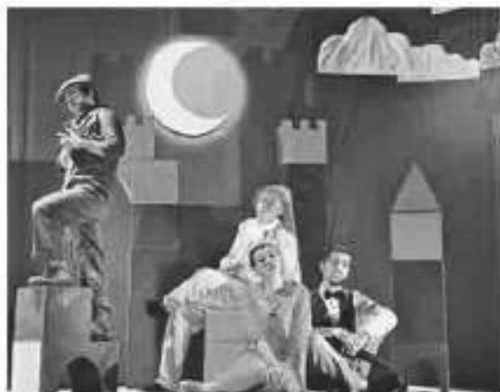
Cena do espetáculo “João Botão”, do Teatro Máquina, que integra a programação do II Festival de Teatro Infantil do Ceará.

8 Festival de Teatro Infantil do Ceará - de 6 a 14 de outubro, em Fortaleza e Sobral. Agendamento de sessões pelo telefone (85) 3181.6178. Programação completa em www.festival-tic.com . Programação completa do CDMAC de outubro no site dragadomar.org.br