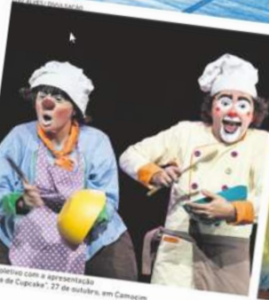
Os Os Colibri com a apresentação "Guerra de Cupcake", 27 de outubro, em Camocim

Des dias de programação teatral, infantil e acadêmica celebramos a nona edição do Festival Internacional de Teatro Infantil do Ceará (TIC) nesta sexta-feira, 4, e abrimos o palco do Festival Infantil da Magalhães que aproxima a cultura do teatro e do circo para o público infantil.