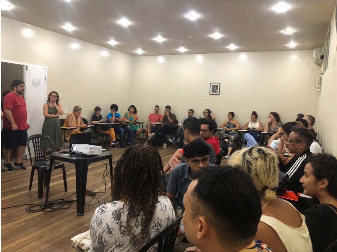
Alunos do Ciclo Base