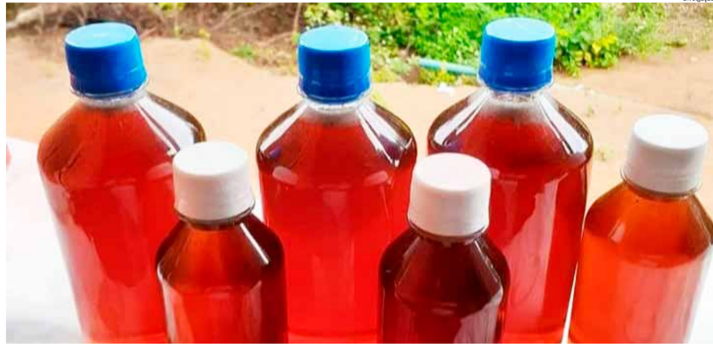
INVESTIMENTOS podem potencializar a produção de mel

Como incentivo, ele destaca que a associação Arca foi contemplada com uma casa de mel totalmente reformada e equipada com recursos do Fundo Internacional de Desenvolvimento Agrícola (Fida),