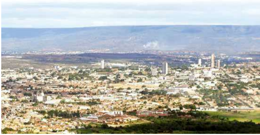
REFORÇO para ações no Crajobar será realizado pela Secretaria da Segurança Pública do Estado

O prefeito barbalhense solicitou ao governador a liberação de 20 profissionais