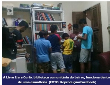
A Livro Livre Curió, biblioteca comunitária do bairro, funciona dentro de uma esmalteria.

Ele jogou a ideia no Facebook, os amigos ajudaram na doação de livros, estantes. Na esmalteria da mãe dele, há um mês nascia a Livro Livre Curió. Há 13 trabalhando com produção de eventos literários e mediação de leitura, não foi