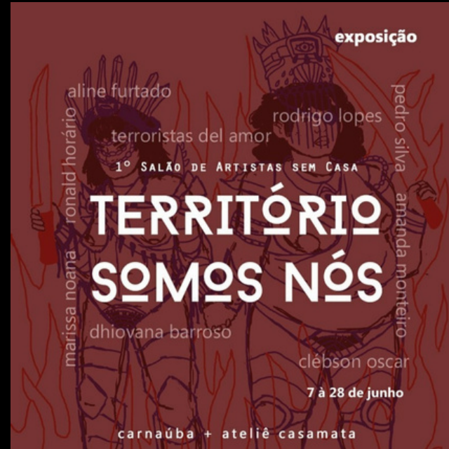
_produtor e assistente curadoria, montador e articulador da exposição.