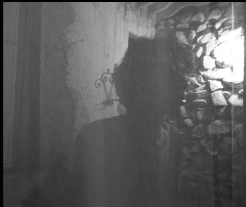
da montanha (2015)

https://dutraeu.bandcamp.com/album/polui-o