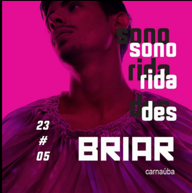
_programador/curador e técnico de áudio.