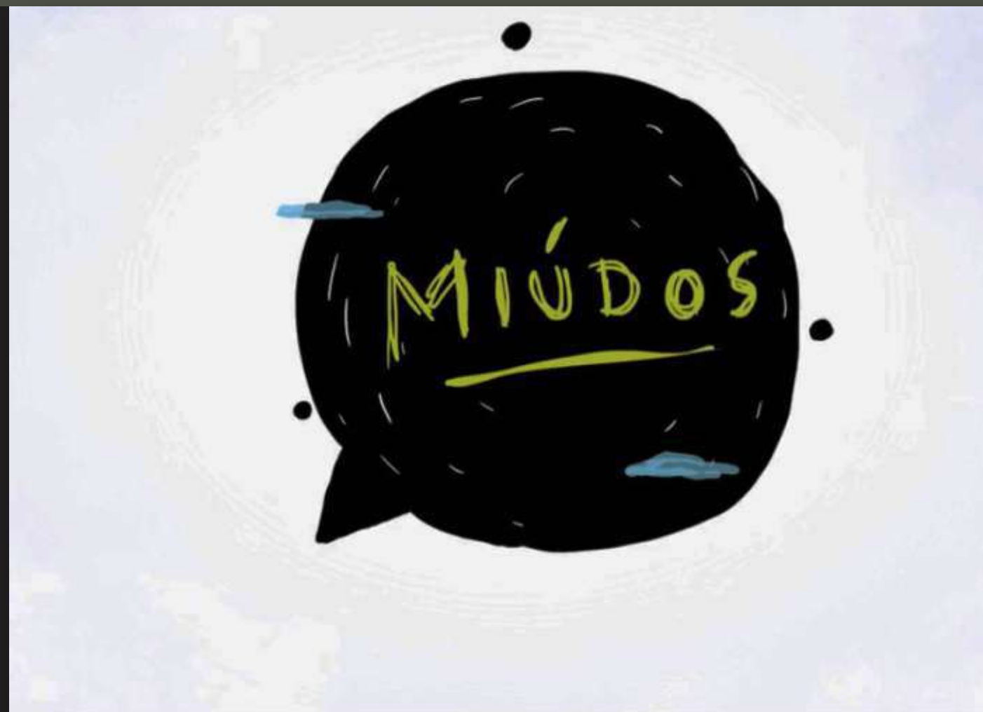
Tela da abertura da animação - Fortaleza-CE/2016.

Os curtas partem da narrativa em sequência de dez causos independentes que, no entanto, unem-se na perspectiva de trazer à tona cenas do cotidiano de forma divertida, lúdica e reflexiva. As temáticas em destaque correspondem tanto a assuntos da atualidade como aspectos que passariam despercebidos por olhos desatentos.