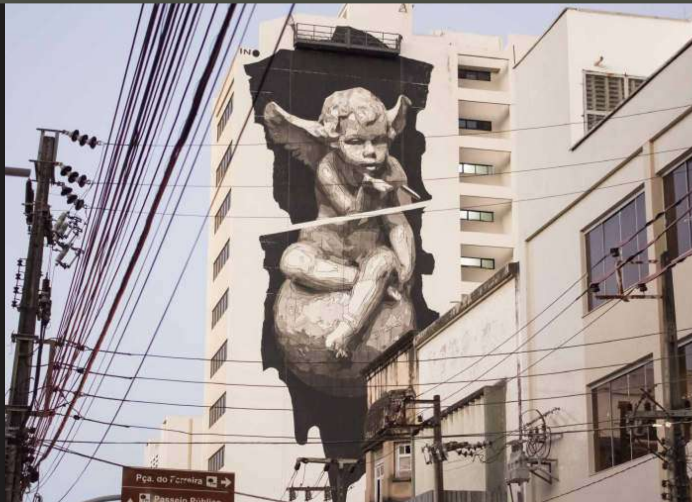
Primeiro painel de grandes proporções executado em Fortaleza-CE/2015.

Nas últimas edições tivemos um alcance de superior a 2.000.000 pessoas, participaram mais de 900 artistas locais, nacionais e internacionais, aproximadamente R$ 15.000.000,00 em retorno de mídia espontânea para os apoiadores, números que por si só referendam o Festival como o maior do Nordeste, em se tratando de arte urbana, e um dos principais do Brasil.