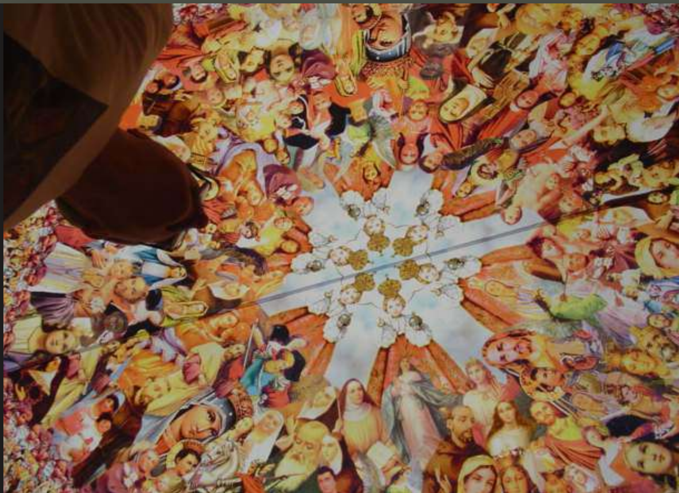
Rogai - Centro Dragão do Mar de Arte e Cultura - Fortaleza-CE/2006.

A exposição “Rogai” do artista visual Zé Tarcísio ocupou de forma inusitada o Museu de Arte Contemporânea do Centro Dragão do Mar de Arte e Cultura, onde as usuais paredes perdem seu protagonismo, fazendo com que o artista se apropriasse da arquitetura da edificação, que é formada por grandes aberturas zenitais em forma piramidal, que foram vestidas por lonas translúcidas, impressas digitalmente, pairando sobre as cabeças dos visitantes, com algumas das imagens produzidas para a série de obras do artista intitulada de caleidoscópio.