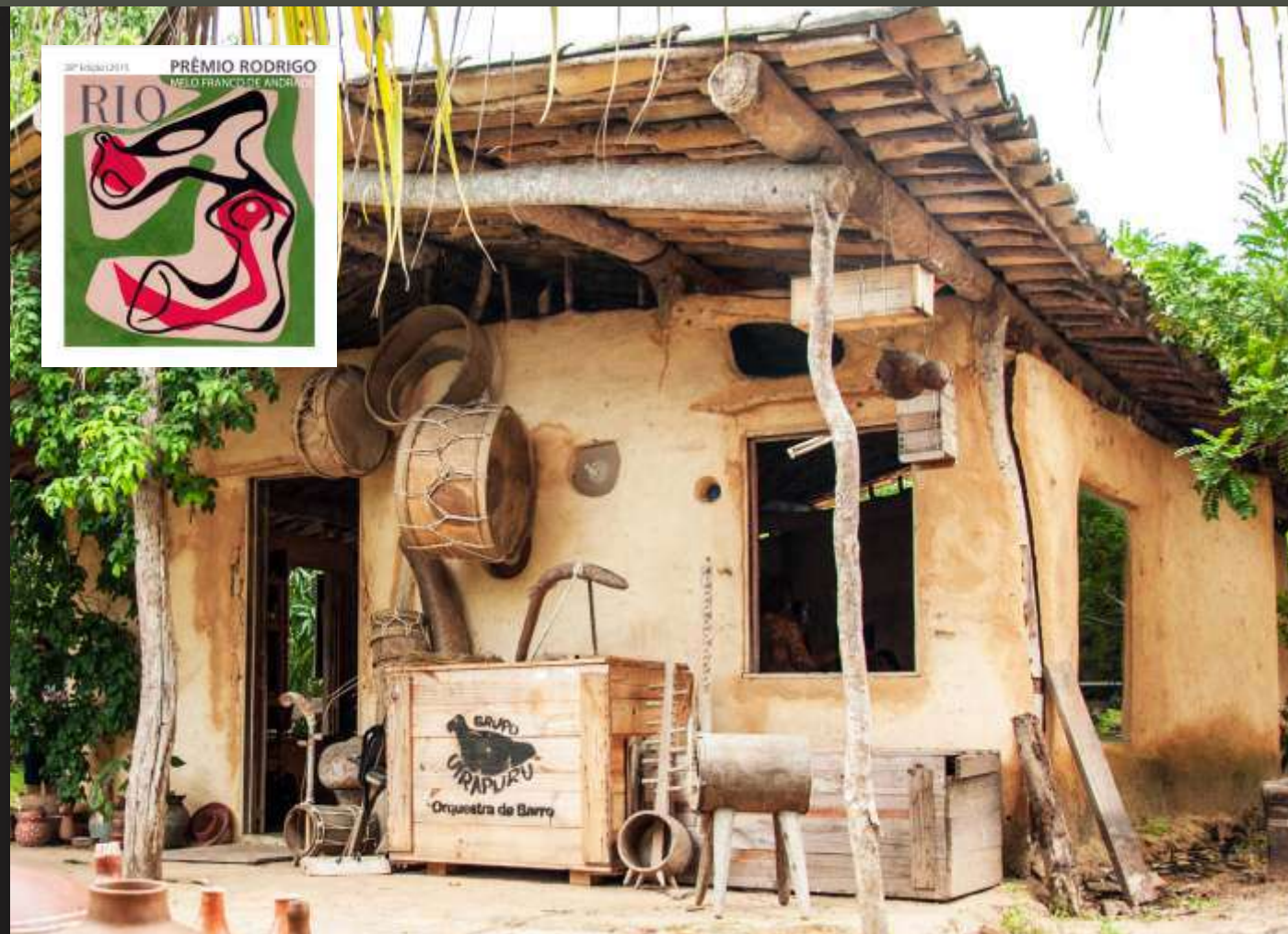
Espaço de ensaios do Grupo Uirapuru - Orquestra de Barro - Cascavel-CE/2015.

No ano de 2015 tivemos o reconhecimento do IPHAN através do prêmio Rodrigo Melo Franco de Andrade, como uma prática de salvaguarda nossa cultural que é patrimônio material e imaterial.