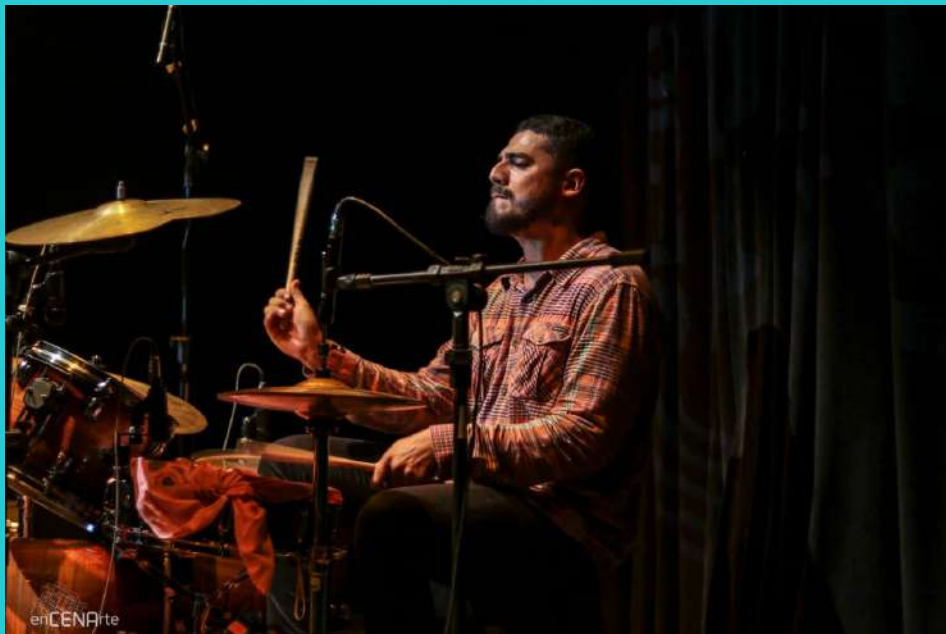
Show com a Cômodo Marfim - Banda na qual o artista é Baterista, Compositor e Produtor Executivo

É Empresário, Produtor Cultural, Produtor Executivo e diretor de arte na Quasares Produções, Estudante do curso de Engenharia Civil da UFCA e bolsista do Núcleo de Produção Cultural da Pró-Reitoria de Cultura da Universidade Federal do Cariri