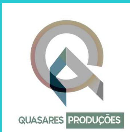
Quasares Produções Fundador - Produtor Executivo Design e Diretor de Arte