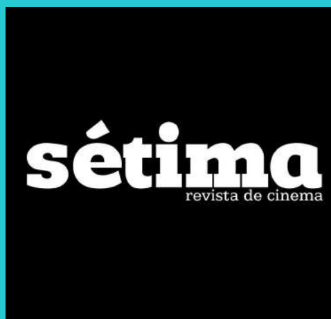
Sétima - Revista e Grupo de Estudos de Cinema Produtor Executivo e Tesoureiro