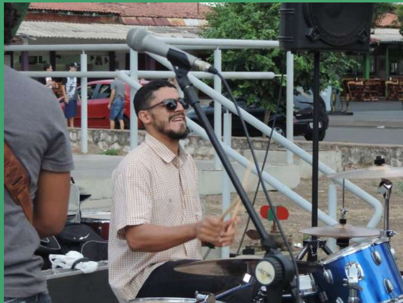
Rock de Calçada / 2017- Evento Colaborativo entre Músicos Produção - Gabriel Machado