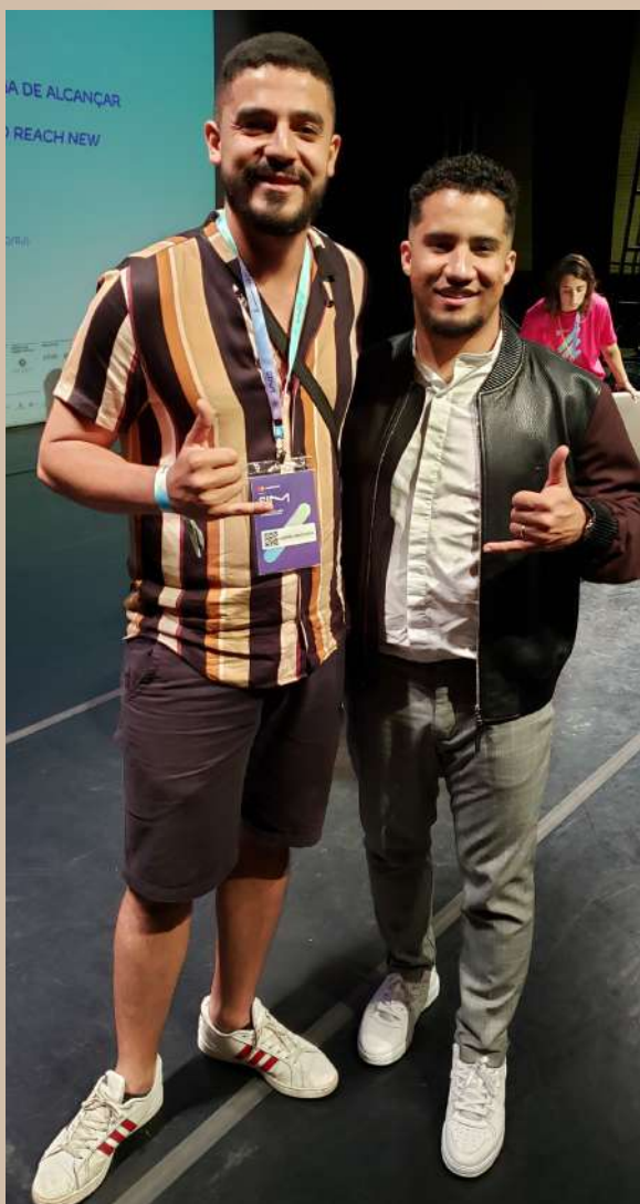
Presente no Painel do Kondzilla na Semana Internacional da Música 2019

Ao longo dos seus 10 anos como agente da cultura e pelo menos 07 anos como Produtor Cultural independente, atuando como empresário do segmento musical, participou de encontros e formações importantes que o auxiliaram na construção da sua atuação profissional e direcionamento artístico, tais como: Feira da Música-CE; Porto Musical-PE; Semana Internacional da Música-SP; Mostra Sesc de Culturas-CE; Troca de Saberes-CE; entre outros.