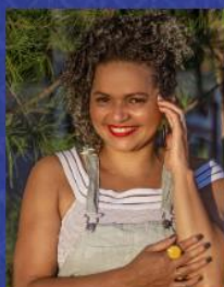
Conceição de Maria