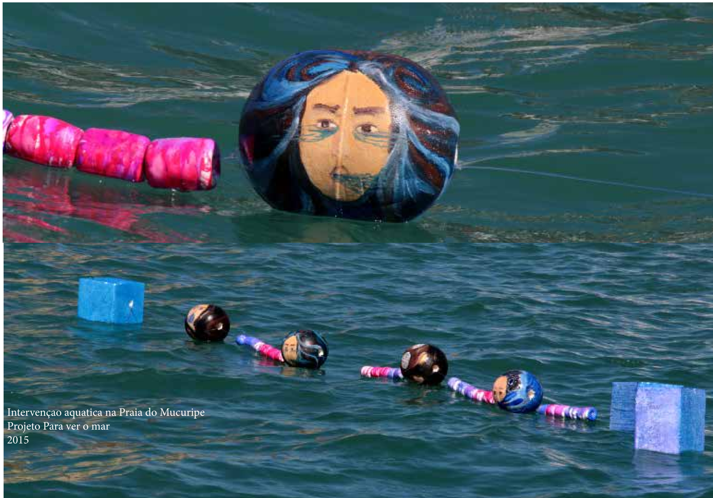
Intervenção aquática na Praia do Mucuripe Projeto Para ver o mar 2015