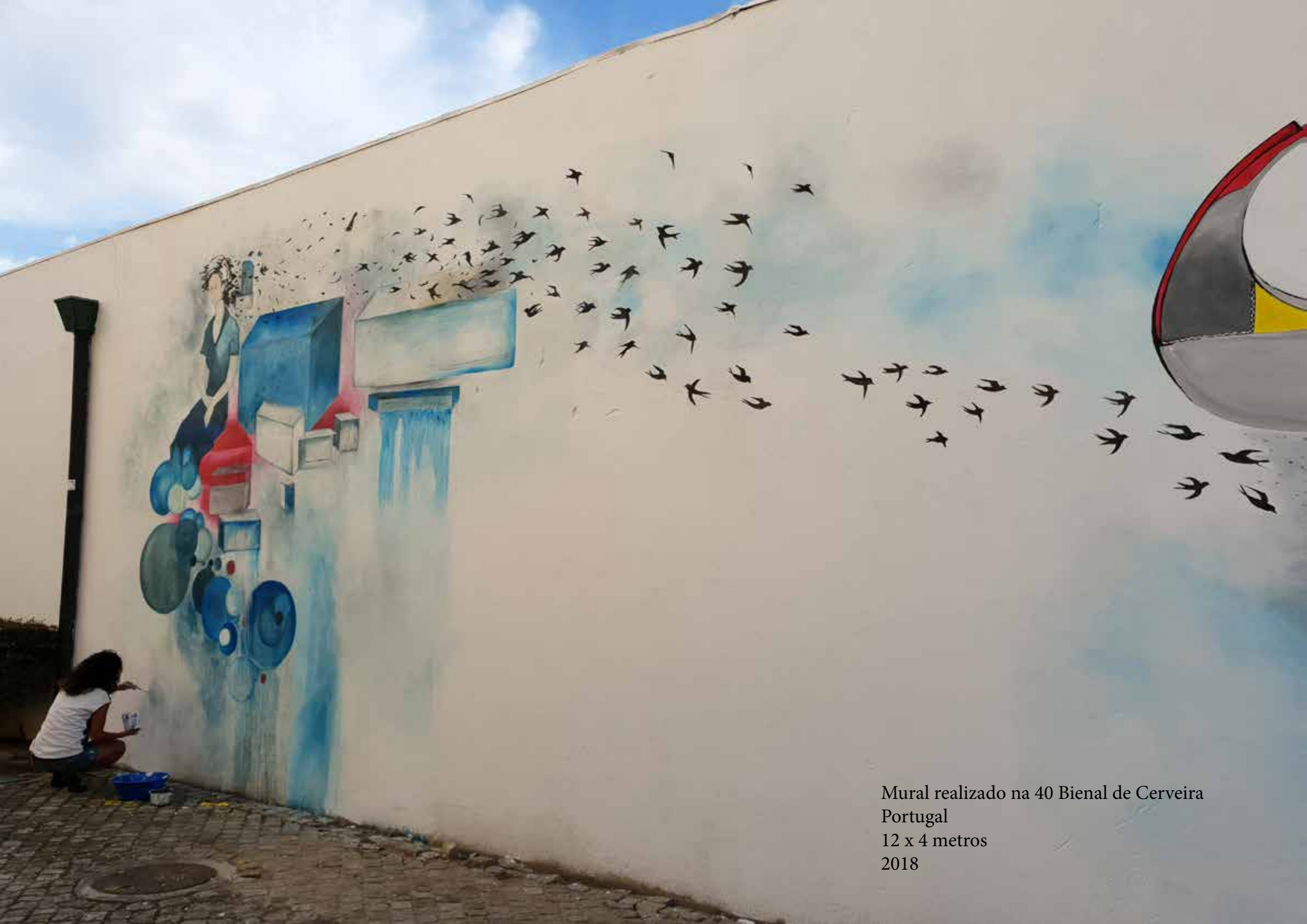
Mural realizado na 40 Bienal de Cerveira Portugal 12 x 4 metros 2018