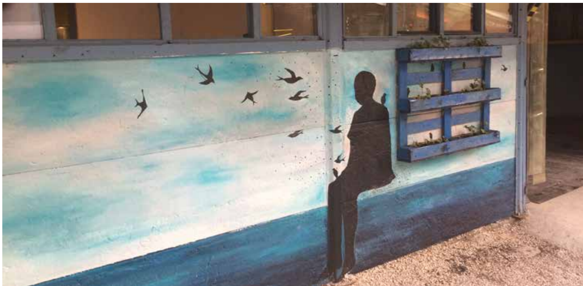
Mural "O embondeiro que sonhava pássaros" Budapest, Hungria Rua Raday 10, Rombusz, Centro 2017