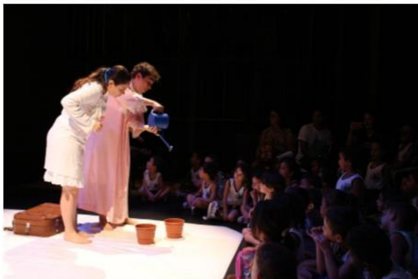
“Dona Menina” - Grupo KOs Coletivo