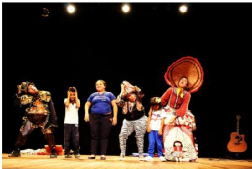
“Entra na Roda” - Comedores de Abacaxi S/A