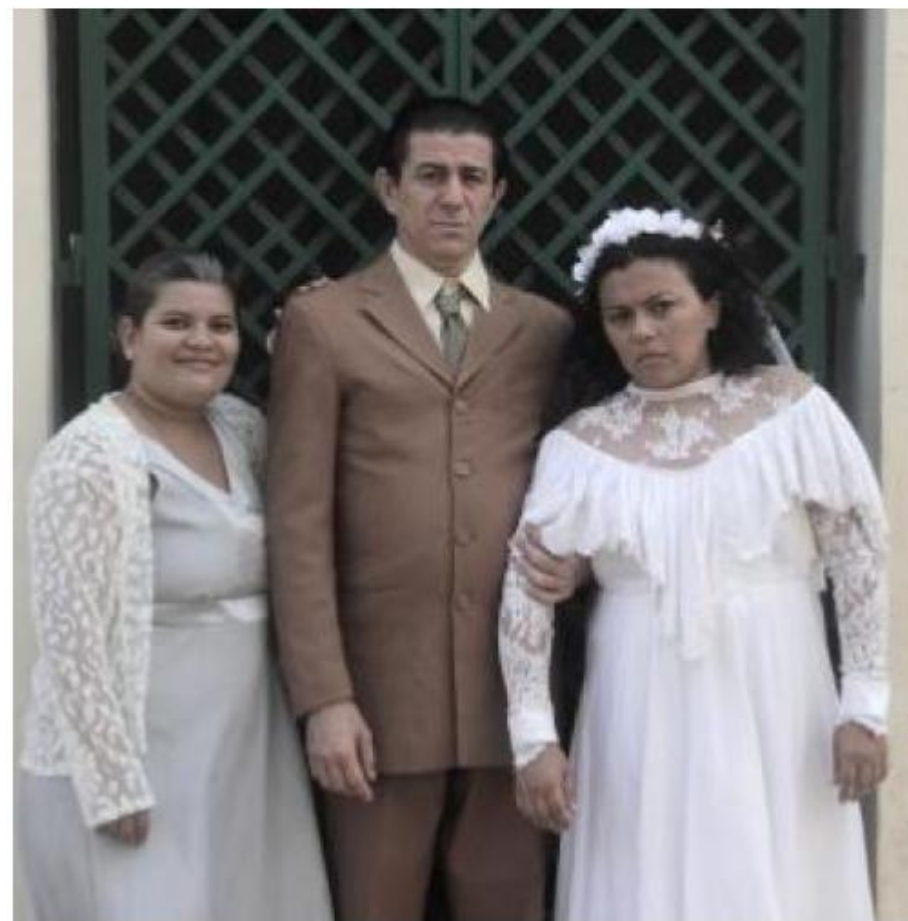
“Final de Tarde” - Teatro de Caretas