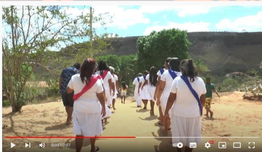
Figura 5 Episódio 03 | A Alegria da Dança do São Gonçalo no Quilombo Sítio Veiga

Trecho da Dança de São Dança Gonçalo | Parte I