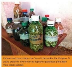
Parte do estoque coletivo da Casa de Sementes Pai Xingano. O grupo pretende diversificar as espécies guardadas para atender suas necessidades.