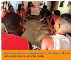
No projeto de leitura com crianças e jovens do Sítio Veiga é dialogado sobre a importância das sementes crioulas.

Os moradores do Veiga perceberam que suas sementes resistem melhor às condições climáticas da região, produzem espigas de milho maiores e maior quantidade de palha que serve de forragem para os animais. Além disso, há entre eles o propósito de não depender do fornecimento de sementes do governo, que muitas vezes atrasam e são de difícil acesso para os agricultores e agricultoras. Graças às experiências e híbridos são consideradas sementes sementes, que podem contaminar suas sementes crioulas, por isso zelam por sua casa de sementes, para que a biodiversidade seja mantida.