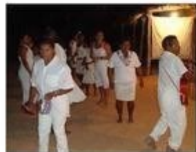
Manifestação cultural - Dança de São Gonçalo