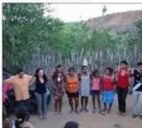
Curso - Gestão de Água para Produção de Alimentos

A dança de São Gonçalo, que acontece no mês de julho por ocasião da Caravana da Cultura – um costume do distrito, além de outros momentos quando as pessoas fazem promessas; o grupo de capoeira, e outras manifestações são parte destas características e manifestação da cultura local.