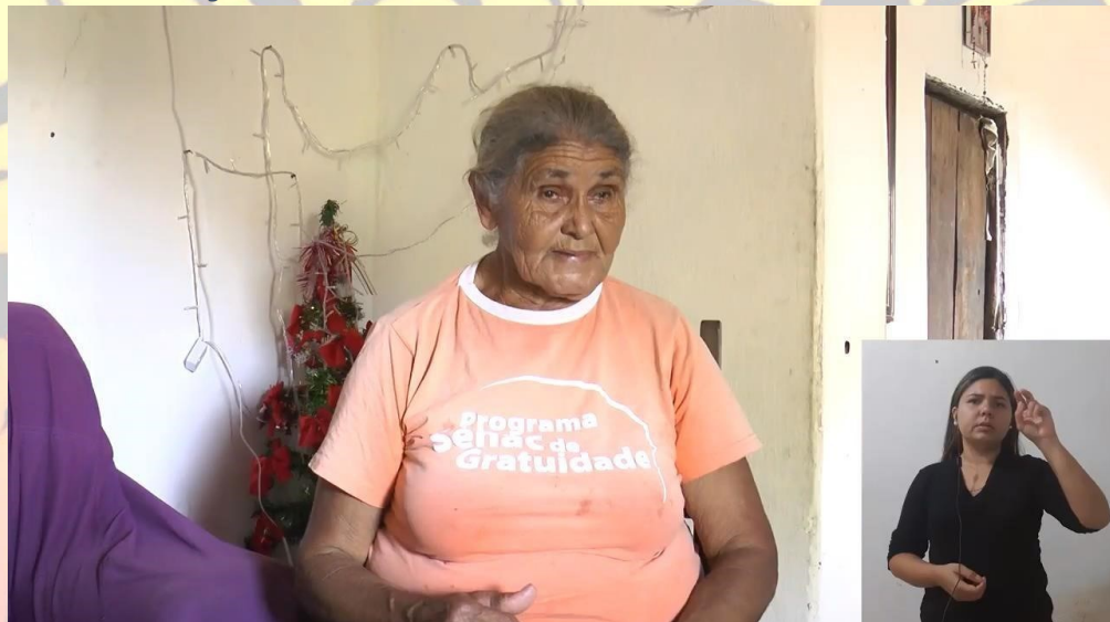
Figura 2 Edital Cidadania Cultural e Diversidade - Lei Aldir Blanc