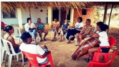
Rodas de conversa serão realizadas na IX Semana da Consciência Negra na comunidade quilombola do Sítio Veiga.

Até o próximo sábado (23) a Comunidade Quilombola do Sítio Veiga , na Serra do Estevão , distante 25 km do Centro de Quixadá, realiza a IX Semana da Consciência Negra . Palestras, rodas de conversa e atividades culturais são algumas das atividades iniciadas na manhã deste domingo (17) com um torneio quilombola.