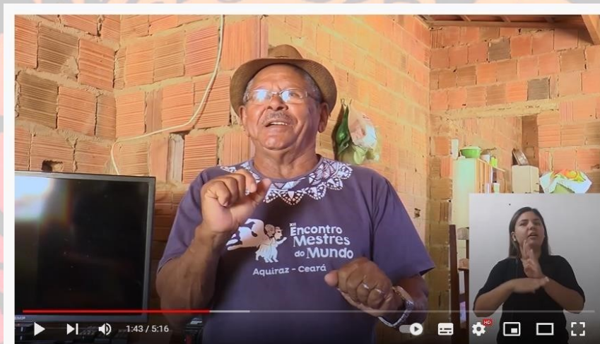
Episódio 02 | A Dança de São Gonçalo e Sua Origem no Quilombo Sítio Veiga - Luta e Resistência