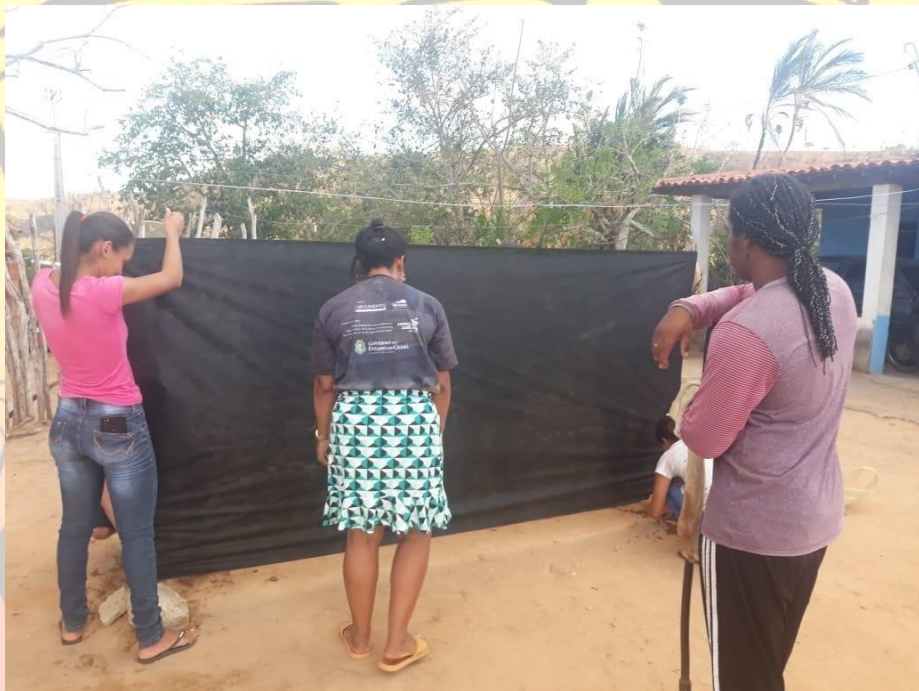
Figura 1 EDITAL DE PATRIMÔNIO CULTURAL DO CEARÁ - LEI ALDIR BLANC