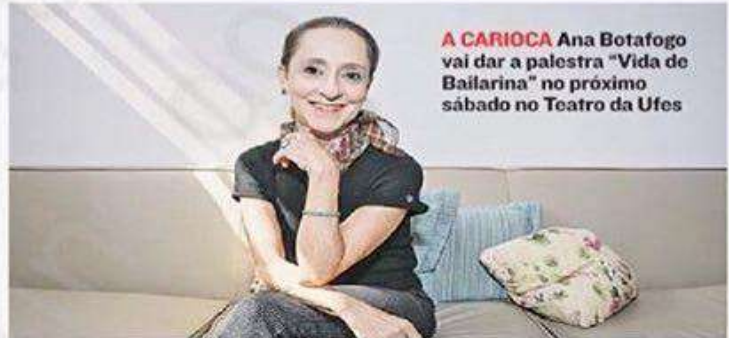
A CARIOCA Ana Botafogo vai dar a palestra "Vida de Bailarina" no próximo sábado no Teatro da Ufes