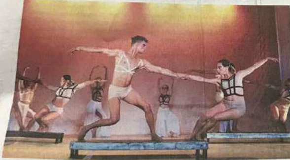
RELIGARE Espetáculo da Edisca vai ser apresentado durante o FVA. O Quinze, a escassez da alma (abaixo), o Bcad é outra das atrações da programação