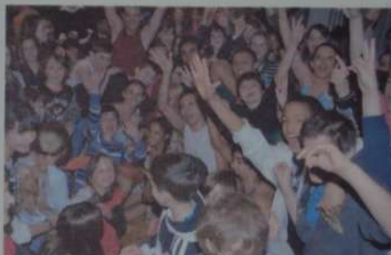
Mit den Tänzern auf der Bühne. Den Schülern hat es sichtlich Spaß gemacht.